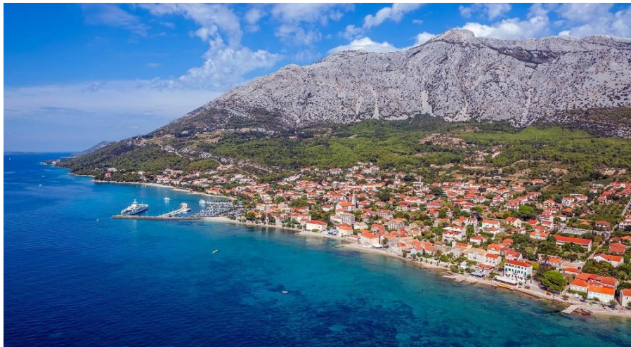
Slika 2. Orebić 3

živjelo u Orebiću. 2 Migracije su na tom području počele već od 1814. godine ulaskom teritorija u sastav austrijske Dalmacije. Budući da je područje Pelješca bilo razvijenije od ostatka Dalmacije, migracijski su tokovi bili usmjereni prema tom kraju (Vekarić u Glamuzina, 2009: 36). U 19. stoljeću, zbog teških gospodarskih prilika, počinje proces emigracije peljeških kmetova u Novi svijet, a proces iseljavanja traje i danas. Pelješac danas bilježi nisku stopu prirodnog prirasta, dok orebićka regija ima mali prirodni pad: „Za obnavljanje je najzaslužniji Orebić, dok seoska naselja, posebno ona izolirana imaju u pravilu negativno prirodno kretanje” (Glamuzina 2009: 155–156). Migracijski utjecaji osjete se i u samom govoru Orebićana koji su se sve više počeli priklanjati štokavskom narječju, a sve manje čakavskom koji je donedavno bio najzastupljeniji.