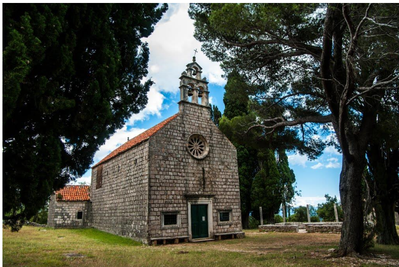
Slika 3. Crkva Gospe Karmelske u Karmenu 6