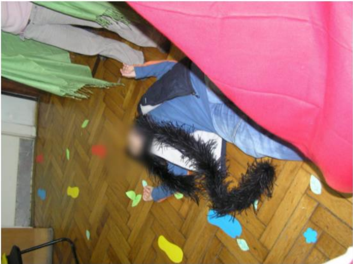
Slika 10. Pauk umire