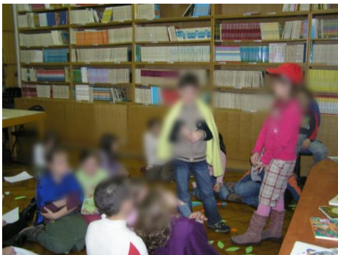
Slika 8. Maslačak i bubamara