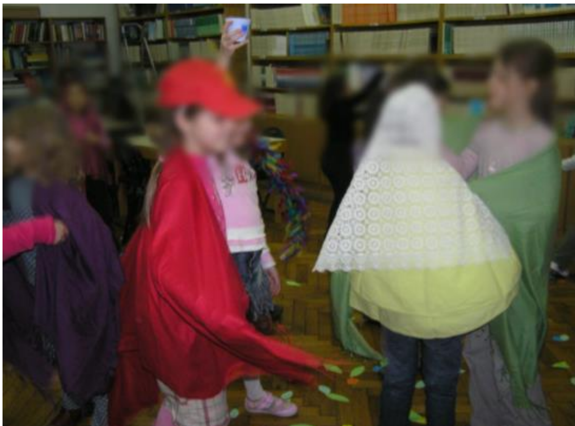
Slika 12. Proletni ples