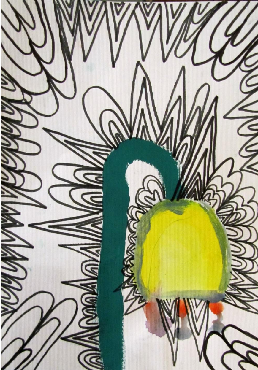
Slika 6. Učnikov rad