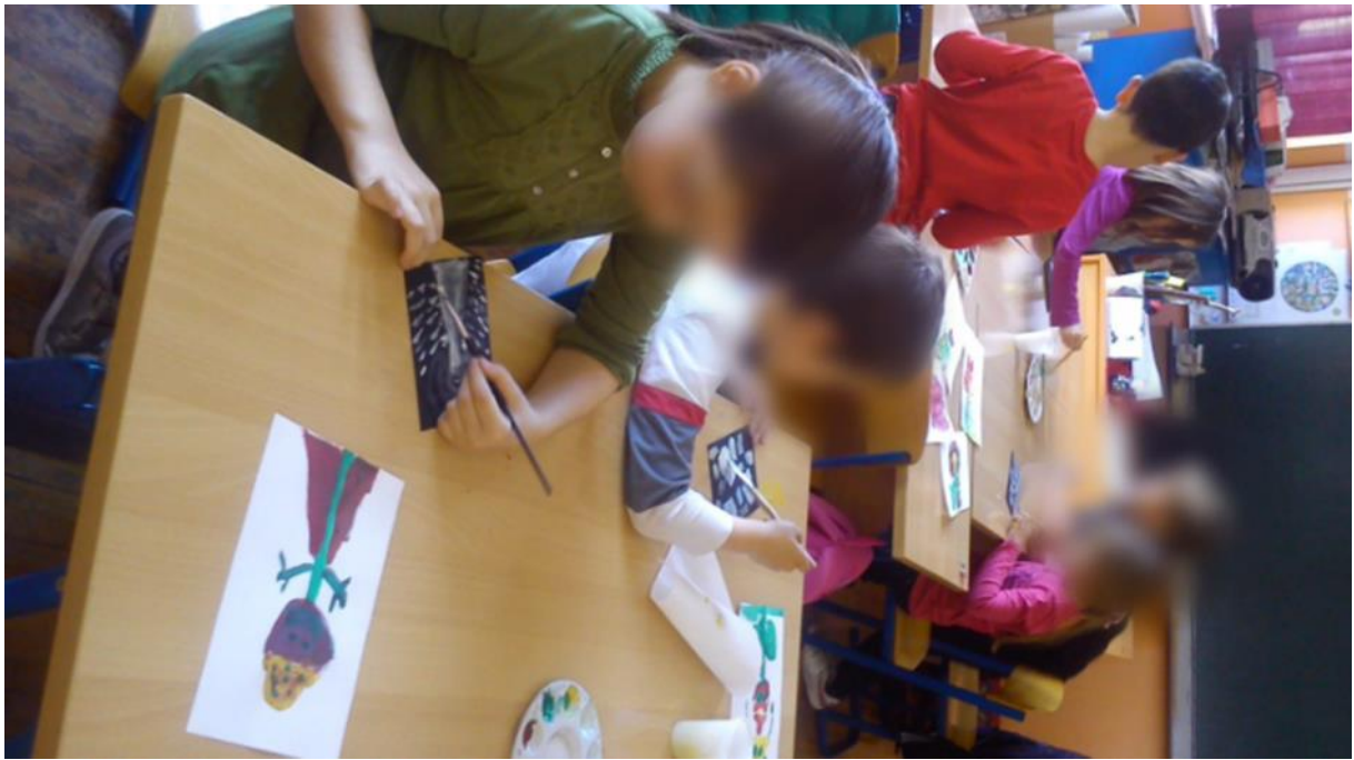
Slika 2. Učenici slikaju cvjetove