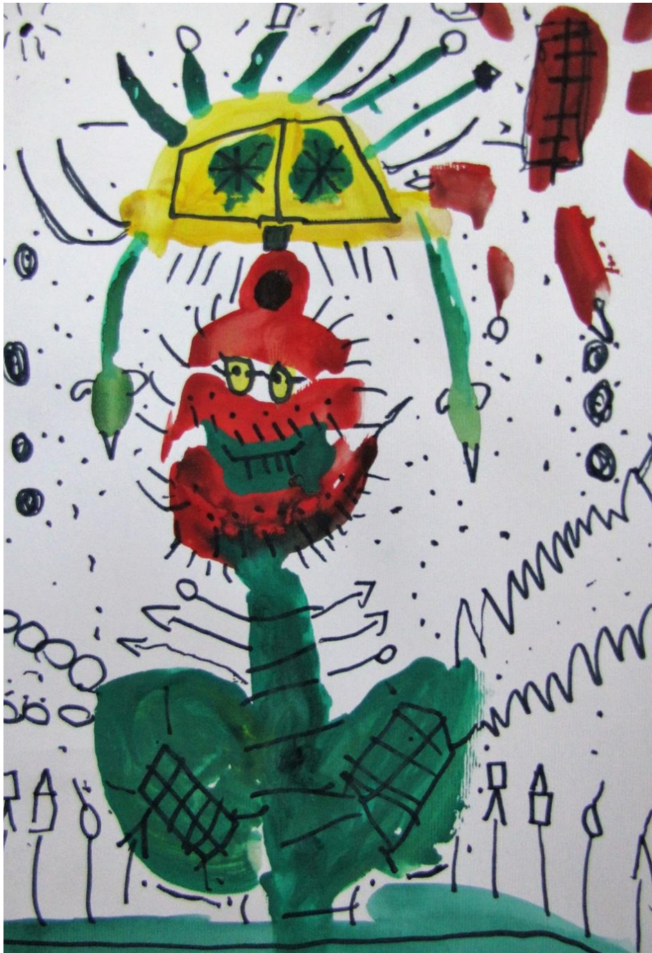
Slika 3. Učnikov rad