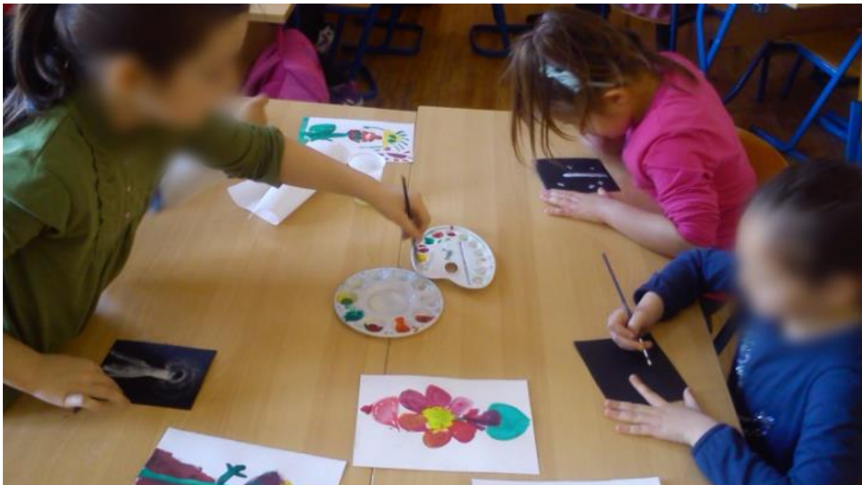
Slika 1. Učenici OŠ Spinut slikaju plesne haljine cvjetova

Pljeskom se vraćamo u stvarni svijet. Učenici izražavaju dojmove.