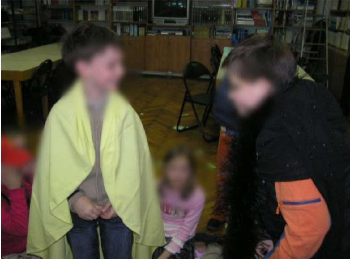
Slika 9. Maslačak i pauk