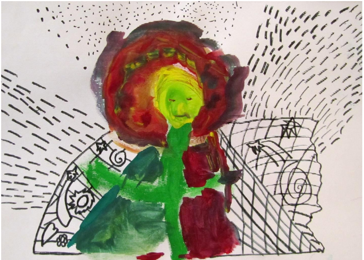
Slika 5. Učnikov rad