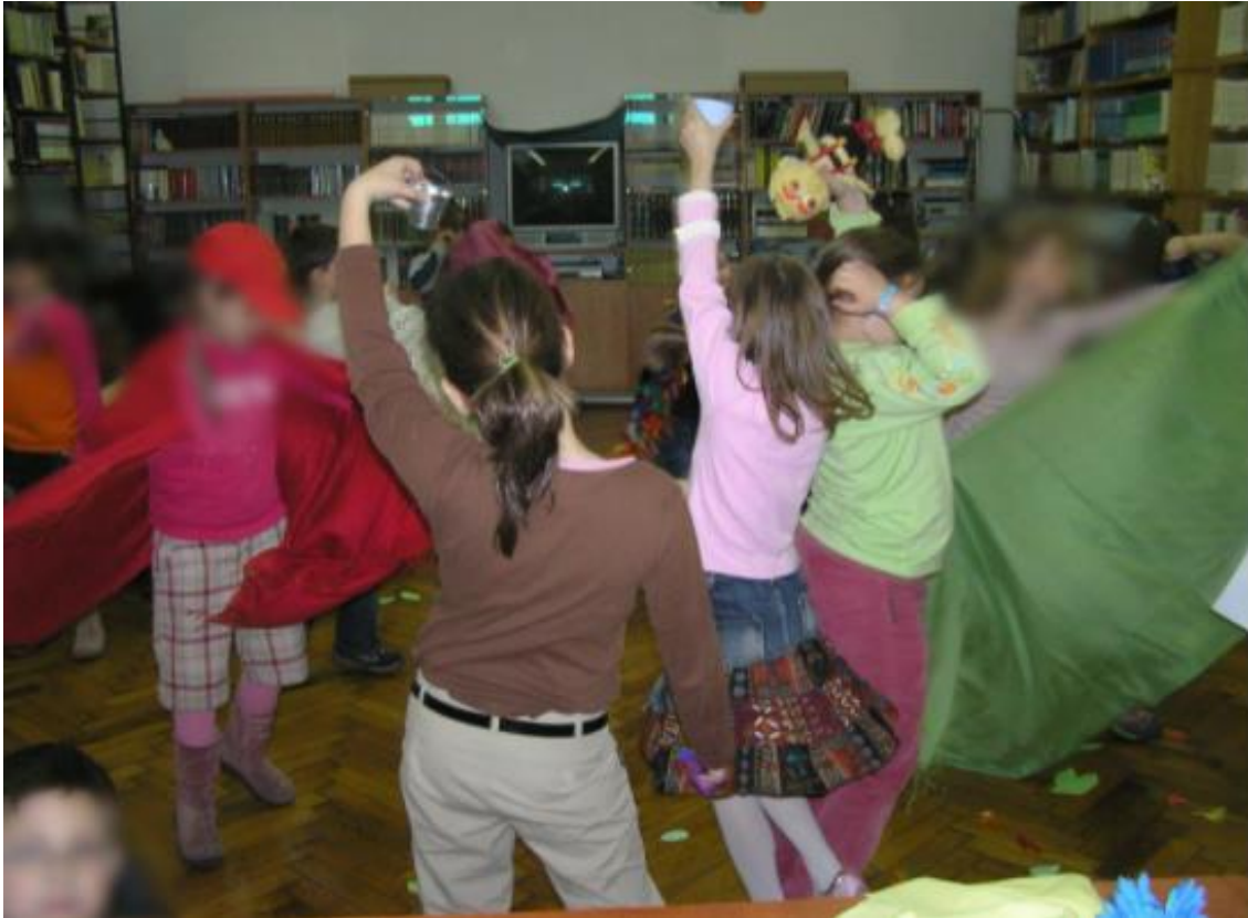
Slika 11. Proletni ples