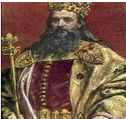
Slika 1 Bosanski kralj Stjepan Dabiša

Da je Ljubuški kraj nastanjen od starih vremena svjedoči nam darovnica bosanskog kralja Stjepana Dabiše, nasljednika loze Kotromanovića. U njoj, 1395.g., kralj Stjepan daruje selo Veljake u Humskoj zemlji svojoj kćeri Stani, a nakon njezine smrti treba ga naslijediti njezina kćer Vladica i njezin muž knez Juraj Radivojević. U darovnici se navode i brojni svjedoci, kao i kletva kojom se proklinje svatko tko isto opovrgne. Darovnica je sačuvana i danas se čuva u Državnom arhivu Bosne i Hercegovine u Sarajevu. 2