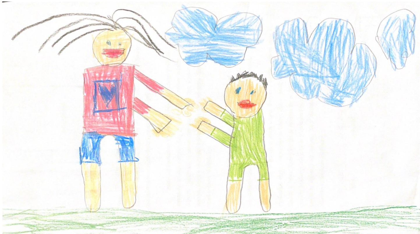
Slika 4. F.Š

Odgojiteljica potiče dječaka da, nakon razgovora o okruženju u kojem odrasta, nacрта ono što želi prema vlastitom nahođenju. Prema vlastitom nahođenju dječak je krenuo crtati. Tijekom crtanja provjeravao je gleda li itko od njegovih prijatelja što on to crta.