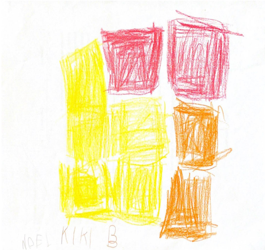
Slika 5. N.S.

Odgojiteljica potiče dječaka da, nakon razgovora o okruženju u kojem odrasta, nacrtá ono što želi prema vlastitom nađođenju. N.S. je izrazio želju da ga nitko ne gleda dok crta jer je želio je da njegov crtež bude iznenađenje.