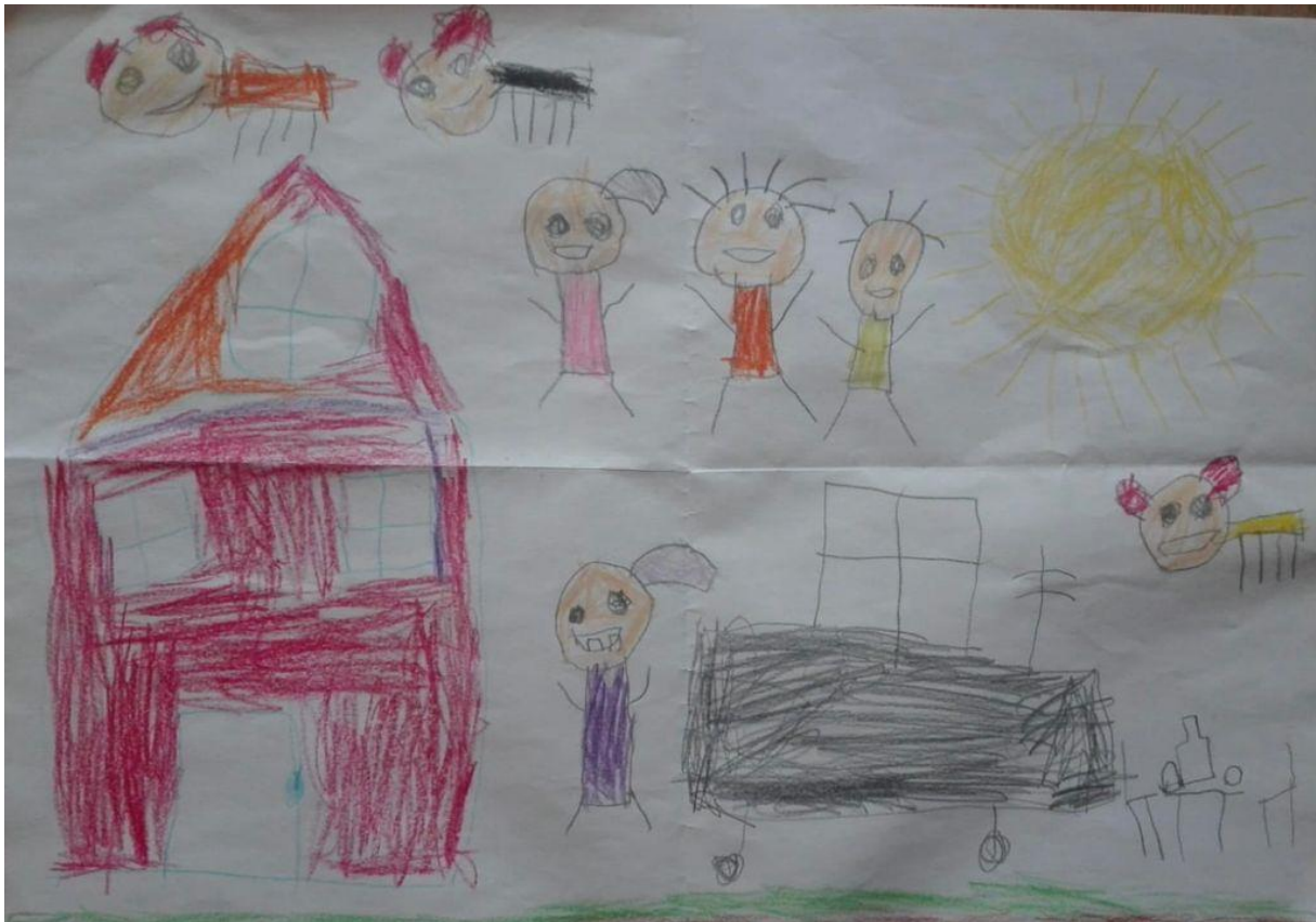
Slika 10. L-M..V.

Dječak prilikom razgovora o crtežu navodi nacrtao sam svoju obitelj. S mojom obitelji su i didovi kućni ljubimci na otoku Pagu. Na upit odgojiteljice bi li želio što promijeniti ističe kako ništa ne bi mijenjao.