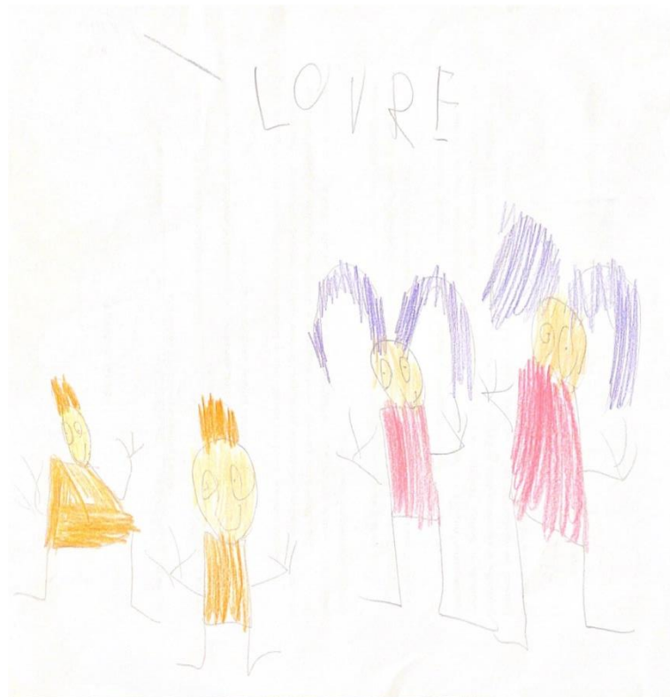
Slika 7. L.A.

Nakon provedenog razgovora s odgojiteljicom o okruženju u kojem odrasta, a odgojiteljica ga potiče da nacрта ono što želi . Dječak je s veseljem dočekao ovaj dio našeg razgovora. Nakon što je završio svoj crtež dječak ga je podijelio s cijelom skupinom i želio je svima reći što je on nacrtao.