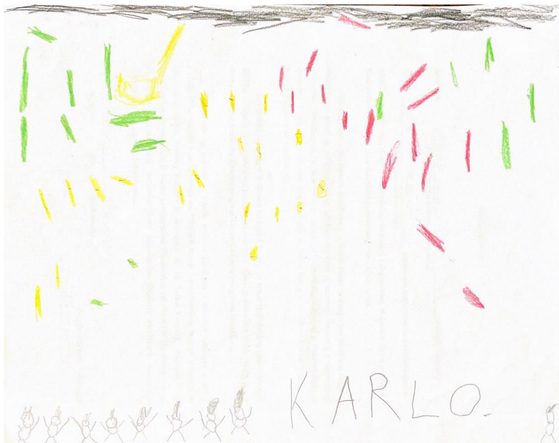
Slika 3. K.K.

Odgojiteljica potiče dječaka da, nakon razgovora o okruženju u kojem odrasta, nacрта ono što želi prema vlastitom nahođenju. K.K. je tijekom crtanja razgovarao s odgojiteljicom o crtežu, opisujući dio po dio. Dječak je s veseljem dočekao ovaj dio našeg razgovora. Inače voli pokazivati svoje likovno umijeće roditeljima pa je htio pokazati i ovaj.