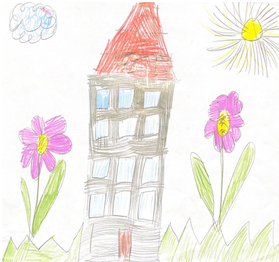
Slika 9. T.R.

završila razgovor s odgojiteljicom, odgojiteljica joj pruža poticaj da nacрта ono što želi prema vlastitom nahodenju.