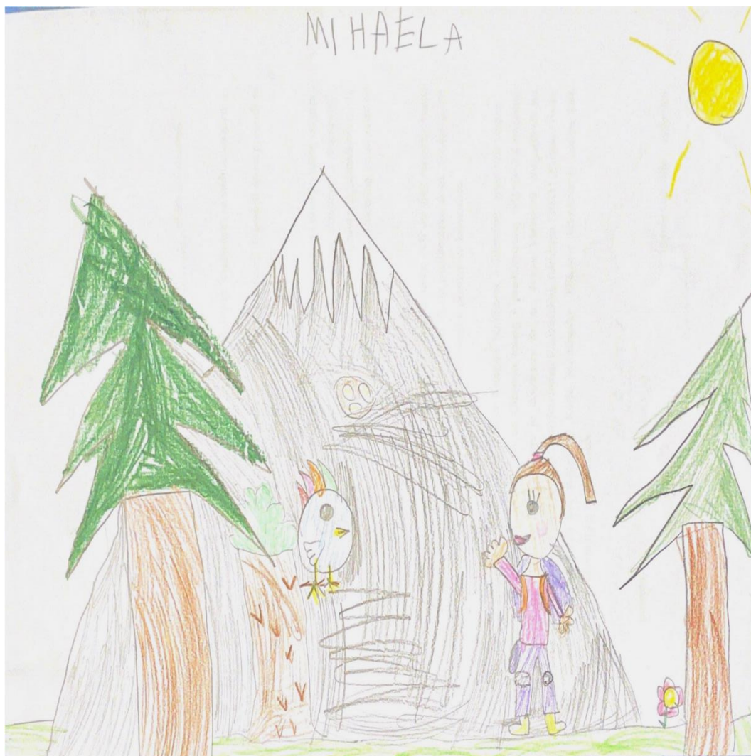
Slika 8. M.B.

Kada joj je potrebna pomoć obraća se starijima koji se nalaze u njoj okolini. Kada mi je potrebna pomoć pitam starije kao što je teta, mama ili tata. Nakon što je djevojčica završila razgovor s odgojiteljicom, odgojiteljica joj pruža poticaj da nacrtá ono što želi prema vlastitom nađođenju.