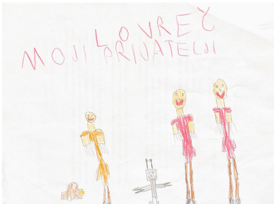
Slika 1. L.Č.