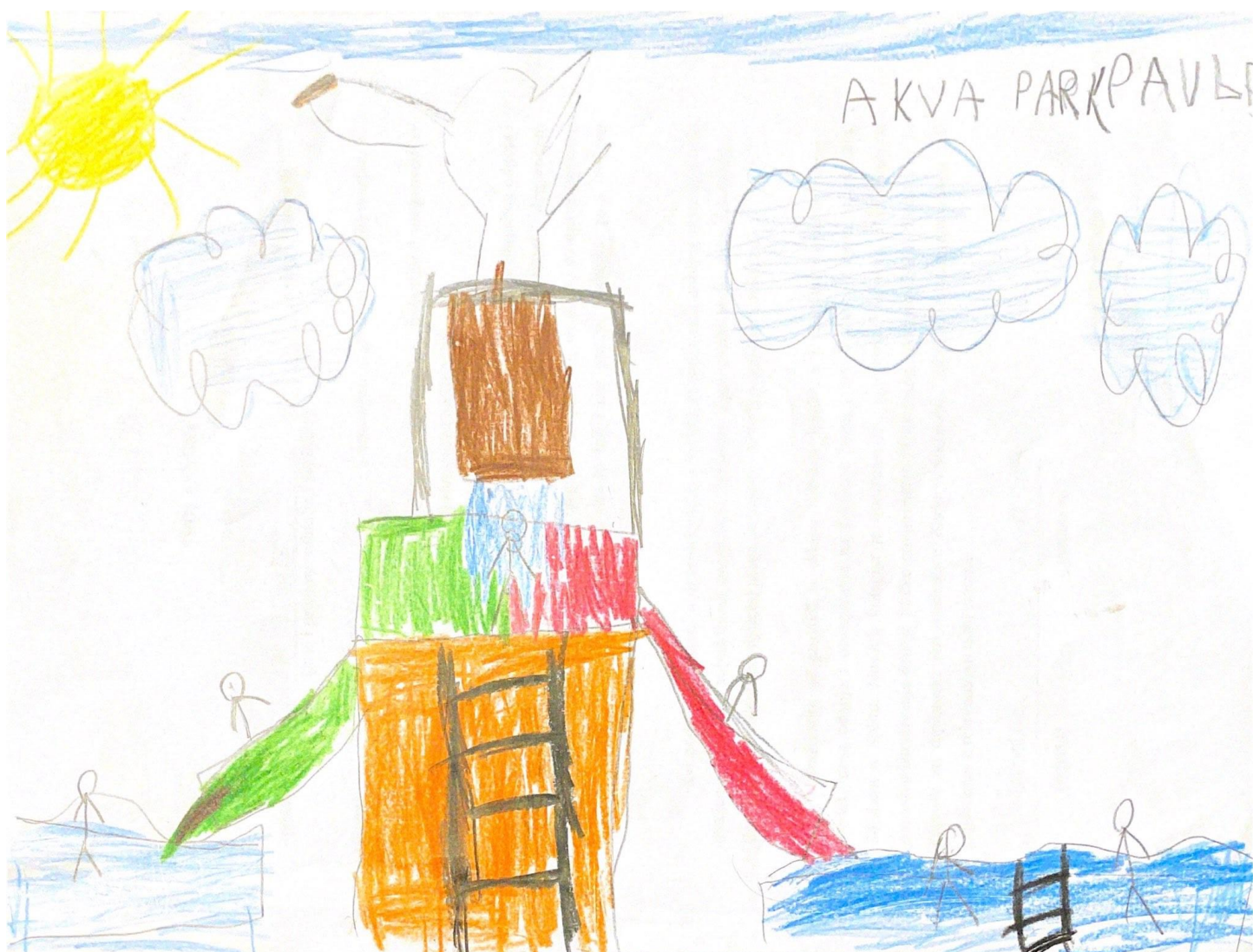
Slika 2. P.R.

Odgoviteljica potiče dječaka da, nakon razgovora o okruženju u kojem odrasta, nacрта ono što želi prema vlastitom nahođenju. P.R. je tijekom crtanja razgovarao s odgojiteljicom o crtežu, opisujući dio po dio. Iskazao je želju da svoj crtež podijeli s ostalom djecom u skupini.