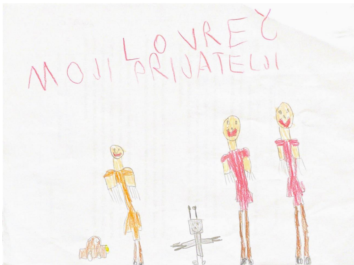
Slika 1. L.Č.