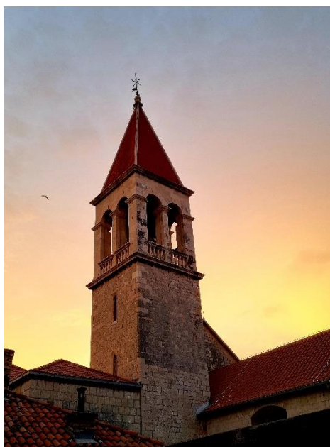
Slika 32. Zvonik crkve Gospe od Pojišana u Splitu