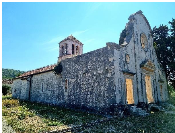
Slika 14. Pogled na bočne zidove

Nažalost, u potpunosti nova crkva, nije sagrađena pod Macanovićevim vodstvom. Ponestalo je novca i projekt je na određeno vrijeme prekinut. S vremenom su mještani sakupili ponešto novca kako bi se rad na crkvi nastavio. Nakon dvije godine rada na župnoj crkvi u Velom Drveniku, ponovno dolazi do prekida i od tada stoji samo nedovršeno pročelje nove župne crkve iz razdoblja kasnog baroka. 74