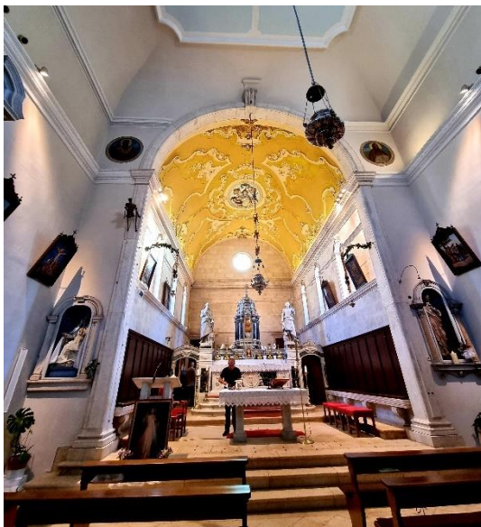
Slika 5. Apsida štafilićke crkve

Ignacije u dogovoru sa sinom Franjom uklanja prethodno sagrađenu apsidu i podiže novu. 46 Franjo Macanović preuzima zadatak rušenja stare i presvođivanja nove apside prema nacrtima Gašpara Kršovanija (Keršovanija) i Frane Cicindelle. 47 Štukature na svodu izradio je talijanski štukatur Giuseppe Montevinti. 48