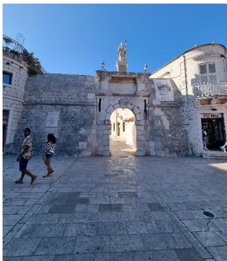
Slika 15. Kopnena gradska vrata u Trogiru