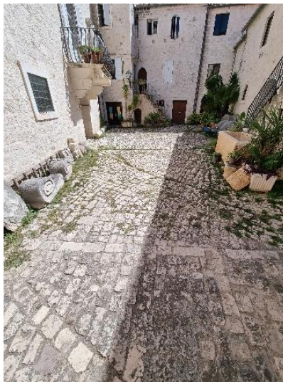
Slika 24. Izvorno popločenje na istočnom dijelu i obnova popločenja na zapadnom dijelu unutarnjeg dvorišta palače Garagnin Fanfogna

novijeg popločavanja glavne ulice u 19. stoljeću, ideja i raspored će ipak ostati onakvim kakvim je Macanović to zamislio u svoje vrijeme. 110 Ignacije uređuje i trg pred palačom Garagnin Fanfogna i unutrašnje dvorište palače. Za popločenje dvorišta Garagnin Fanfogna 1765. godine dovedeno je kamenje iz Korčule. Prolaz koji vodi u dvorište i dvije trećine popločenja na istočnom dijelu izvorni su Macanovićev rad, dok je zapadni dio rezultat kasnije obnove. Za popločenje se koriste uži kameni blokovi postavljeni na nož, dok je zapadni dio izveden u nešto pravilnijim oblicima kamena. Korištenjem dijagonala i pravokutnih polja na trapezoidnom obliku dvorišta dobio se dojam zrakastog širenja. 111