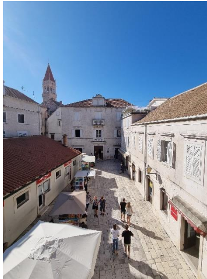
Slika 19. Trg unutar Kopnenih gradskih vrata

Stražarica (vojarna) je prizemnica prekrivena crijepovima u kojoj su nekada boravili čuvari kopnenih vrata. Unutrašnjost vojarne bila je podijeljena na dva dijela sudeći prema nacrtu mletačkog inženjera F. G. Rossinija. U jednoj prostoriji se živjelo, a druga je služila za ostavu oružja i opreme. 87 Južno od stražarnice uzdiže se reprezentativno pročelje palače Garagnin Fanfogna. Današnja palača obuhvaća tzv. novu kuću, prvobitnu palaču Garagnin, dva dvorišta, cisternu s terasom, vrt, štalu, hodnike i stepeništa. 88 Kako opisuje profesor Ivo Babić: „Na pročelju nove zgrade koju je projektirao Macanović simetrično su raspoređeni pravokutni okviri prozora s profiliranim nadvratnicima, reprezentativni glavni portal, te jednostavna dućanska vrata s otvorom tipa na koljeno.“ 89 „Vrata na koljeno“ na bočnim strana glavnog pročelja nekada su vodila u prostor prodavaonice. Drugi kat tzv. nove kuće krase balkon s profiliranom balustradom. Nova palača imala je vanjske stepenice koje su dijelile palaču od susjedne kuće, koja je također bila u vlasništvu obitelji Garagnin. 90