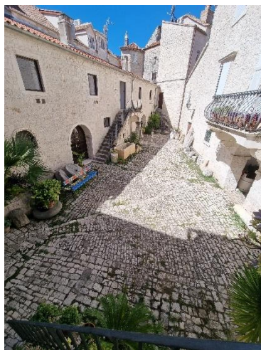
Slika 20. Izvorno popločenje između nekadašnjeg stambenog i gospodarskog dijela kuće

prizemlju uz troja vrata. Danas je to prostor lapidarija, a između stambene i gospodarske kuće i dalje stoji izvorno popločenje s korčulanskim kamenom. 93