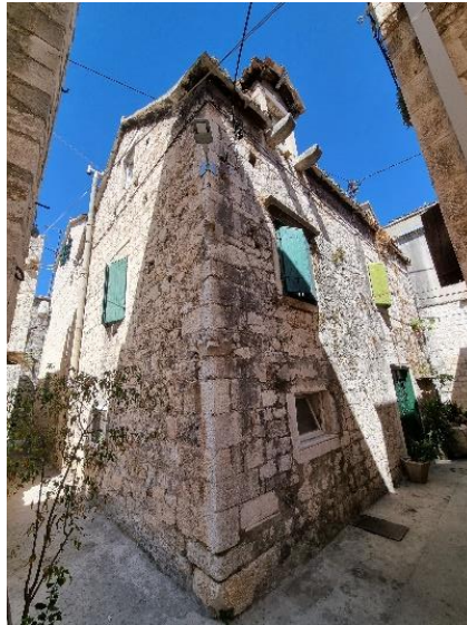
Slika 9. Kuća obitelji Macanović u Ulici Matice hrvatske pod br. 35, Trogir

Ivo Babić vidi stilske sličnosti gornjeg dijela pročelja crkve Gospe od Karmela s pročeljem (krivuljama i volutama) na Zdravstvenom uredu u Trogiru. Ponavlja se i motiv kugle zabijene na vrh pročelja na crkvi Gospe od Karmela i nad zabatom Zdravstvenog ureda u Trogiru. Oba rada pripisuju se Ignaciju Macanoviću. Slični završeci pročelja s krivuljama uočeni su i na nedovršenoj crkvi sv. Jurja na Drveniku. Ivo Babić iznosi pretpostavku da je Ignacije Macanović, zajedno sa svojim suradnicima, preoblikovao i zvonik i crkvu Gospe od Karmela u baroknom stilu. Babić drži da je Macanović zaslužan za ugrađivanje spolija, odnosno reljefa sa srednjovjekovnog sarkofaga na crkvi. 70