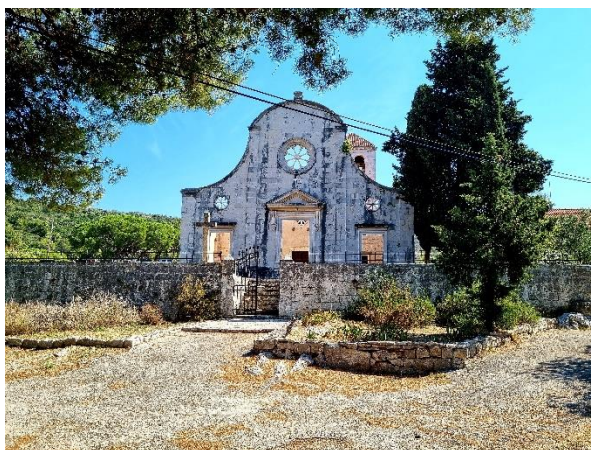
Slika 12. Nedovršeno pročelje novijeg dijela crkve sv. Jurja na Velom Drveniku

Župna crkva sv. Jurja nalazi se na malom brežuljku smještenom iznad seoske luke na otoku Veli Drvenik smještenom u splitskom akvatoriju. Crkva sv. Jurja sastoji se od dva dijela, starijeg i novijeg. Sjeverni dio crkve bio je proširen između 1724. i 1725. godine, a 1729. godine južni dio. Tom prigodom sagrađena je samo nova fasada crkve, a iza nje se nalazi crkva iz 15. stoljeća. 71