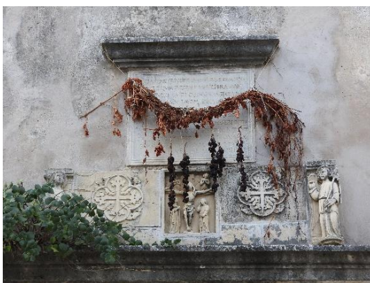
Slika 11. Reljef sa srednjovjekovnog sarkofaga na crkvi Gospe od Karmela u Trogiru