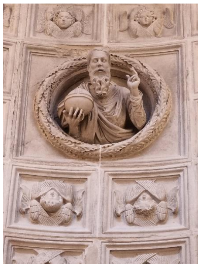
Slika 26. Kopija Firentičevog originalnog Poprsja Boga Oca, rad Ignacija Macanovića u kapeli bl. Ivana Trogirskog