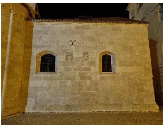
Slika 29. Prozori sakristije trogirске katedrale