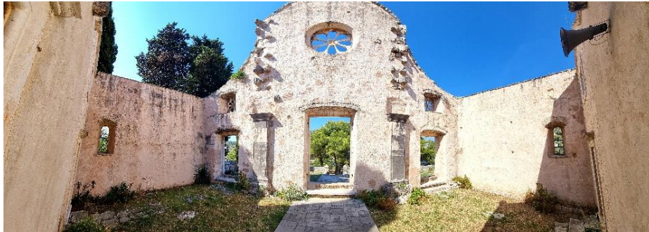
Slika 13. Pogled na unutrašnje zidove

pročelje. Plitki pilastri prividno dijele pročelje na tri dijela. Središnji portal ukrašen je florealnim motivima koji se nalaze na dovratnicima kamenih okvira vrata. Upravo takve elemente pronalazimo u Macanovićevom opusu. Iznad svakog otvora za vrata postavljena je rozeta. Najveća i najraskošnija nalazi se nad središnjim portalom. Pročelje u visinu završava u obliku polukružnog zabata koji se sa bočnih strana polagano spušta na nižu razinu. 73