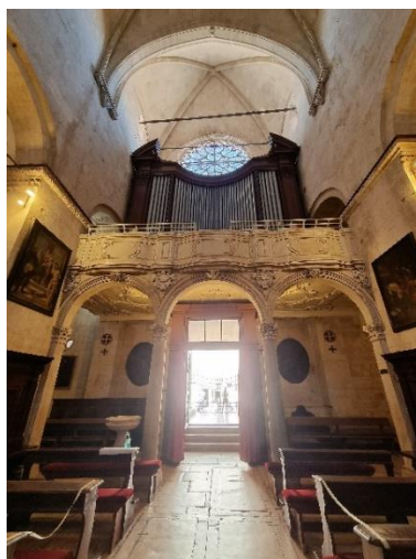
Slika 27. Barokna pjevnica u trogirskoj katedrali

Kako bi sudjelovao u još jednom projektu u stolnoj crkvi, Macanović napušta Brač i 1769. godine vraća se u Trogir zbog uzdizanja pjevnice čiji je pothvat zahtijevao njegovu nazočnost. Pjevnica je u početku trebala biti radom protomajstora Antuna Boare i Petra Cavalierija od kojih su obojica bili kipari koji su klesali razne reljefne ukrase. Cavalieri međutim umire, pa se Macanovića poziva da dođe s Brača. 116 U rujnu se ukopavaju temelji za pjevicu i rade nacrti koji se zatim šalju Mlečanima na procjenu. Barokna pjevnica u romaničko-gotičkom prostoru uzdiže se na dva mramorna stupa i dva zidna polustupa s korintskim završecima. Pjevnice su već 1770. godine stajale uređene. Tada posao preuzima i završava Ivan Rubignoni koji radi na uskom stepeništu. 117