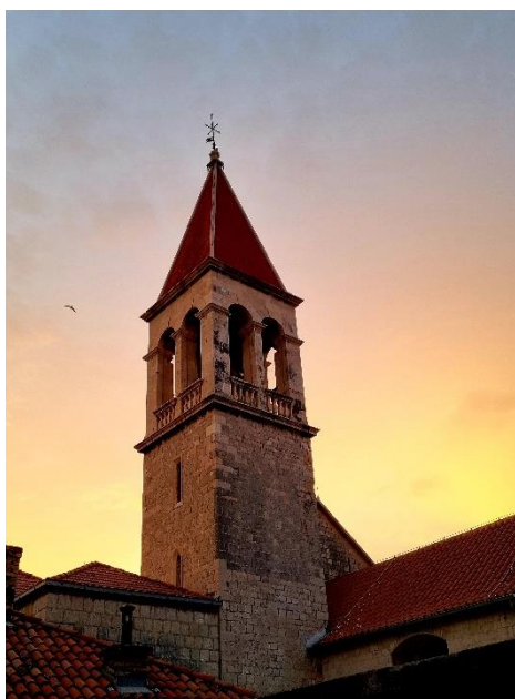
Slika 32. Zvonik crkve Gospe od Pojšana u Splitu