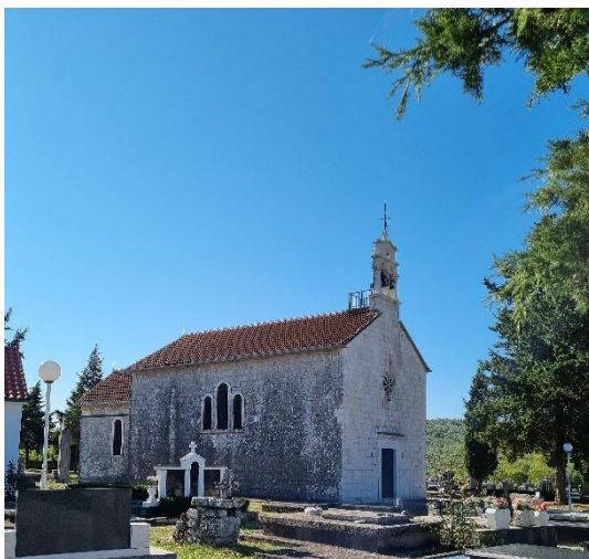
Slika 3. Crkva sv. Marije u Blizni

Zahvaljujući vizitacijama biskupa Manole 1757. godine ostao je sačuvan podatak o tada postojećoj apsidi crkve, dvojnim vratima i podignutim zidovima te dijelom dovršenom pročelju. Spisi biskupa Manole potvrđuju zaokupljenost članova obitelji Macanović dovršetkom radova na crkvi koja je dogotovljena pod potkroviteljstvom seljana iz Blizne i crkvenih dobročinitelja. U spisima Državnog arhiva u Zadru stoji da je Ivan II Macanović nadgledao graditeljske pothvate koje je nakon očeve smrti preuzeo Ignacije II Macanović. Povezuje se Macanoviće i s odugovlačenjem radova na samoj crkvi, ali i ranijim pripremama Ivana Macanovića za samu gradnju već 1740. godine. Brojni dokumenti iz Državnog arhiva u Zadru potvrđuju postojanje niza prepreka u gradnji, no crkva u Blizni svojim konačnim izgledom postaje jednobrodnom građevinom s apsidom i zvonikom na preslicu s dva zvona. U isto vrijeme Ivan Macanović podiže crkvu u Nerežišću na otoku Braču koja se naposljetku iskazala kao značajniji projekt za samog graditelja, kako to u zaključku ističu Lovorka Čoralić i Ivana Prijatelj Pavičić. Crkva u Blizni ponešto je s godinama modernizirana, a danas su barokni elementi vidljivi tek u fragmentima. 36