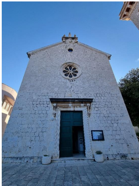
Slika 4. Crkva Bezgrešnog začeća Blažene Djevice Marije u Kaštel Štafiliću

uglavnom bavio klesanjem vrata i temeljnih kamenja na crkvi. Godine 1758. pripremio je kamen za rozetu za pročelje crkve. Klesanje je iduće godine preuzeo Ignacije koji je napravio veliku rozetu zajedno s manjom koje su postavljene na pročelje crkve. 42 Cvito Fisković piše o tome: „Njemu su tada isplatili i zaostale klesarske radove; za dva polukružna profilirana prozora, za dvije stope, dva pilastra sa dvije glavice i za ključni kamen triumfalnog luka“. 43 Osim navedenih klesarskih postignuća, važno je naglasiti i specifičan zaključak portala koji preferiraju koristiti članovi obitelji Macanović. Tako se na portalu štafiličke crkve vidi ravni vijenac koji paralelu vuče s malim hramom i mauzolejem Dioklecijanove palače, kako to opisuje Vladimir Marković. 44