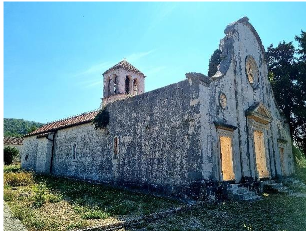
Slika 14. Pogled na bočne zidove

Nažalost, u potpunosti nova crkva, nije sagrađena pod Macanovićevim vodstvom. Ponestalo je novca i projekt je na određeno vrijeme prekinut. S vremenom su mještani sakupili ponešto novca kako bi se rad na crkvi nastavio. Nakon dvije godine rada na župnoj crkvi u Velom Drveniku, ponovno dolazi do prekida i od tada stoji samo nedovršeno pročelje nove župne crkve iz razdoblja kasnog baroka. 74