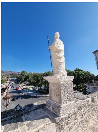
Slika 18. Kopija originala srednjovjekovnog kipa sv. Ivana Trogirskog na Kopnenim gradskim vratima, pogled s južne strane