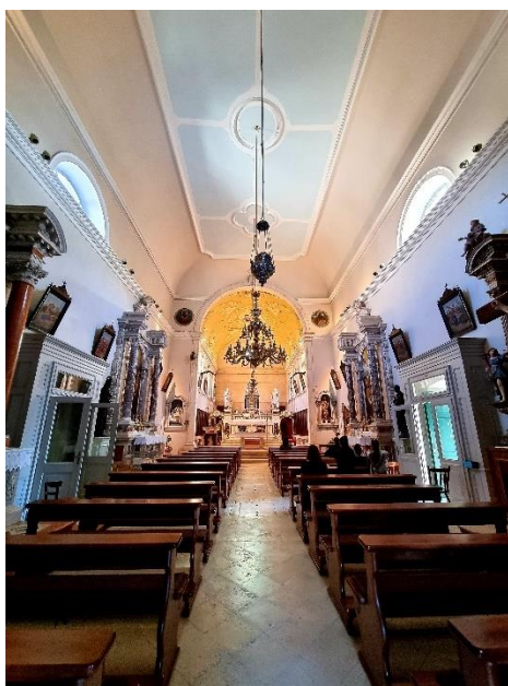
Slika 6. Prikaz čitave unutrašnjosti štafilićke crkve

Sumiranjem izgleda današnje crkve i nabrojanih izvedenih projekta da se zaključiti kako je crkva u Štafiliću jednobrodna s užom apsidom. 53 Svojim izgledom, raščlambom zidova i prostornom organizacijom crkva Bezgrešnog začeca Blažene Djevice Marije u Kaštel Štafiliću podsjeća na kapelu bl. Ivana Trogirskog u trogirskoj katedrali. Podijeljene zidne plohe, polukružni prozori i profilirani dijelovi samo su neki od segmenata koji se ponavljaju u obje crkve. 54 Svojim velikim zidnim ploham a štafilićka crkva odaje profil graditelja koji je svoju karijeru započeo radom na utverdama prema kojima kasnije temelji oblik građevina. Jednostavno pročelje krasi vrata s profiliranim karakteristikama gradnje 17. i 18. stoljeća. Dovratnici su pri vrhu prošireni, a na dnu ukrašeni reljefnim cvjetovima. Na obje gornje strane umetnute su konzole s volutama sa širokim listom u maniri baroka. Takve elemente prepoznajemo u Dalmaciji 16. stoljeća, a preslikavaju se u doba baroka. Na pročelju se nalazi rozeta krhkih stupića, a iznad nje ponešto manja rozeta koja osvjetljava potkrovlje. 55 Takav motiv rozeta Cvito Fisković naziva „zvijezde“, ili „rosulani“. 56 Manja vrata na pobočnim zidovima također završavaju s profiliranom rozetom. Apsida je postavljena na istok, a osvjetljuju je tri prozora polukružnog luka s obje strane koji daju bolji dojam same apside. 57