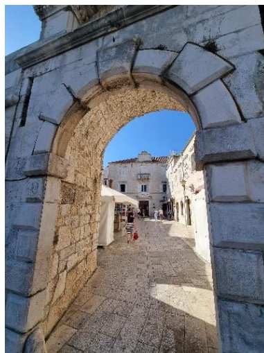
Slika 16. Prolaskom kroz Kopnena gradska vrata, ulazi se na trg pred palaču Garagnin Fanfogna

Macanovićeva težnja spolijama vidljiva je i na primjeru Kopnenih vrata. Naime, na obnovljena vrata Ignacije vraća grb providura Bernarda, mletačkog lava, natpis, ali i srednjovjekovni kip sv. Ivana Trogirskog. 80 Macanović koristi naizmjenice veće i manje blokove ispupčenih kamena za zidanje vrata. S obje strane vrata nalaze se uski otvori za lance koji su podizali pokretni most postavljen kako bi se pristupilo kopnu ili otoku. Zidni plašt uokviruju dva bastiona s obje strane. 81 Iznad vrata nalazio se reljef s likom mletačkog lava kao i u svakom dalmatinskom gradu pod vlašću Mlečana. Okvir reljefa ukrašen je „motivom tzv. visećih zubaca“. 82 Mletački lav ima poznata stilska barokna obilježja. Bio je izveden u reljefu, gotovo pa u punoj plastici. Kao i svi drugi simboli mletačke vlasti, ovaj je lav skinut i oštećen u poznatom pokretu uništavanja mletačkih oznaka 1932. godine. 83