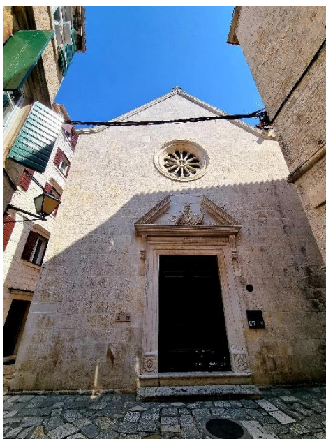
Slika 7. Crkva sv. Petra u Trogiru