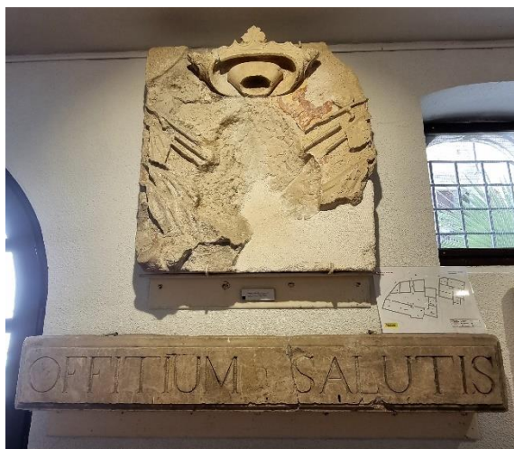
Slika 23. Sačuvani fragmenti sa Zdravstvenog ureda u Trogiru, rad Ignacija Macanovića iz 18. stoljeća, Muzej grada Trogira

reljefni otučeni grb među trofejima. Reljef lava napravljen je po nešto starijem predlošku, tvrdi Cvito Fisković, koji ga opisuje kao lava s olovnim očima netipičnima za barok. Danas se njegovi fragmenti čuvaju u Muzeju grada Trogira. 102