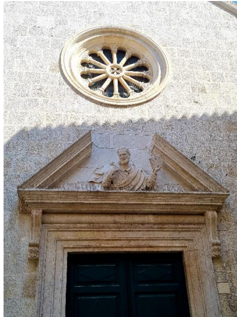
Slika 8. Detalj pročelja crkve sv. Petra u Trogiru

Trogiru. Profesor Babić piše da su savijene konzole uz gornji dio portala mogle biti preuzete iz Vitruvijevog traktata izdanog 1567. godine za kojeg je poznato da su ga posjedovali sin Ignacije i otac Ivan. Poznavali su tadašnju stručnu arhitektonsku literaturu i arhitektonske traktate te ih koristili u praksi. Time su potvrdili svoju učenost i arhitektonsku pismenost. 60