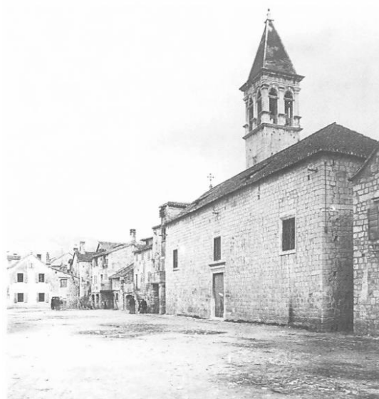
Slika 1. Fotografija crkve i zvonika sv. Mihovila u Trogiru prije rušenja