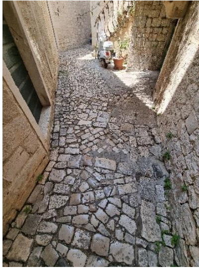
Slika 25. Izvorno popločenje između palače Paitoni i benediktinskog samostana sv. Nikole u Trogiru