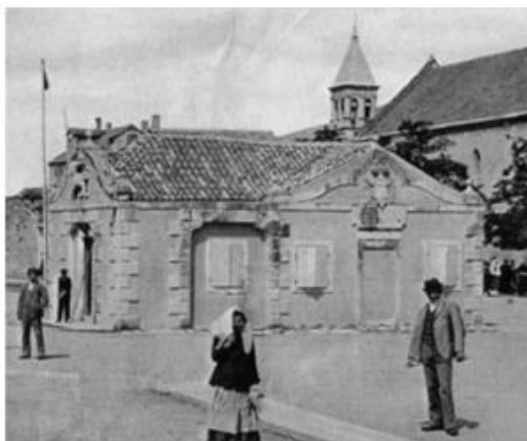
Slika 22. Zgrada Zdravstvenog ureda u Trogiru na razglednici s početka 20. stoljeća

Zgrada lučkog Zdravstvenog ureda u Trogiru nekoć je stajala usred trogirske rive. Porušena je kada više nije bila u uporabi. U sačuvanim opisima zapisano je kako se ulazni dio prizemnice sastojao od trijema širokih otvora. 98 Cvito Fisković opisuje: „Na pročelju je bio zabat sa valutama i kamenim kuglama, sred kojega se isticao visoki reljef mletačkog lava.“ 99 Na istočnoj bočnoj strani zida nalazi se zabat sa specifičnim elementima baroka, volutama, kuglama i grbom kako opisuje ravnateljica Muzeja grada Trogira Fani Celio Cega. 100 Barokizirana građevina sadržavala je elemente gotike koji su se mogli pronaći u segmentima kao i kod štafiličke crkve. 101