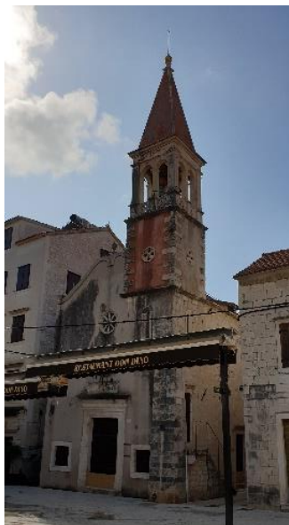
Slika 10. Crkva Gospe od Karmela u Trogiru

Ivo Babić vidi stilske sličnosti gornjeg dijela pročelja crkve Gospe od Karmela s pročeljem (krivuljama i volutama) na Zdravstvenom uredu u Trogiru. Ponavlja se i motiv kugle zabijene na vrh pročelja na crkvi Gospe od Karmela i nad zabatom Zdravstvenog ureda u Trogiru. Oba rada pripisuju se Ignaciju Macanoviću. Slični završeci pročelja s krivuljama uočeni su i na nedovršenoj crkvi sv. Jurja na Drveniku. Ivo Babić iznosi pretpostavku da je Ignacije Macanović, zajedno sa svojim suradnicima, preoblikovao i zvonik i crkvu Gospe od Karmela u baroknom stilu. Babić drži da je Macanović zaslužan za ugrađivanje spolija, odnosno reljefa sa srednjovjekovnog sarkofaga na crkvi. 70