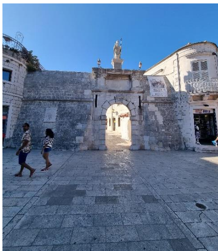
Slika 15. Kopnena gradska vrata u Trogiru

Današnji položaj sjevernih gradskih vrata Trogira ne podudara se s nekadašnjem položajem antičkog sustava carda i decumanusa . 75 Nova sjeverna kopnena vrata postavljena su u vrijeme Kandijskog rata za vrijeme vladavine mletačkog providura Antonija Bernarda (1656.-1660.) što potvrđuje i njegov grb na pročelju. No, današnji oblik duguju Ignaciju Macanoviću koji na tom projektu radi 1763. godine. 76 Iz ranije faze vrata ostao je sačuvan jedan od najraskošnijih baroknih grbova u Dalmaciji. Grb providura Antonija Bernarda krasi dvije figurice tritona koji u rukama nose rogove pune obilja, a na vrhu grba nalazi se simbol providurske časti, krnji stožac. Na vratima su se nalazili i natpisi koji su svjedočili vlast ovog providura u vrijeme Kandijskog rata. 77 Kopnena gradska vrata nekada su izgledala jednako kao i Carska vrata u Zadru. Dotrajalost i oštećenja bili su dovoljan razlog da se pokrene obnova. Ignacije Macanović zaprimio je narudžbu i krenuo s obnovom 1763. godine. 78