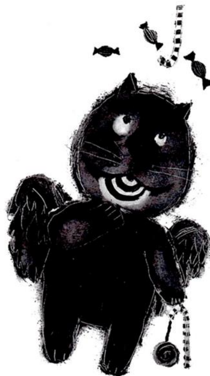
Prilog 3. Detalji slikovnice „Miševi i mačke naglavačke“ autora Luke Paljetka (preuzeto iz: Zalar, D., Kovač-Prugovečki, S., Zalar, Z. (2009). Slikovnica i dijete. Kritička i metodička bilježnica 2. Zagreb: Golden marketing-Tehnička knjiga, str. 30-31.)