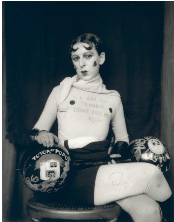
Slika 12. Claude Cahun, I am in training don't kiss me , oko 1927.