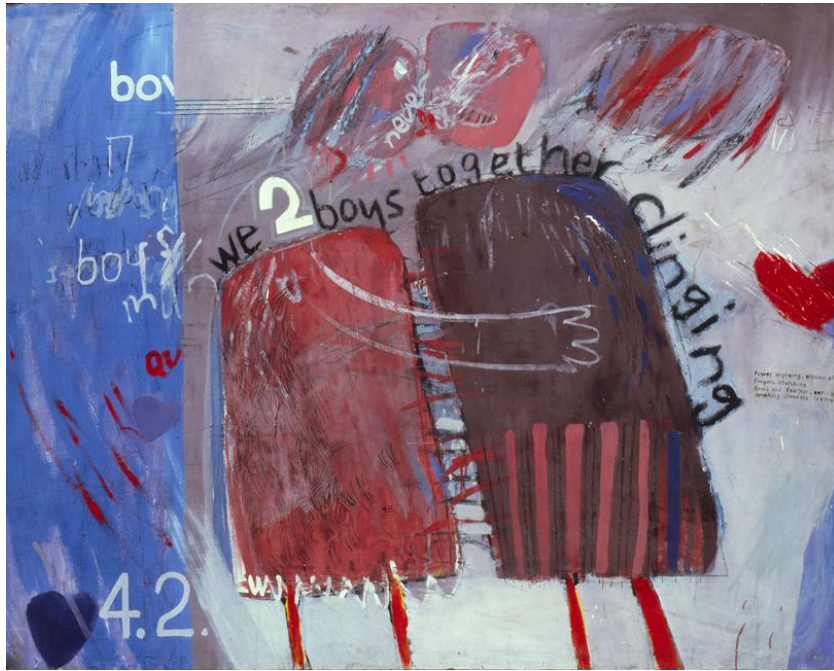
Slika 13. David Hockney, We Two Boys Together Clinging , 1961.

Hockney je također pokušao u svoje slike ugraditi aluzije na vlastitu homoseksualnost, nadahnut tekstovima Christophera Isherwoda i Alana Rechyja, koji su se naslađivali podvizima njihovih homoseksualnih likova. U to je vrijeme, kako je već spomenuto, homoseksualnost u Engleskoj bila ilegalna, pa je Hockney slikao autoportrete. Bio je gay i slikao se, učinkovito stvarajući gay umjetnost, ali leteći ispod radara. Bio je to genijalan potez i urlajući srednji prst njegovom protivljenju. No Hockney je također započeo svoje Ljubavne slike , koje su slavile homoseksualnu ljubav ugrađujući falične elemente u tandemu s fantastičnim bojama i slikama. Ovo je bio njegov pokušaj da spoji pojedinca, stvarnost i imaginarno kako bi pružio homoseksualni prostor užitka i aktualizirane želje. Naravno, znao je kada treba biti suptilan, a kada očit. 40