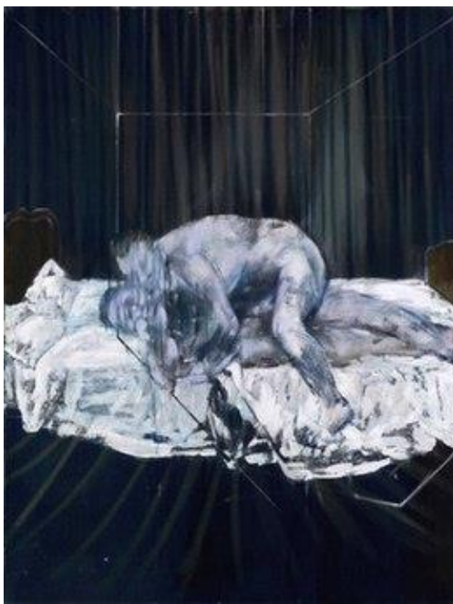
Slika 15. Francis Bacon, Two Figures , 1953.