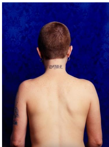
Slika 7. Catherine Opie, Dyke , 1993.