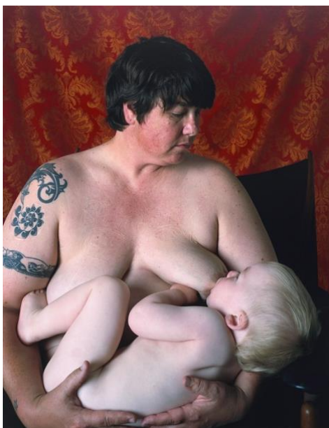
Slika 9. Catherine Opie, Dojenje , 2004.