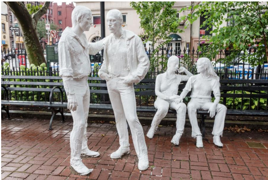
Slika 17. George Segal, Gay Liberation Monument , 1979.

instalirani u svoj stalni dom u ulici Christopher do 1992. godine. Iako su u svoje vrijeme bili upečatljivi, kipovi danas izgledaju kao sigurnija, mekša verzija iskre oslobođenja koju je potpalio sam Stonewall. Kao umjetnost, oni se i dalje mogu održati, ali kao javno sjećanje ne uspijevaju izraziti modernu viziju queer oslobođenja. 47 Jasno je kada povežemo priču o Stonewallu i pogledamo u Segalove skulpture da postoji određena razlika u osjećaju koji poboduju. Stonwall pobuna nije bila mirna i laka, dok su skulpture mirne i skladne. Skulpture su dakako za vrijeme kad su izrađene bile suvremene i napredne, no danas, kada možemo shvatiti razmjer Stonewalla, nedovoljne su i nemaju taj žar koji je Stonewall imao.