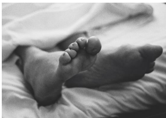
Slika 18., 19., 20. David Wojnarowicz, Bez naziva , 1987.

THAT I'D CONTRACTED THIS VIRUS IT DIDN'T TAKE ME LONG TO REALIZE THAT I'D CONTRACTED A DISEASED SOCIETY AS WELL." (prijevod autorice)