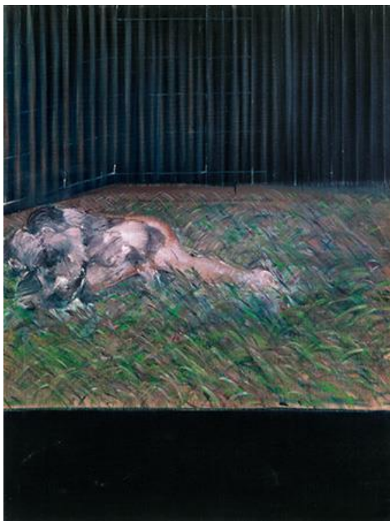
Slika 16. Francis Bacon, Two Figures in the Grass , 1954.