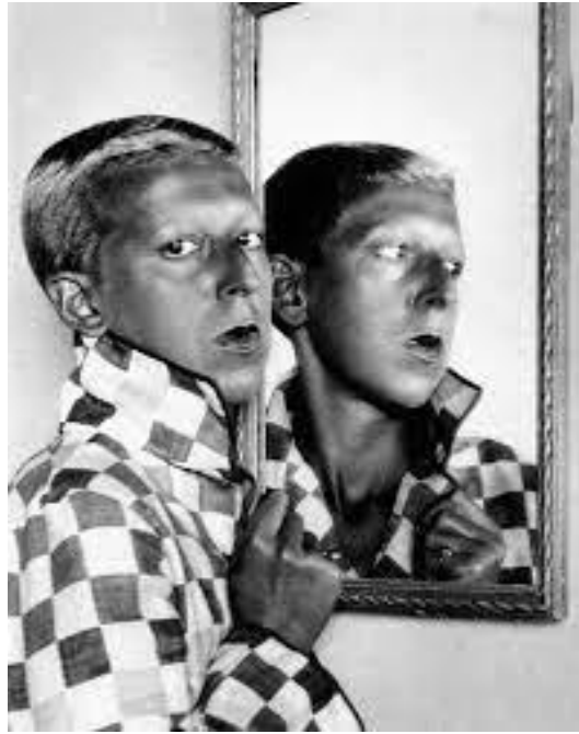
Slika 10. Claude Cahun, Autoportret , oko 1929.

ono što je mnogima nespojivo i neprirodno. Nježno cvijeće kontrastira izraženim crtama blijedog lica i tamnom ružu na ustima. Na ovome autoportretu Cahun izražava upravo tu neutralnost koja mu odgovara te spaja (kulturom i tradicijom nametnute) značajke oba roda.