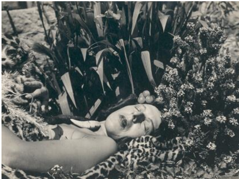
Slika 11. Claude Cahun, Autoportret , oko 1939.