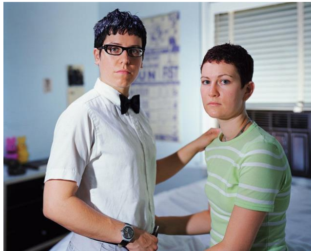
Slika 6. Catherine Opie, Melissa and Lake , 1998.

Franciscu. Poput tih slika, njezini autoportreti bave se suvremenim problemima queer identiteta, dok njihov sadržaj usklađuju u formalnoj tradiciji prisjećajući se slika Hansa Holbeina iz šesnaestog stoljeća. Na ovim slikama Opie nudi nešto duboko osobno, čak i ispovjedno, otkrivajući snažne čežnje koje su pojačane velikom fizičkom ranjivošću sadomazohističkih činova koje fotografije dokumentiraju. Deset godina kasnije, na fotografiji Autoportret/dojenje , Opie se vratila žanru, ponovno obogaćujući svoju sliku osjećajem zanesenog zadovoljstva, dok svog malenog sina drži u klasično majčinskoj pozi koja dodatno evocira umjetničko-povijesnu sliku. Slabo, ali jasno vidljiva na njezinim grudima, riječ „perverznojak“ i dalje se pojavljuje kao ožiljak, trag njezine povijesti koji se nastavlja kroz vrijeme. 33