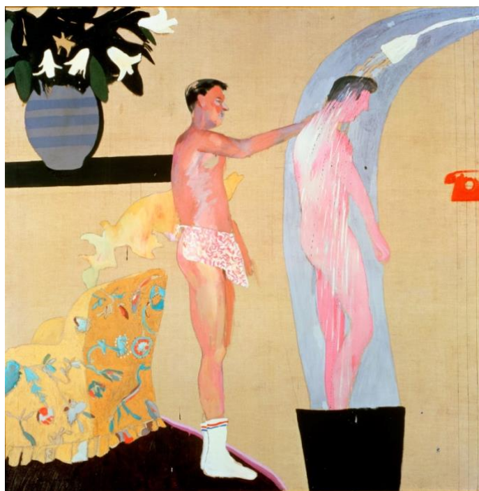
Slika 14. David Hockney, Domestic Scene , 1963.

U jednom intervjuu, Hockney je rekao: „Oni žele biti obični - žele se uklopiti. Pa, nije me briga za to. Nije me briga za uklapanje. Sve je tako konzervativno.“ 41 Hockney je želio istaknuti koliko se homoseksualni način života razlikuje od heteroseksualnog. To je povezano s ekstravagancijom, tretiranjem svijeta kao igrališta za odvažne ljude i, što je najvažnije, vođenjem beskompromisnog života. 42