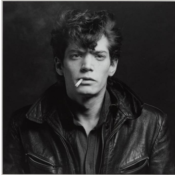
Slika 4. Robert Mapplethorpe, Autoportret , 1980.

One iz 1953. Kao u većini svojih porteta, Mapplethorpe pozira gledajući ravno u kameru dok su mu usta centar fotografije. 27