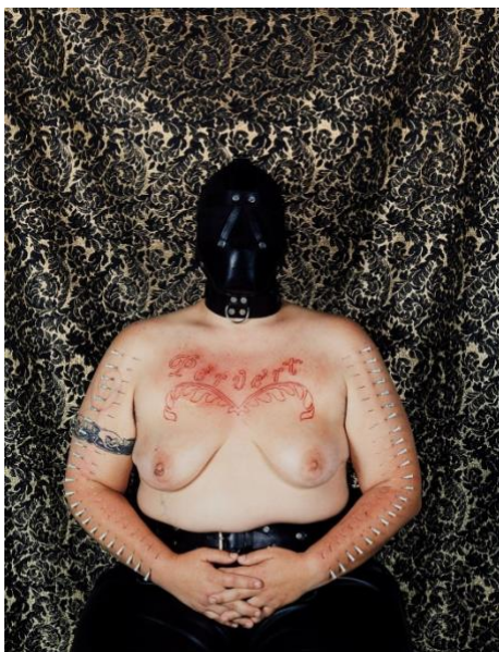
Slika 8. Catherine Opie, Perverznejak , 1994.