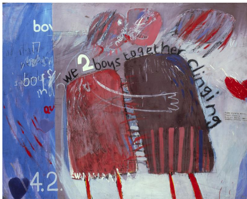
Slika 13. David Hockney, We Two Boys Together Clinging , 1961.

Hockney je također pokušao u svoje slike ugraditi aluzije na vlastitu homoseksualnost, nadahnut tekstovima Christophera Isherwoda i Alana Rechyja, koji su se naslađivali podvizima njihovih homoseksualnih likova. U to je vrijeme, kako je već spomenuto, homoseksualnost u Engleskoj bila ilegalna, pa je Hockney slikao autoportrete. Bio je gay i slikao se, učinkovito stvarajući gay umjetnost, ali leteći ispod radara. Bio je to genijalan potez i urlajući srednji prst njegovom protivljenju. No Hockney je također započeo svoje Ljubavne slike , koje su slavile homoseksualnu ljubav ugrađujući falične elemente u tandemu s fantastičnim bojama i slikama. Ovo je bio njegov pokušaj da spoji pojedinca, stvarnost i imaginarno kako bi pružio homoseksualni prostor užitka i aktualizirane želje. Naravno, znao je kada treba biti suptilan, a kada očit. 40