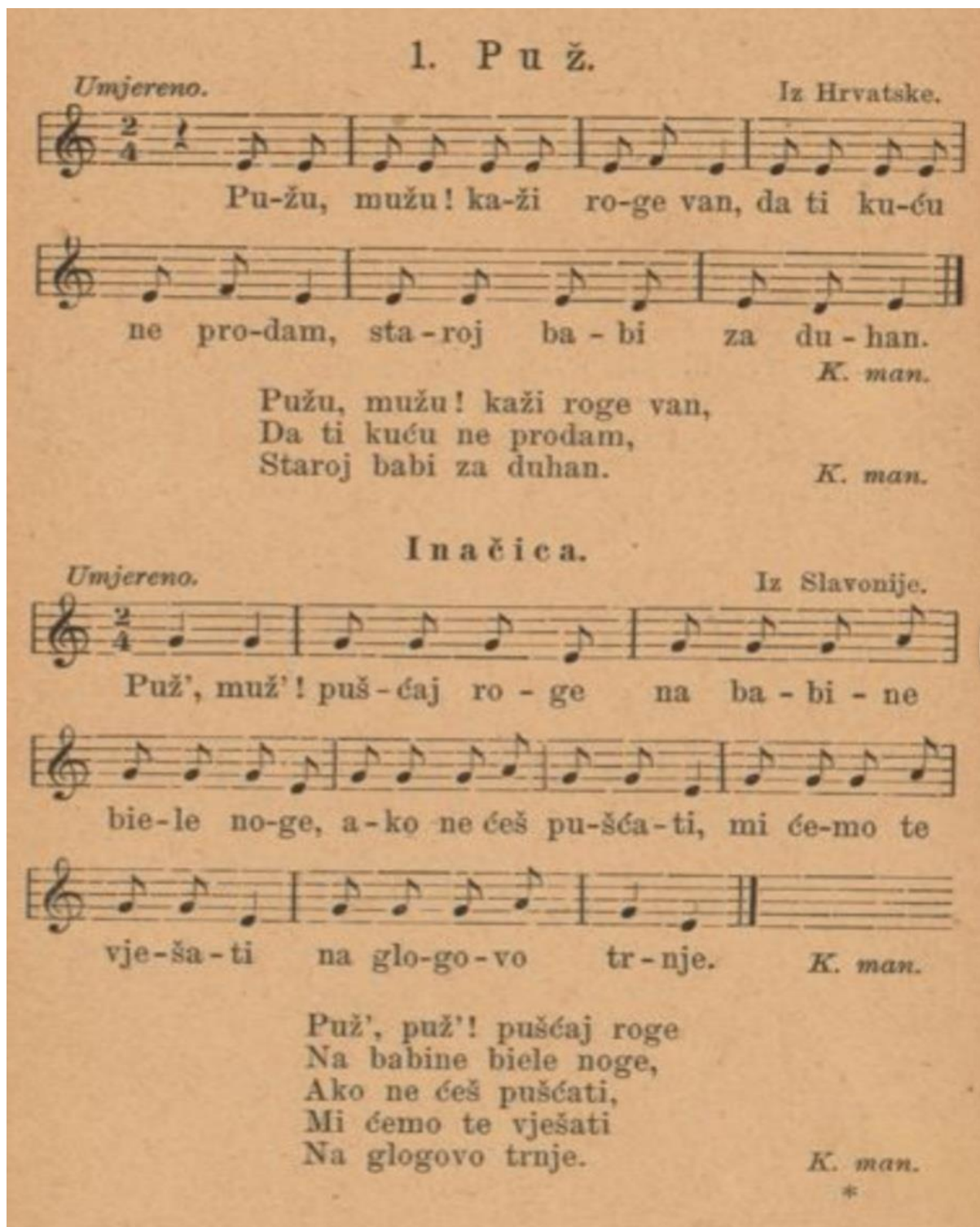
Slika 3. Notni zapis pjesme Puž (Kuhač, 1885:3)

Slika 1. prikazuje notni zapis spomenute malešnice. Obje pjesme su skladane u C-duru te opseg njihovih tonova odgovara rasponu tonova djece ranog i predškolskog uzrasta. Budući su napisane u dvočetvrtinskoj mjeri te jednostavnim ritmom, ove pjesme bi i za odgojitelja trebale biti lake za izvođenje. Na ovom primjeru vidljivo je korištenje dva narječja kod iste pjesmice. Tako i sam autor kaže: Ako bi tko volio da djeca tu pjesmu pjevaju po štokavski, neka