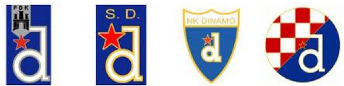
Fotografija 17. Dinamovi grbovi kroz povijest