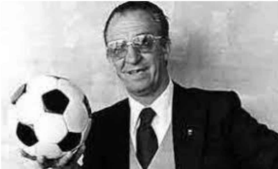
Fotografija 29. Mladen Delić, legendarni sportski komentator