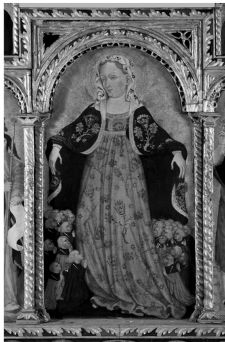
Slika 13 , Nikola Vladanov, srednji dio poliptiha, Šibenik, Interpretativni centar

Sličan se fenomen ponavlja na središnjem polju poliptiha Nikole Vladanova iz crkve sv. Grgura u Šibeniku. Naime, ovdje Marijin široki plašt kojim štiti vjernike razotkriva biljni, odnosno cvjetni ornament kojega upotpunjuje i dekoracija na haljini i pokrivalu na glavi. Evidentno je da motivacija biljnim motivima nadilazi potrebu za realističnom depikcijom istih. Na cvijeće je time moguće naići i van konteksta vrtova i ružičnjaka.