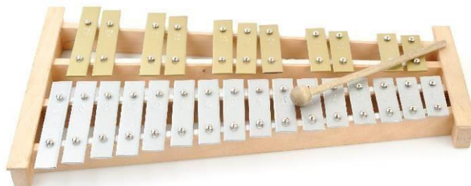
Slika 2. Zvončići