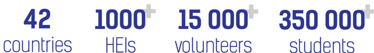
Slika 4. Statistički podaci o veličini Mreže – izvor: https://wiki.esn.org/display/EI/ESN+Basics+Home (preuzeto 1. prosinca 2021.)

Danas Mreža surađuje s više od 1 000 visokoškolskih ustanova iz 42 zemlje, a kontinuirano se razvija i širi. Ima oko 15 000 aktivnih članova koji se u svojim sekcijama (lokalnim organizacijama) brinu o dolaznim, internacionalnim studentima. Tako ESN uključuje oko 50 000 mladih ljudi koji svake godine nude svoje usluge 350 000 internacionalnim studentima, kao što je prikazano na Slici 4.