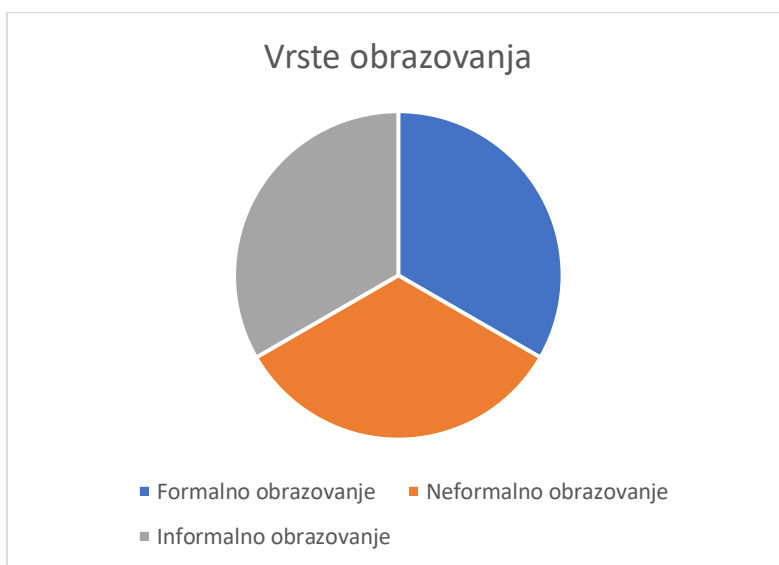
Slika 1. Temeljne vrste obrazovanja u suvremenom društvu

Razlikovanje formalnog, neformalnog i informalnog obrazovanja prvi put susrećemo 50-ih godina prošloga stoljeća (Previšić, 2007: 69). Od tada do danas jasnije su se iskristalizirale njegove granice (Jurić, 2007: 70).