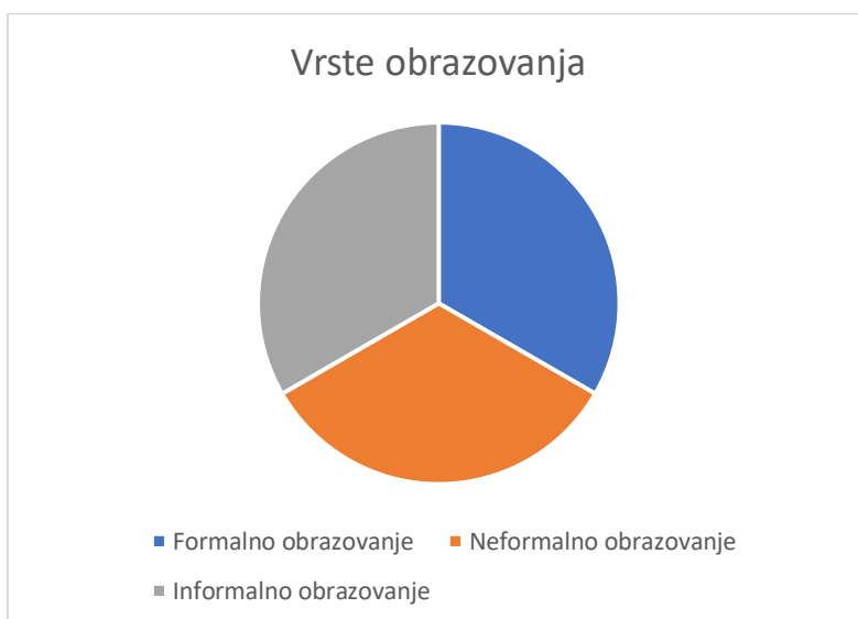
Slika 1. Temeljne vrste obrazovanja u suvremenom društvu

Razlikovanje formalnog, neformalnog i informalnog obrazovanja prvi put susrećemo 50-ih godina prošloga stoljeća (Previšić, 2007: 69). Od tada do danas jasnije su se iskristalizirale njegove granice (Jurić, 2007: 70).