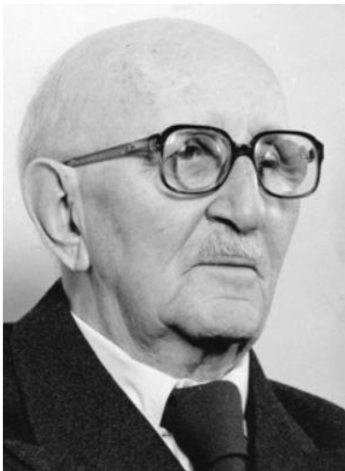
Slika 8. Vaso Čubrilović, autor koji je oborio Jukićevu hipotezu o krupnim muslimanskim zemljoposjednicima kao nasljednicima srednjovjekovnog bosanskog plemstva

Za razliku od hipoteze o muslimanskim krupnim zemljoposjednicima kao nasljednicima srednjovjekovnog bosanskog plemstva, hipoteza o duhovnom kontinuitetu bosanskih muslimana sa srednjovjekovnim krstjanima izvorno plasirana od Račkog se s vremenom raslojila. Temeljne razlike pri zastupanju u osnovi iste hipoteze nastale su pri tematici prirode motivacije za vjersku konverziju, ali i pri tematici prisustva isključivo komponente krstjana, odnosno prisustva višestrukih komponenti unutar suvremenog muslimanskog življa na prostorima Bosne i Hercegovine. Koncizan pregled čimbenika koji su oborili hipotezu o duhovnom kontinuitetu bosanskih muslimana sa srednjovjekovnim krstjanima u samoj njenoj osnovi pružio je Srećko Džaja u svojoj knjizi „Konfesionalnost i nacionalnost Bosne i Hercegovine: Predemancipacijsko razdoblje 1463. – 1804.“ Preciznu definiciju karaktera vjerskih identiteta u srednjovjekovnoj bosanskoj državi pružili su američki povjesničari Robert Donia i John Van Antwerp Fine Jr. u zajedničkoj knjizi „Bosna i Hercegovina: Iznevjerena tradicija“, a na temelju