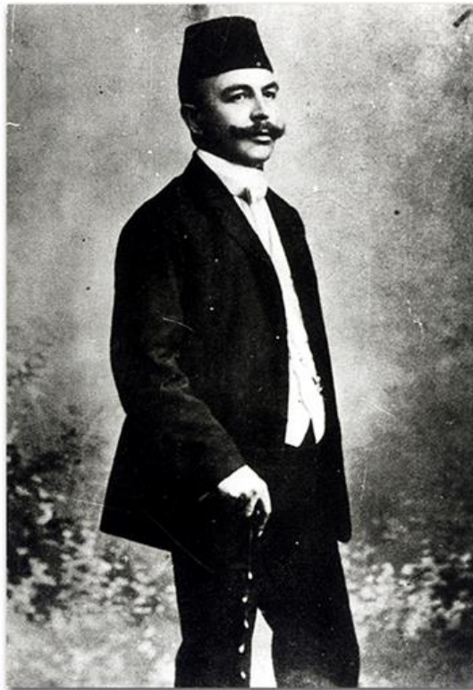
Slika 10. Safvet – beg Bašagić, strastveni i anacionalni barjaktar bošnjačke nacije

Prema Rizviću, Bašagić je prepravku bošnjačkog nacionalnog imena uradio i pri pretisku svoje kratke proze „Zao komšija“ prvotno objavljene u „Bošnjaku“, a nanovo objavljene 1907. godine u sklopu njegove zbirke „Uzgređne bilješke“, no autor ovog rada nažalost nije imao na raspolaganju tu Bašagićevu zbirku. 272