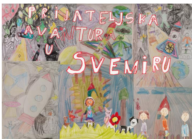
Slika 1. Naslovnica slikovnice "Prijateljska avantura u svemiru" (Zajednički rad djece dječjeg vrtića "Popaj")

Izabran je naslov i naslikana je ilustracija naslovnice: