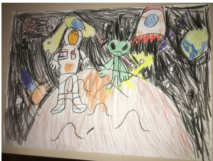
Slika 16. Svađa vanzemaljaca (Leon, 6,5 godina)