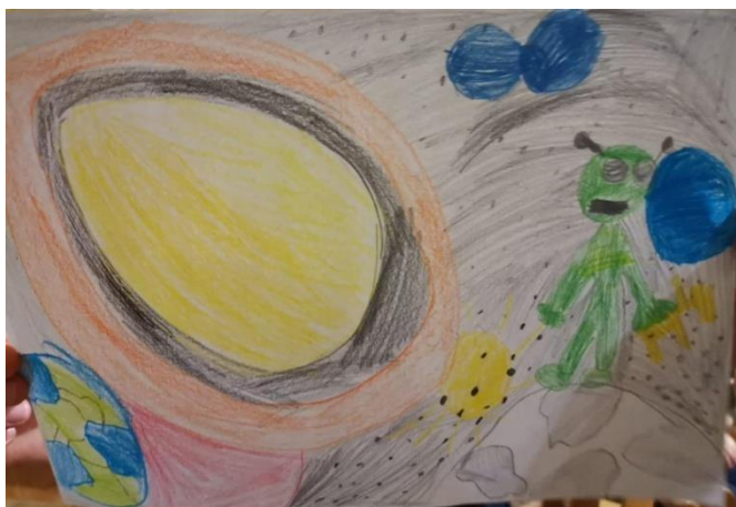
Slika 15. Planet Pluton (Vito, 6,5 godina)