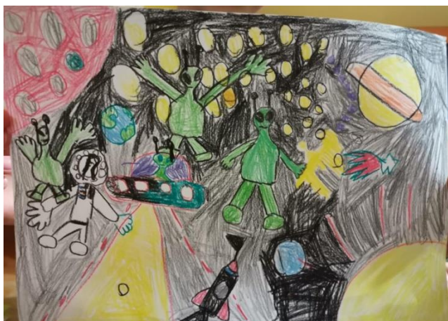
Slika 18. Povratak vanzemaljaca u svemir! (Luka, 6,8 godina)