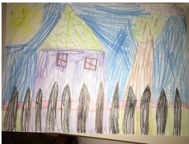
Slika 13. Livada u blizini dječjeg vrtića na kojoj su se djeca igrala (Maris, 7,1 godina)

Na početku, osmišljen je tijek priče, kojeg su daljnjim radom djeca bogatila novim događajima i situacijama, a konačna je priča glasila ovako: Priča započinje dječjom igrom na livadi u blizini dječjeg vrtića. U jednom trenutku, djeca i ostali ljudi koji su boravili tu, vidjeli su vanzemaljce koji se spuštaju na zemlju. Vanzemaljci su djecu pozvali da im se pridruže u raketi na njihov planet Pluton. Putem do Plutona, djeca su upoznala astronaute, svemir i ostale planete koje plove svemirom. Čim su stigli na Pluton i započeli istraživati taj planet, vanzemaljci su se posvađali zbog igre koju će igrati s djecom. Djeca su im pomogla riješiti tu situaciju, pa su se zajedno svi igrali. Nakon putovanja Plutom, svi su se zajedno vratili na Zemlju, a vanzemaljci su odlučili da se više neće svađati. Zajedno su se vratili svojoj planeti!