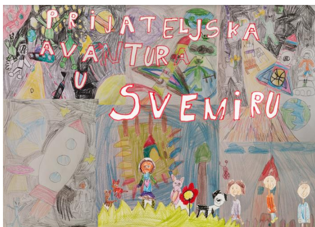
Slika 1. Naslovnica slikovnice "Prijateljska avantura u svemiru" (Zajednički rad djece dječjeg vrtića "Popaj")

Izabran je naslov i naslikana je ilustracija naslovnice: