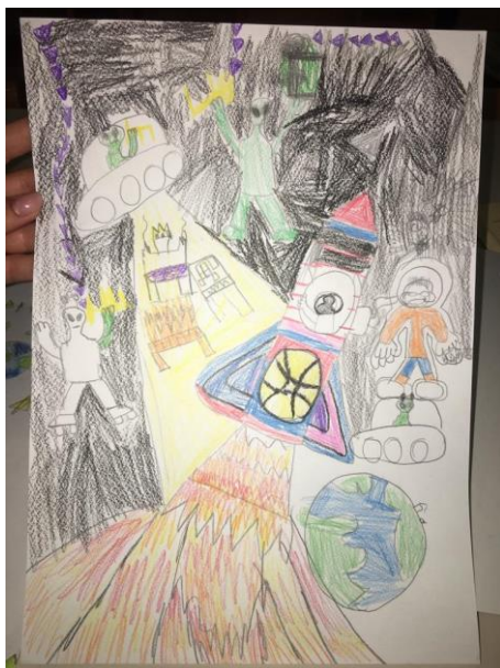
Slika 14. Putovanje djece i vanzemaljaca u svemir (Luka, 6,8 godina)