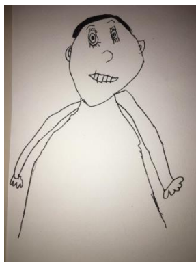
Slika 3. Lik Ivan (6,7 godina)