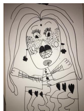
Slika 7. Lik Ema (5 godina)