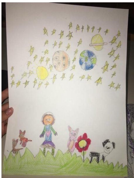
Slika 17. Povratak djece na planet Zemlju (Karla, 5,5 godina)