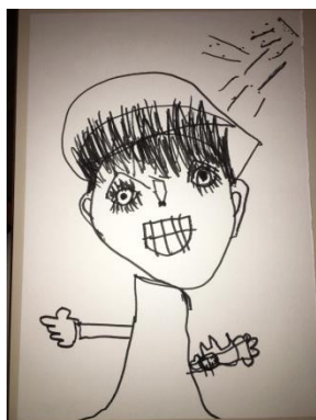
Slika 2. Lik Dino (7 godina)

Zatim su djeca izabrala glavne likove: Dino, Ivan, Nea, Vito, Karla Ema, Luka, Leon, Marino, Lovre i Maris. Svako dijete koje sudjeluje u projektu je izabralo svojega lika. Osim glavnih likova, sporedni su likovi: vanzemaljac i astronaut. Neka od mjesta radnje koja su djeca odabrala jesu dvorište s ogradom, livada, svemir i planet Pluton.