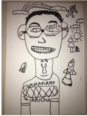
Slika 8. Lik Luka (6,8 godina)