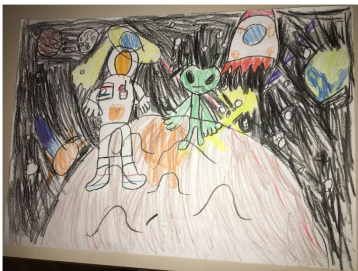
Slika 16. Svađa vanzemaljaca (Leon, 6,5 godina)