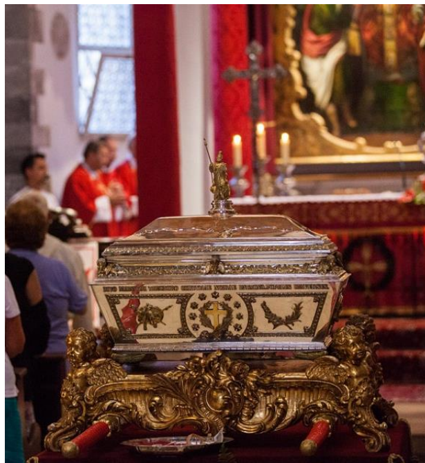
Slika 17. Relikvije sv. Todora

Za Korčulane datum 29. srpnja predstavlja veliki dan – svetkovinu zaštitnika grada, mučenika, sv. Todora i Dan grada Korčule. Dva dana ranije, 27. srpnja, zvona korčulanske katedrale najavljuju proslavu nebeskoga zagovaratelja Korčulana. Dan prije proslave, 28. srpnja nakon večernje mise župnik iznosi kasu s relikvijama sv. Todora. Relikvija se čuva u glavnom oltaru te ju korčulanske bratovštine (Svih svetih, Svetoga Roka, i Gospe od Utjehe) izlažu vjernicima. Na dan svetog Todora, nakon mise je procesija oko grada tijekom koje se nose relikvije zaštitnika („Proslava sv. Todora u Korčuli“, 2018).