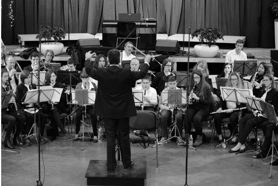
Slika 7. Orkestar

Tempo se postepeno ubrzava ( accelerando ). Brzina varira, glazba postaje sve brža, vivo 7 tempo. Nakon toga dolazi posljednji dio Finale , koji završava u duru.