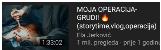
Slika 6: Prikaz naglašenog pokrovitelja na kanalu Ele Jerković