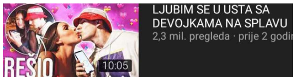
Slika 3: „Opuštajući“ izlazak uoči vikenda na kanalu Bake Praseta

Osim oglašavanja proizvoda influenceri stvaraju ostale sadržaje s ciljem doseganja što veće prepoznatljivosti. Većina sadržaja na razini je prosječnog tabloidskog lista. Međutim na taj način broj nula na pokroviteljskim ugovorima se povećava. Proizvodi ili usluge nisu jedini predmet oglašavanja, promoviraju se ponašanja i vrijednosti. Čemu su djeca izložena?