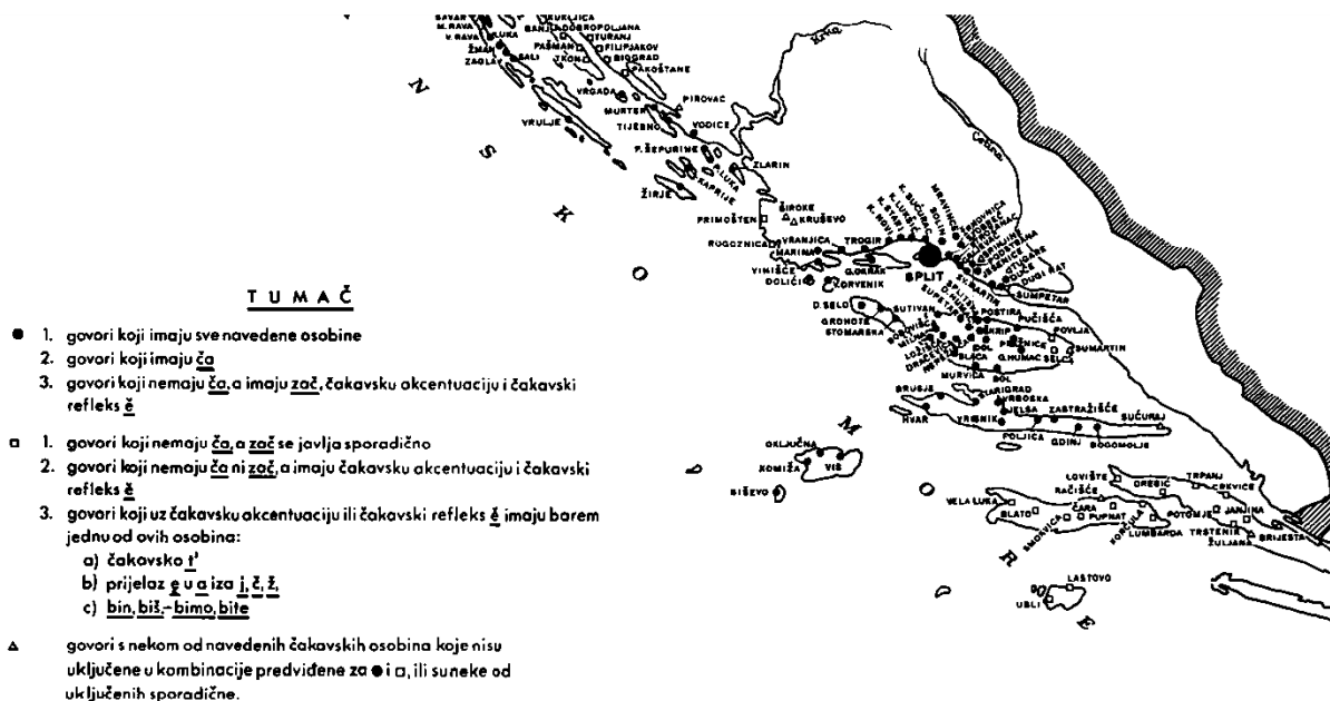
Slika 2. Isječak karte čakavskog narječja (Moguš, 1977: 105).