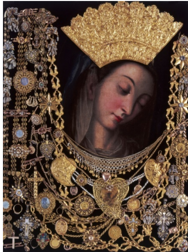
Slika 1: Čudotvorna Gospa Sinjska 26

Kao spomen na junački otpor sinjskih vitezova i slavnu Gospinu pobjedu, svake se godine u mjesecu kolovozu održava viteška igra Alka.