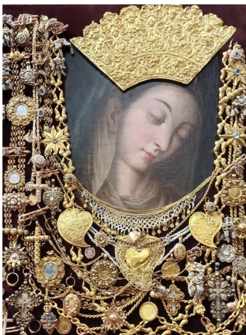
Slika 1: Slika Čudotvorne Gospe Sinjske