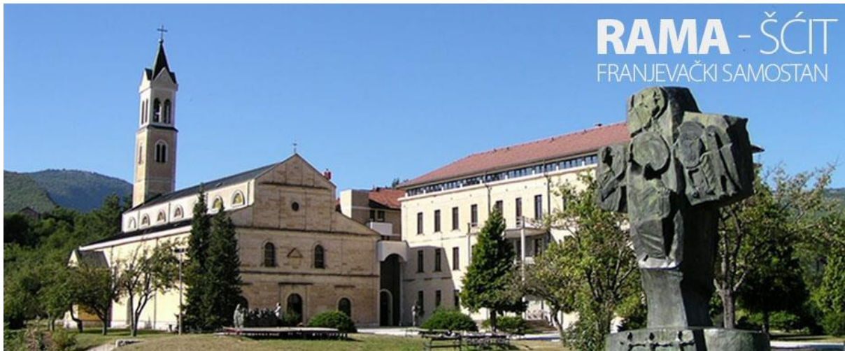
Slika 3: Franjevački samostan Rama-Šćit