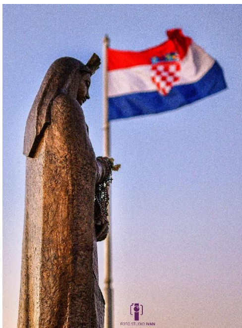
Slika 2: Gospin kip na starom gradu u Sinju