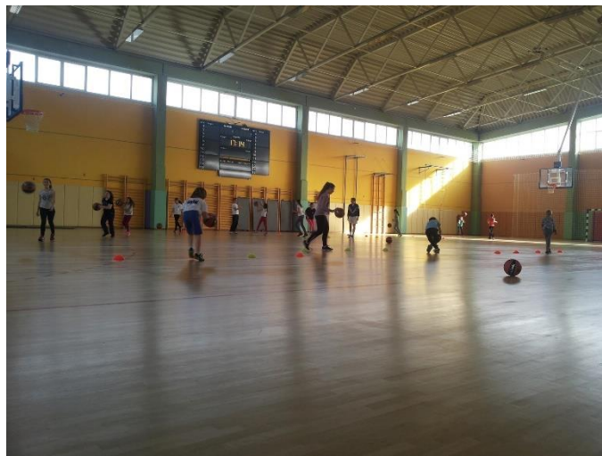
Slika 36. Sportska dvorana Tisno.

Sportska dvorana Tisno ukupne je kvadrature 1500 m 2 , ima 300 sjedećih mjesta na tribinama i teren za održavanje nogometnih, rukometnih, košarkaških i odbojkaških utakmica. Ukupna vrijednost investicije, uključujući i uređenje okoliša iznosi 15,4 mil. kuna. Dvoranom upravlja Ježinac d. o. o. Naknadno je uređeno travnato malonogometno igralište kraj Sportske dvorane Tisno u što je uloženo 200.000 kn.