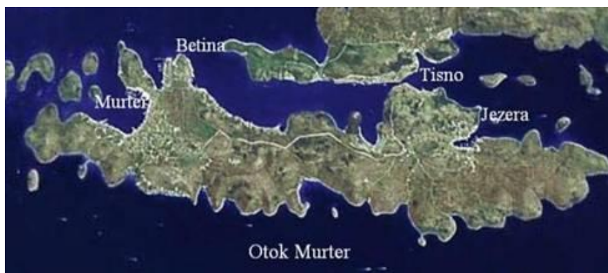
Slika 7. Četiri mjesta na otoku Murteru.

U sljedećim poglavljima bit će popisane i detaljno opisane sve mogućnosti kinezioloških izvanškolskih aktivnosti na otoku Murteru u kojima učenici osnovne škole mogu sudjelovati. Izvanškolske kineziološke aktivnosti raspoređene su prema mjestu održavanja budući da su na otoku Murteru (18,5 km 2 ) četiri mjesta - Betina, Murter, Jezera i Tisno. Otok Murter je udaljen od kopna otprilike petnaest metara, a isto toliko je dug i most u Tisnom. Izvanškolskim aktivnostima učenici se bave u svoje slobodno vrijeme te se za njih opredjeljuju prema vlastitim interesima i željama. Cilj izvanškolskih aktivnosti je kvalitetno i organizirano provođenje slobodnog vremena, socijalizacija, poticanje i razvijanje raznih sposobnosti, podržavanje zdravog životnog stila i međusobnog ophođenja djece (OŠ Murterski Škoji Murter, 2021).