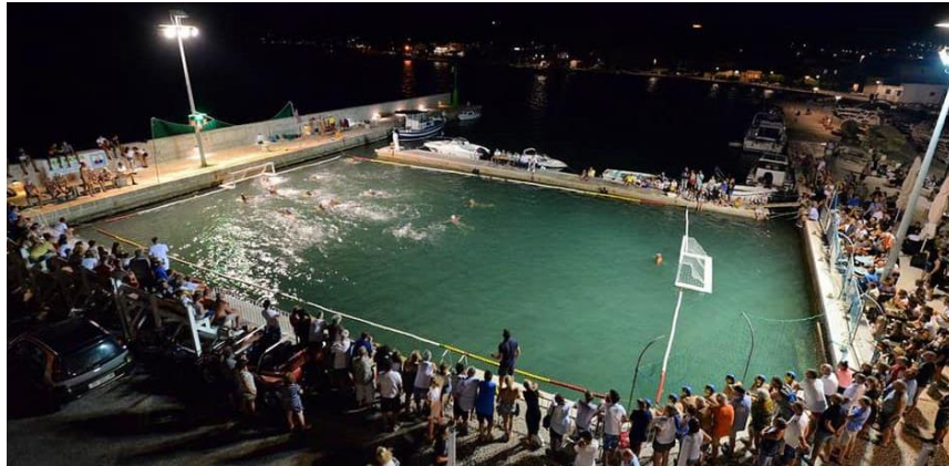
Slika 10. Vaterspolsko igralište Vaterspolskoga kluba Brodograditelj Betina .

Na treninzima vaterpola djeca vježbaju tehnike vladanja loptom na vodi, plivaju, uče pravila igre i sl. Klub se financira od donacija Općine Tisno, samostalno od sponzora te od članarina koje iznose 200 kn za srpanj i kolovoz za plivačku školu dok polaznici vaterpolo škole ne plaćaju članarinu. Da se vodi sustavna briga i o najmlađem uzrastu dokazuju diplome škole plivanja i vaterpola koje se dodjeljuju polazniku/ici za pohađanje i uspješno savladavanje programa škole i stjecanja znanja o temeljnim elementima plivačkog i vaterspolskog sporta (Jadrešić, n.d.).