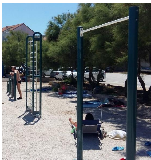
Slika 35. Sprave za vježbanje na plaži Luke.