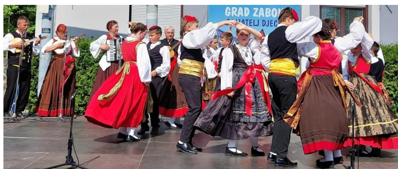
Slika 20. Mlađa grupa Kulturno-umjetničkoga društva Koledišće . (Facebook stranica KUD Koledišće Jezera , n. d.)

Koledišće je jedno od bitnijih kulturnih društava Šibensko-kninske županije i Hrvatske u cjelini, a očuvanje posebnih običaja i rukotvorina pod nazivom O Jezera misto ukraj mora predloženo je za Registar nematerijalne kulturne baštine pri Ministarstvu Kulture Republike Hrvatske. 1996. g. etno film HTV-a u kojem su glavni akteri članovi Koledišća u prikazu Jezerskog mornarskog bala naziva O Jezera misto ukraj mora dobio je posebno priznanje Udruženja folklornih skupina Francuske na Međunarodnom festivalu folklornih filmova u Francuskoj. 2014. g. sa svojim voditeljem i osnivačem Koledišće je otvorilo zavičajnu zbirku u crkvi sv. Ivana Trogirskog (17. st.), koja je uvrštena u Registar kulturnih dobara RH. Godine 2015. Jezerski mornarski bal , starinski ples Balarin i jezerske ogrice 14 također su uvršteni u Registar kulturnih dobara Republike Hrvatske.