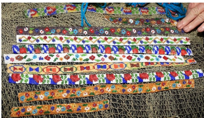
Slika 21. Jezerske ogrice. (Pavić, 2016)

Koledišće je jedno od bitnijih kulturnih društava Šibensko-kninske županije i Hrvatske u cjelini, a očuvanje posebnih običaja i rukotvorina pod nazivom O Jezera misto ukraj mora predloženo je za Registar nematerijalne kulturne baštine pri Ministarstvu Kulture Republike Hrvatske. 1996. g. etno film HTV-a u kojem su glavni akteri članovi Koledišća u prikazu Jezerskog mornarskog bala naziva O Jezera misto ukraj mora dobio je posebno priznanje Udruženja folklornih skupina Francuske na Međunarodnom festivalu folklornih filmova u Francuskoj. 2014. g. sa svojim voditeljem i osnivačem Koledišće je otvorilo zavičajnu zbirku u crkvi sv. Ivana Trogirskog (17. st.), koja je uvrštena u Registar kulturnih dobara RH. Godine 2015. Jezerski mornarski bal , starinski ples Balarin i jezerske ogrice 14 također su uvršteni u Registar kulturnih dobara Republike Hrvatske.