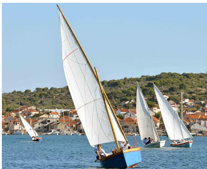
Slika 19. Malo Latinsko idro 2021. (Facebook stranica Latinsko idro , n. d.)