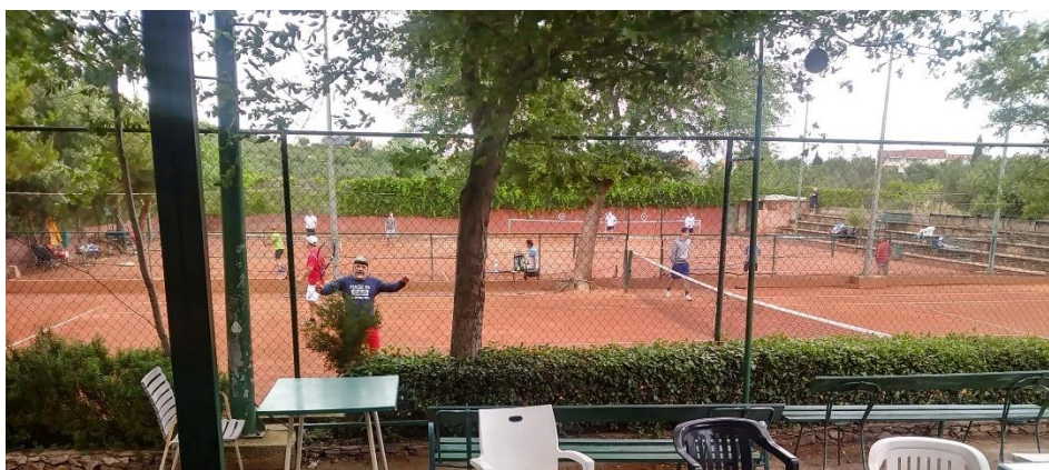
Slika 34. Teniski tereni Slanica.

Teniski tereni Slanica su u privatnom vlasništvu. Mještanima je omogućen privatan zakup teniskih terena uz naknadu ili plaćanje privatnog treninga i edukacije uz profesionalnog trenera.