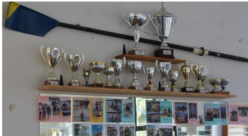
Slika 25. Veliki uspjesi veslača i veslačica Veslačkoga kluba Dupin.