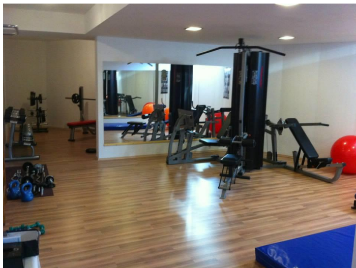
Slika 32. Fitness teretana Sportske dvorane Murter. (Facebook stranica Sportska dvorana Murter , n. d.)

Mala dvorana ili dvorana za korektivnu gimnastiku koja se koristi u različite svrhe grupnog vježbanja, prostorija s opremom za karate te u podrumu dvorane nalazi se fitness teretana (Murtela, n. d.).