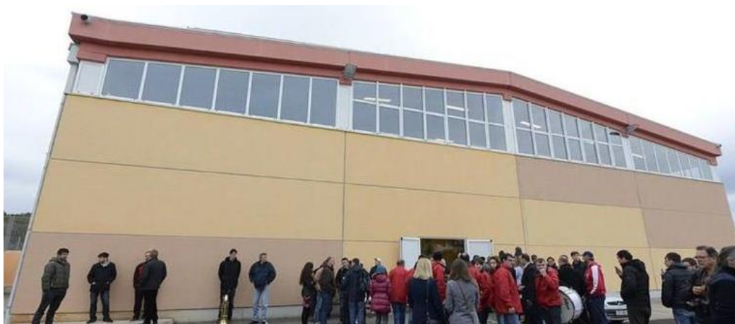
Slika 5. Sportska dvorana OŠ Murterski škoji.