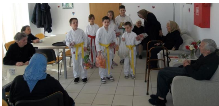
Slika 27. Polaznici Karate škole Tisno daruju korisnike Doma za starije u Tisnom.