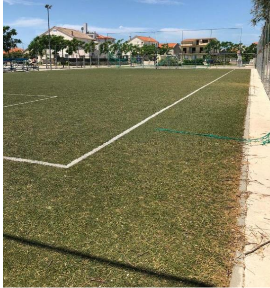
Slika 39. Travnato malonogometno igralište u uvali Zdrače. (Prikaz autora)