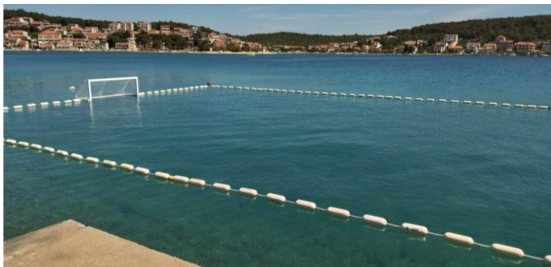
Slika 28. Postojeće vaterpolsko igralište Vaterpolo kluba Tisno . (Facebook stranica Vaterpolo klub Tisno , n. d.)

Klub čini sve kako bi djeca mogla imati još jednu mogućnost za zabavu preko ljeta i stjecanje radnih navika. Trude se da djeca zdravo žive, da budu dobro odgojena te da budu primjer drugima. Pokušava ih se što više zainteresirati, ne samo za vaterpolo, već za bavljenje sportom općenito, kroz cijelu godinu. Klub je financiran iz proračuna Općine Tisno, iz sponzorstava i donacija te iz članarina koje iznose 100 kn za srpanj i kolovoz. Nastoji se nabaviti reflektore za postojeće vaterpolo igralište kako bi vaterpolo bilo moguće igrati i u noćnim satima. Slijedi i nabava pontona kojima bi se vaterpolo igralište „zatvorilo“ u jednu cjelinu. Sve navedeno je u cilju opstanka VK-a Tisno .