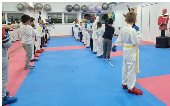
Slika 15. Prostor u kojem se održavaju treninzi Karate kluba Murter .

Treninzi se održavaju tri puta tjedno u vremenskom trajanju od 60 minuta u kompleksu sportske dvorane OŠ Murterski škoji, na katu, koji je u potpunosti prilagođen karate sportu (na podu su postavljene tatami podloge) što je rijetkost stoga se može reći da su uvjeti za trening fantastični. Postavljanjem tatami podloge djeci je omogućeno sigurno i udobno treniranje, a na raspolaganju im je i dosta opreme poput lutke za udaranje, čunjeva, prepona, kapica, kaciga za glavu i vanjskih oklopa za tijelo. Za opremanje je zaslužna Općina Murter-Kornati, na čelu s Tonijem Turčinovom, koja je uvidjela potrebu te se angažirala oko poboljšanja materijalnih uvjeta rada. Iz navedenoga slijedi da rad i ambiciju Karate kluba Murter prate istovremeno i razna ulaganja.