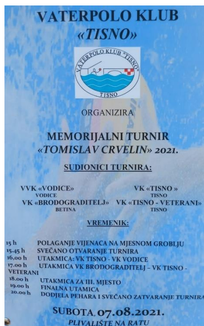
Slika 30. Program Memorijalnoga vaterpolskoga turnira Tomislav Crvelin . (Facebook stranica Vaterpolo klub Tisno , n. d.)

Od istaknutijih igrača iz VK-a Tisno važno je spomenuti Dinu Lordan, kapeticu hrvatske reprezentacije, Mihovila Štimca ( ZPK ) i Luku Tabulu ( Solaris ).