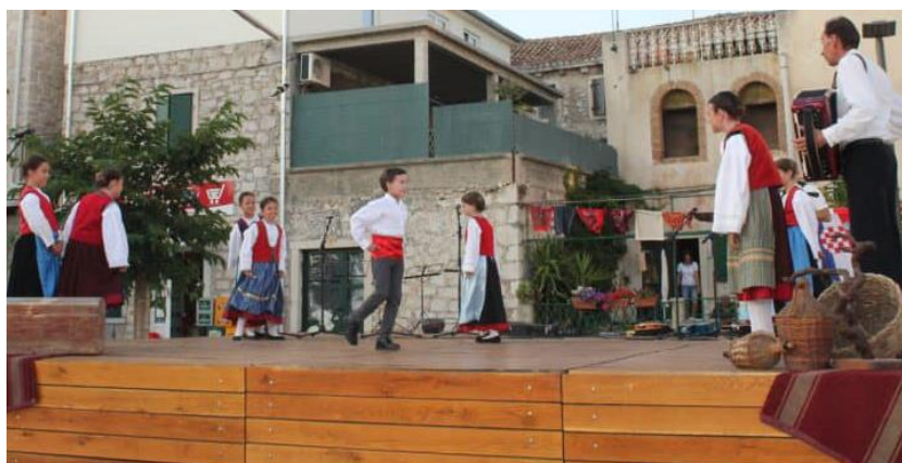
Slika 12. Dječja folklorna večer 2021.

Članovi KUD-a Zora djecu usmjeravaju prema izgradnji pozitivnih stavova prema nasljeđu i to kroz učenje dječjih, tradicijskih pjesama, igara, brojalica i plesa (vidi poglavlje 4.1.1.). To su najčešće djeca vrtićke dobi i osnovnoškolci. U tjednu folkloru, koji se tradicionalno održava u Betini, uvijek je jedna večer posvećena djeci kako bi i ona imala priliku sudjelovati u očuvanju folklorne baštine, a gostuju i dječje grupe drugih KUD-ova. Osim navedenoga, najmlađi članovi KUD-a Zora često odlaze u posjet štićenicima Doma za starije u Tisnom te izvode kratki program kojim obrađuju štićenike (Fržop i Čorkalo, 2018).