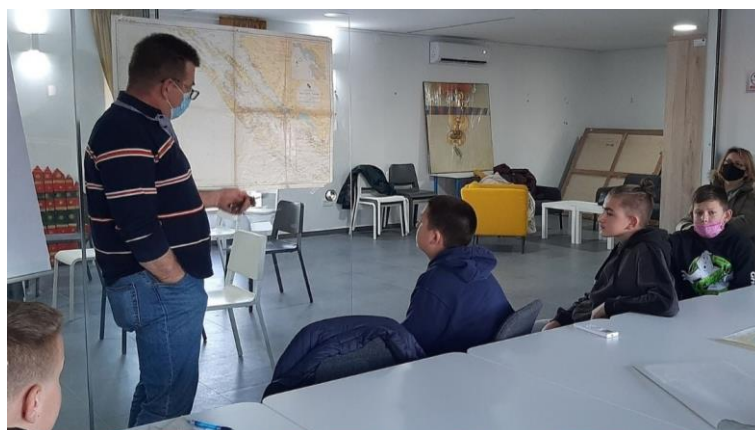
Slika 17. Primjer edukativne radionice pod nazivom Osnova plovidbe u sklopu programa Škole jedrenja . (Facebook stranica Latinsko idro , n. d.)

Koncept plovidbe Ljetne škole jedrenja podrazumijeva plovidbu u tradicionalnom drvenom brodu, odnosno u školskoj gajeti Kurnatarica i gajeti Zadrugarka (vlasništvo Poljoprivredne zadruge ) tijekom Dana latinskoga idra (Latinsko idro, 2020). Djeca se upoznaju sa znanjima i mornarskim vještinama koje su itekako važne za život uz more i na moru. Svaka plovidba traje 90 minuta, a plovi se murterskim akvatorijem dva puta tjedno tijekom ljetnih praznika. Plovidbe uvijek vodi Tina Skračić uz još jednog od aktivnih članova Udruge (Šime Jušić, Leo Mudronja, Krešimir Papeša, Šime Lovrić).