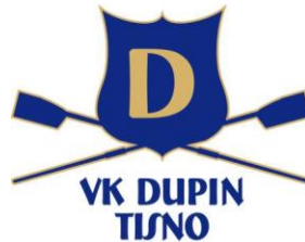
Slika 22. Znak Veslačkoga kluba Dupin . (Facebook stranica Veslački klub „Dupin“ Tisno , n. d.)

Sportska udruga Veslački klub Dupin iz Tisnoga osnovana je 2004. g., a osnivač je grupa građana. Formalno je veslanje započelo u Tisnom već 1995. g. Znak Kluba je žuto slovo D na plavomu štitu te dva prekrížena vesla žute boje pri dnu štita (Skupština Veslačkog kluba Dupin, 2015).