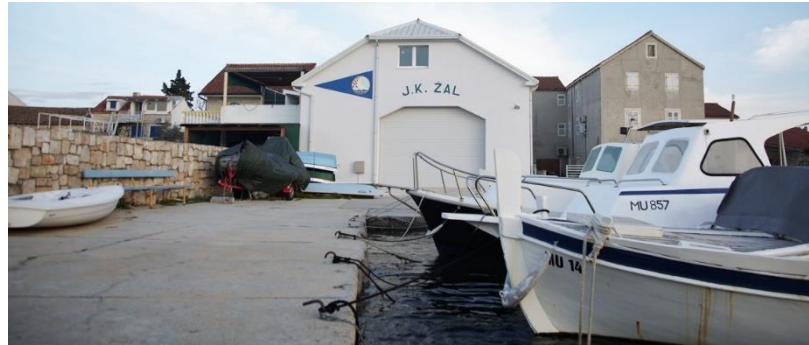
Slika 8. Prostor Jedriličarskoga kluba Žal Betina .

članarina u iznosu od 250 kn/mjesečno. Općina Tisno 2018. investirala je u prostor Kluba koji je sada reprezentativan za okupljanja, učenje i treninge. Dotjerani su pročelje, okoliš i unutrašnjost (sanitarni čvorovi, svlačionice, ured, kuhinja, učionica, prostor za druženje, spavaonica i teretana).