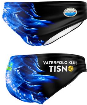
Slika 29. Besplatni kupaći kostim Vaterpolo kluba Tisno . (Turbo, n. d.)