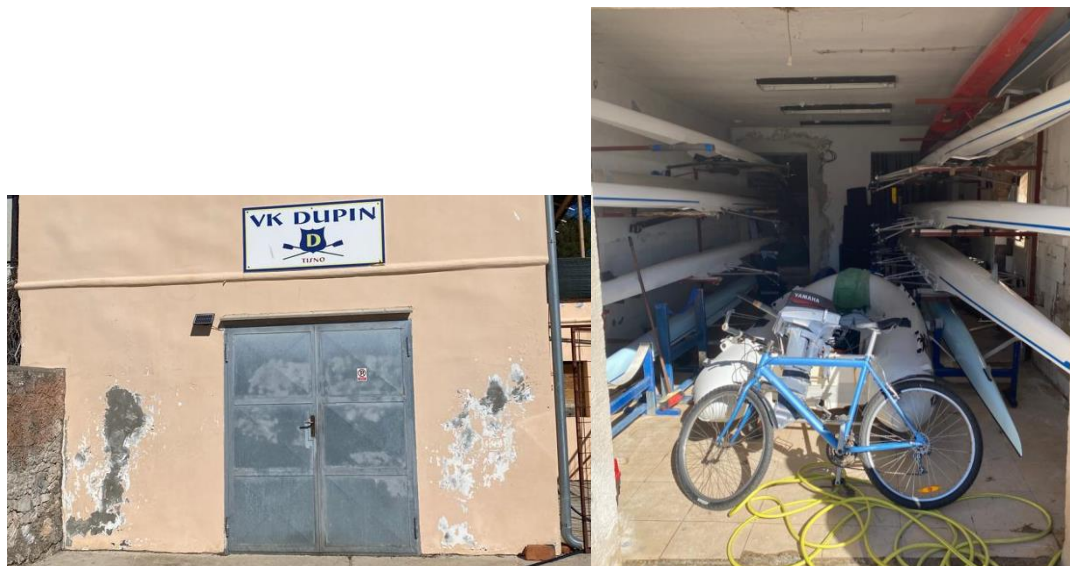
Slika 23. Hangar u prostoru bivšega odmarališta Općine Tuzla.

Potrebno je naglasiti da je veslačka oprema izuzetno skupa i vrlo ju je teško nabaviti. Klub je godinama nabavljao veslačke čamce uz pomoć prijatelja i ponajviše roditelja bivših veslača. Čamac za jednoga veslača košta od 50 do 70 tisuća kuna; četverac košta blizu 140 tisuća kuna; par vesala 50 tisuća kuna, stoga 2000. g. jedan roditelj diže kredit i kupuje brod (dubl), a drugi roditelji se dogovaraju da će plaćati ratu kredita. Zatim jedan skif kupuju donacijama roditelja koje iznose 1500 kn. Preko natječaja Hrvatskoga olimpijskoga odbora Klub dobiva dva broda samca. U navedenom objektu uređena je i teretana, no trenutno se traži nova lokacija uz more gdje bi bilo moguće smjestiti Klub .