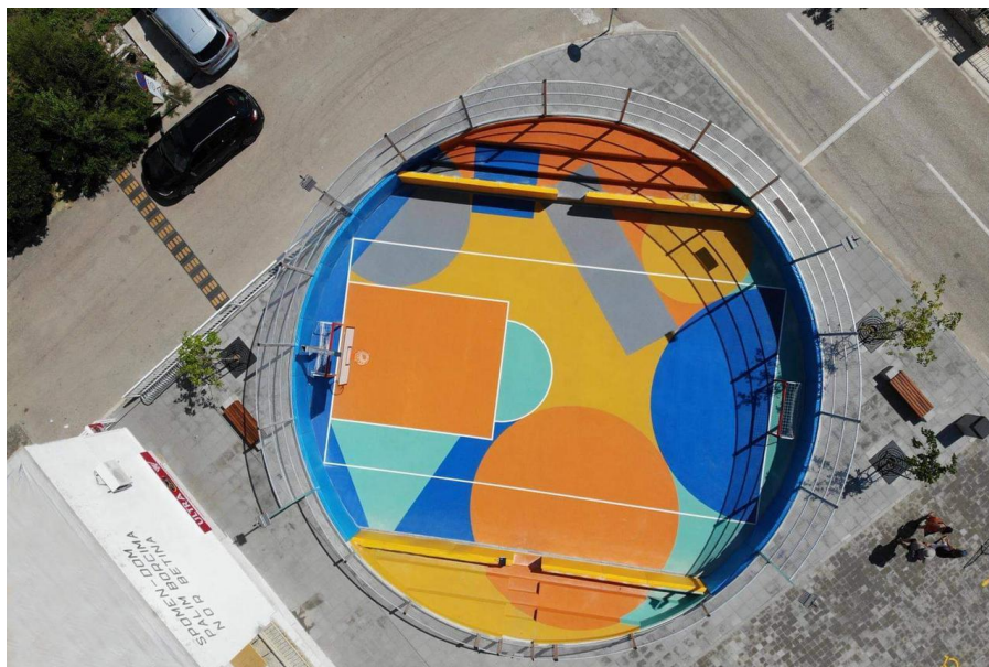
Slika 38. Igralište nadomak Područnog odjela Betina OŠ Murterski škoji. (Večernji.hr, 2019)

Igralište nadomak Područnog odjela Betina OŠ Murterski škoji je specifično jer je omeđeno dvjema prometnicama i privatnom parcelom koja je dosad služila kao parkiralište trgovine u prizemlju školske zgrade. Igralište je spuštено ispod razine ceste upravo zbog neposredne blizine spomenutih prometnica. Ograđeno igralište, promjera 17 m, namijenjeno je za razne sportove i discipline primjerene tjelesnom odgoju (npr. skok u dalj, graničari, košarka, mali nogomet, badminton, odbojka, itd.). Igralište ima i tribine za praćenje sportske igre, stoga je na igralištu moguće održavati i razne predstave, događanja i sl. Izgradnjom igrališta riješen je tadašnji problem nepostojanja adekvatnoga prostora za izvođenje nastave tjelesne i zdravstvene kulture koja se provodila u učionicama i na prometnoj ulici ispred škole. Riječ je o sveukupnoj investiciji od 1,3 milijuna kuna, od čega je 350 tisuća kuna aplicirano na natječaj Ministarstva regionalnog razvoja i fondova EU kroz program - Razvoj otoka .