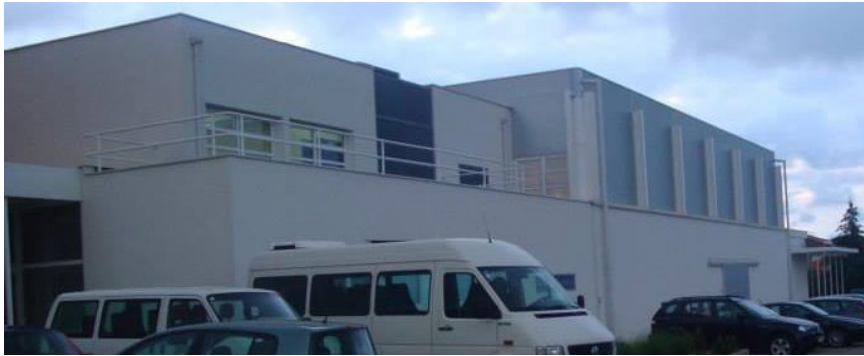
Slika 2. Sportska dvorana Murter.