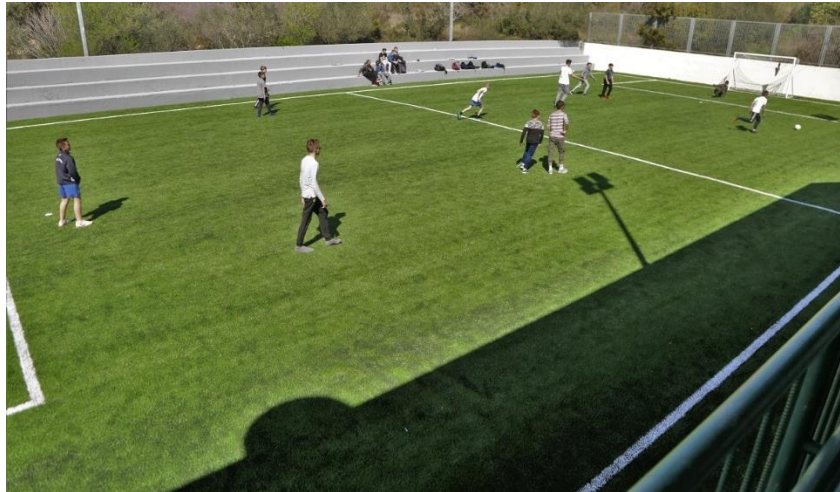
Slika 6. Travnato malonogometno igralište pokraj sportske dvorane OŠ Vjekoslava Kaleba. (Rudinapress, 2016)