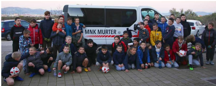
Slika 13. Kombi Malonogometnog kluba Murter . (Murter News, 2020)

Klub posjeduje tri vlastita kombija za prijevoz igrača. Vikendom se igraju prijateljske i ligaške utakmice te razni turniri. Klub je financiran iz proračuna Općine Murter–Kornati i zajednice sportova Općine Murter-Kornati, od dobrovoljnih priloga i darova te članarina koje iznose 200 kn/mjesečno (Skupština Malonogometni klub Murter, 2021). Što se tiče dječjih natjecanja, kroz 2021. g. MNK Murter s "tićima" i pionirima sudjelovao je na natjecanju Top tim lige županije Šibensko-kninske . Radi se o natjecanju mlađih uzrasnih kategorija u Šibeniku, a organizira ga MNK Crnica . Glavni pokrovitelj natjecanja je TOP TIM – online trgovina sportske opreme (Malonogometni klub Crnica – Futsal klub, n. d.). Također, Klub organizira ljetnu školu nogometa za dječake rođene 2009. g. i mlađe koji nisu članovi akademije MNK Murtera .