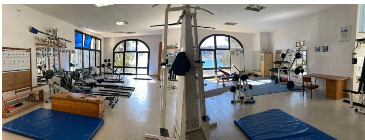
Slika 24. Teretana u prostoru bivšega odmarališta Općine Tuzla. (Prikaz autora)

Potrebno je naglasiti da je veslačka oprema izuzetno skupa i vrlo ju je teško nabaviti. Klub je godinama nabavljao veslačke čamce uz pomoć prijatelja i ponajviše roditelja bivših veslača. Čamac za jednoga veslača košta od 50 do 70 tisuća kuna; četverac košta blizu 140 tisuća kuna; par vesala 50 tisuća kuna, stoga 2000. g. jedan roditelj diže kredit i kupuje brod (dubl), a drugi roditelji se dogovaraju da će plaćati ratu kredita. Zatim jedan skif kupuju donacijama roditelja koje iznose 1500 kn. Preko natječaja Hrvatskoga olimpijskoga odbora Klub dobiva dva broda samca. U navedenom objektu uređena je i teretana, no trenutno se traži nova lokacija uz more gdje bi bilo moguće smjestiti Klub .