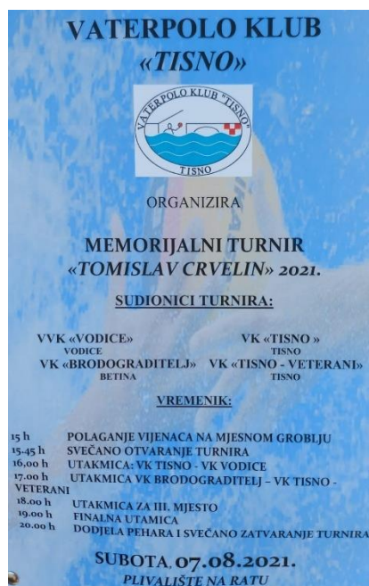
Slika 30. Program Memorijalnoga vaterpolskoga turnira Tomislav Crvelin . (Facebook stranica Vaterpolo klub Tisno , n. d.)

Od istaknutijih igrača iz VK-a Tisno važno je spomenuti Dinu Lordan, kapeticu hrvatske reprezentacije, Mihovila Štimca ( ZPK ) i Luku Tabulu ( Solaris ).