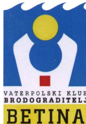
Slika 9. Znak Vaterpolskoga kluba Brodograditelj Betina . (Jadrešić, n. d.)

Cilj Kluba je njegovanje i organizirano razvijanje vaterpola i plivačke obuke, odgojno djelovanje u stvaranju pozitivnih osobina, humanizacija međuljudskih odnosa, poticanje stvaralačkih sposobnosti i ostvarenje sportskih dostignuća. Sve prethodno navedeno se ostvaruje kroz treninge, sudjelovanje na vaterpolskim natjecanjima, kroz suradnju s drugim vaterpolskim klubovima i sl. (Ministarstvo pravosuđa i uprave, n. d.). Znak Kluba je oblika brodske sohe, plave pozadine sa žutom vaterpolskom loptom i crvenim kvadratićem na dnu sohe (Skupština Vaterpolskog kluba Brodograditelj Betina, 2015).