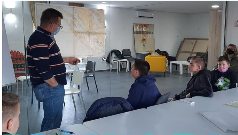
Slika 17. Primjer edukativne radionice pod nazivom Osnova plovidbe u sklopu programa Škole jedrenja .

Koncept plovidbe Ljetne škole jedrenja podrazumijeva plovidbu u tradicionalnom drvenom brodu, odnosno u školskoj gajeti Kurnatarica i gajeti Zadrugarka (vlasništvo Poljoprivredne zadruge ) tijekom Dana latinskoga idra ( Latinsko idro , 2020). Djeca se upoznaju sa znanjima i mornarskim vještinama koje su itekako važne za život uz more i na moru. Svaka plovidba traje 90 minuta, a plovi se murterskim akvatorijem dva puta tjedno tijekom ljetnih praznika. Plovidbe uvijek vodi Tina Skračić uz još jednog od aktivnih članova Udruge (Šime Jušić, Leo Mudronja, Krešimir Papeša, Šime Lovrić).