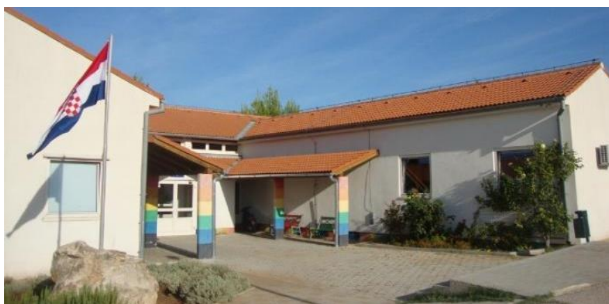
Slika 4. OŠ Vjekoslava Kaleba Tisno. (Osnovna škola Vjekoslava Kaleba, 2011)

Osnovnu školu Vjekoslava Kaleba pohađaju učenici iz Tisnoga i okolnih naselja, Jezera, Dubrave kod Tisna, Dazline i Ivinja. Matična škola nalazi se u Tisnom, a u Jezerima je Područni odjel. Područni odjel Jezera pohađaju samo učenici nižih razreda osnovne škole koji u petom razredu započinju pohađati matičnu školu u Tisnom. Učenicima iz Jezera, Dubrave kod Tisna, Dazline i Ivinja osiguran je prijevoz učeničkim autobusom. Učenicima je na raspolaganju sportska dvorana u Tisnom i travnato malonogometno igralište pokraj dvorane (Osnovna škola Vjekoslava Kaleba, n. d.).