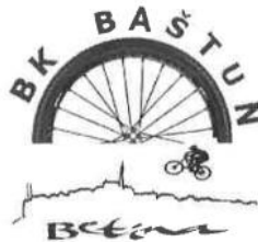
Slika 11. Grb Biciklističkoga kluba Baštun Betina . (Skupština Kluba BICIKLISTIČKOG KLUBA BAŠTUN BETINA , 2020)

se koristi biciklom kao prijevoznim sredstvom. Klub ima svoj grb na kojemu je prikazana polovina biciklističkog kotača koji u sredini ima dio šahovnice, iznad kotača je natpis BK Baštun , a ispod kotača je silueta biciklista ispod kojega je prikazana vizura Betine na kojoj se posebno ističe zvonik crkve Sv. Frane (Skupština Kluba BICIKLISTIČKOG KLUBA BAŠTUN BETINA , 2020).