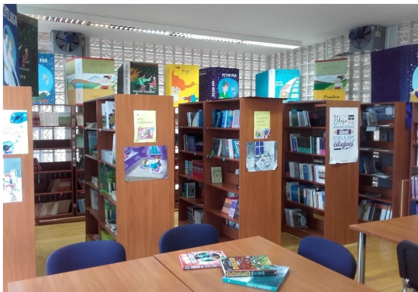
Slika 3. Knjižnica u kojoj se održava Šahovska grupa . (Osnovna škola Murter Škoji, n. d.)