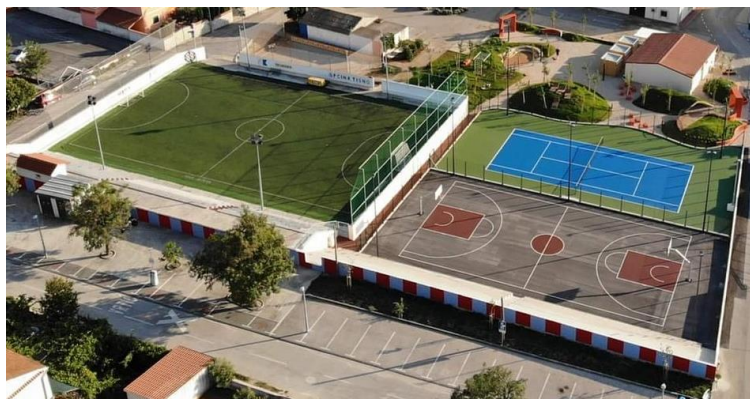
Slika 37. Sportski centar Petrov vrt.

Igralište nadomak Područnog odjela Betina OŠ Murterski škoji je specifično jer je omeđeno dvjema prometnicama i privatnom parcelom koja je dosad služila kao parkiralište trgovine u prizemlju školske zgrade. Igralište je spuštено ispod razine ceste upravo zbog neposredne blizine spomenutih prometnica. Ograđeno igralište, promjera 17 m, namijenjeno je za razne sportove i discipline primjerene tjelesnom odgoju (npr. skok u dalj, graničari, košarka, mali nogomet, badminton, odbojka, itd.). Igralište ima i tribine za praćenje sportske igre, stoga je na igralištu moguće održavati i razne predstave, događanja i sl. Izgradnjom igrališta riješen je tadašnji problem nepostojanja adekvatnoga prostora za izvođenje nastave tjelesne i zdravstvene kulture koja se provodila u učionicama i na prometnoj ulici ispred škole. Riječ je o sveukupnoj investiciji od 1,3 milijuna kuna, od čega je 350 tisuća kuna aplicirano na natječaj Ministarstva regionalnog razvoja i fondova EU kroz program - Razvoj otoka .