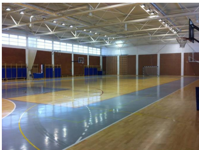
Slika 31. Sportska dvorana Murter. (Facebook stranica Sportska dvorana Murter , n. d.)

Mala dvorana ili dvorana za korektivnu gimnastiku koja se koristi u različite svrhe grupnog vježbanja, prostorija s opremom za karate te u podrumu dvorane nalazi se fitness teretana (Murtela, n. d.).