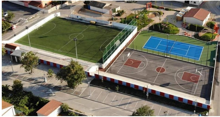
Slika 37. Sportski centar Petrov vrt.

Igralište nadomak Područnog odjela Betina OŠ Murterski škoji je specifično jer je omeđeno dvjema prometnicama i privatnom parcelom koja je dosad služila kao parkiralište trgovine u prizemlju školske zgrade. Igralište je spuštено ispod razine ceste upravo zbog neposredne blizine spomenutih prometnica. Ograđeno igralište, promjera 17 m, namijenjeno je za razne sportove i discipline primjerene tjelesnom odgoju (npr. skok u dalj, graničari, košarka, mali nogomet, badminton, odbojka, itd.). Igralište ima i tribine za praćenje sportske igre, stoga je na igralištu moguće održavati i razne predstave, događanja i sl. Izgradnjom igrališta riješen je tadašnji problem nepostojanja adekvatnoga prostora za izvođenje nastave tjelesne i zdravstvene kulture koja se provodila u učionicama i na prometnoj ulici ispred škole. Riječ je o sveukupnoj investiciji od 1,3 milijuna kuna, od čega je 350 tisuća kuna aplicirano na natječaj Ministarstva regionalnog razvoja i fondova EU kroz program - Razvoj otoka .