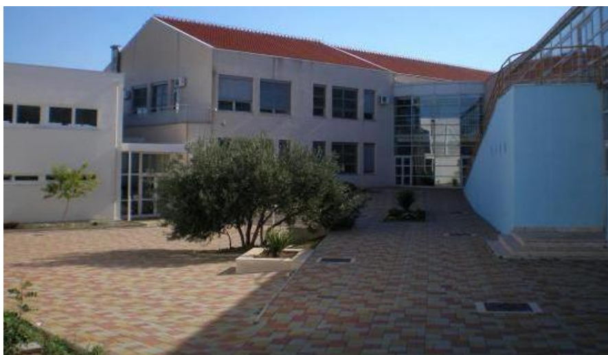
Slika 1. Osnovna škola Murterski škoji. (Facebook stranica OŠ Murterski škoji Murter, n. d. )

Osnovna škola Murterski škoji obuhvaća područje dva mjesta, Murtera i Betine. Matična škola nalazi se u Murteru, a područni odjel je u Betini. Područni odjel Betina pohađaju samo učenici nižih razreda osnovne škole, razredi su kombinirani te učenici u petom razredu započinju pohađati matičnu školu u Murteru. Razlog navedenomu je taj što Područni odjel u Betini raspolaže samo s dvije učionice. Matičnu školu u Murteru pohađaju učenici svih razreda osnovne škole. Učenicima je od 2009. godine na raspolaganju sportska dvorana površine 1624m 2 koja se nalazi uz školsku ustanovu te knjižnica koja broji 3919 knjiga. U knjižnici se održava jedna kineziološka izvannastavna aktivnost, a to je Šahovska grupa ( Osnovna škola Murterski Škoji, n. d. ).