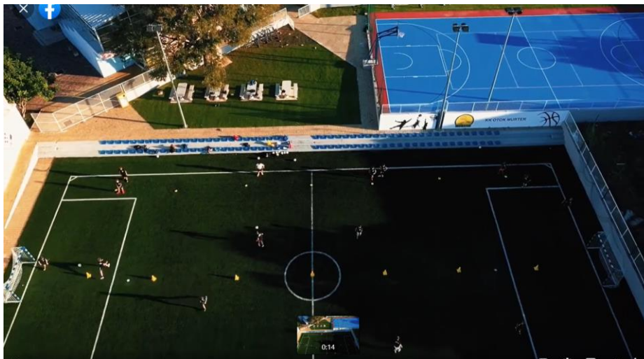
Slika 33. Nogometni i košarkaški teren, trim-staza i crossfit oprema. (Toni Veljača, 2022)

Športsko-rekreacijski centar „Murterski škoji“ nalazi se u sklopu Sportske dvorane Murter te je dostupan za korištenje školskoj djeci i mještanima. Športsko-rekreacijski centar financiran je 90% iz Općinskog proračuna, a Hrvatski olimpijski odbor sufinancirao je opremu – branke, koševе i zaštitnu ogradu u vrijednosti od 100 tisuća kuna.