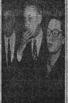
Slika 3: Slobodna Dalmacija, izdanje 19. siječnja 1970. godine

Ispljen visok stupanj jedinstva su oni koji su se dali prevesti od strane neprijatelja. Oni su često bili ljudi koji su bili previše optimistični i nisu vidjeli opasnost koja ih okružuje. Njihova sudbina je bila tragična, a njihova smrt je bila neizbježna.