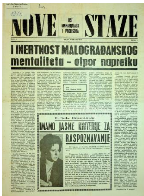
Slika 8: Nove staze, Split, svibanj 1971., br. 2

djelovao je u Splitskom kazalištu i na Dubrovačkom kazališnom festivalu. U svom profesorskom zanatu se istaknuo predavačkim žarom kojim je govorio o hrvatskim glazbenicima i njihovom stilu u glazbi. Smatrali su ga jednim od najboljih poznavatelja kako glazbe tako i povijesti glazbe. Zbog svog djelovanja, načina predavanja je okvalificiran kao gorljivi Matičar. Smatrali su da učenicima približava istaknute hrvatske intelektualce ne bi li ih tako zainteresirao za rad Matice. U razredu je interpretirao tekst Hrvatske domovine ukazujući na estetsku vrijednost i ljepotu glazbene sastavnice. Zbog toga je nakon Karađorđeva bio jedna od meta u Splitu. Doživio je oštru kritiku, a njegov je rad proglašen nacionalističkim zastranjivanjem. UDB-a je inzistirala na tome da ga se udalji iz škole, iz radnog mjesta profesora, što se i dogodilo unatoč protivljenju njegovih kolega prof. Marušića i prof. Zubanovića. Nakon Karađorđeva Nova staze su zabranjene, broj 3 – 4 je uništen u tiskari, a urednici prof. Bošković, prof. M. Mihanović i prof. Vlašić su snosili posljedice svoga uključivanja i djelovanja u Hrvatskom proljeću. 122