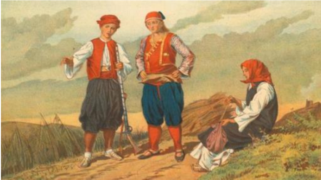
Slika 1.- prikaz Neretvana i Neretvanke oko 1880.

od: košulje (najčešće bijela), sukjene gaće (hlače od vune, najčeće crne, modroplave), sukjene bičve (vunene čarape), opanci i na glavi kapu (škrakju, najčešće crne, modroplave ili crvene boje). 60