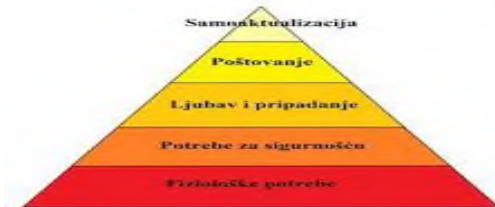
Slika 1. Maslowljevja piramida potreba 1

Motivacija dolazi od latinske riječi movere što bi značilo pokretati (Cramer i Jackscath, 1998) a možemo je definirati kao stanje u kojem smo „iznutra“ pobuđeni nekim potrebama, porivima, težnjama, željama ili motivima, a usmjereni prema postizanju nekog cilja koji izvana djeluje kao poticaj na ponašanje (Petz, 2005, prema Bosnar i Balent, 2009, str. 24). Prema ovoj definiciji možemo vidjeti, a kako nadalje navode Bosnar i Balent (2009) da pojam motivacija sadrži nekoliko ključnih dijelova: subjektivni doživljaj; potrebe, porive i želje koji bi doveli do ostvarenja tog doživljaja; te cilj koji bi doveo do ostvarenja potreba, poriva i želja. Zamislimo nogometaša koji po prvi puta u životu igra neku bitnu utakmicu (npr. finale prvenstva ili utakmicu protiv mnogo jačeg protivnika). Neposredno prije izlaska na teren, u igraču se stvara osjećaj anksioznosti i nervoze (subjektivni doživljaj) koji je posljedica izrazite želje da ostvari svoj cilj (npr. da postigne pobjednički gol) te da na taj način dokaže sebi, treneru, suigračima i navijačima svoju vrijednost (ostvarenje svojih potreba i želja). Da bismo mogli bolje razumjeti potrebe sportaša i njihovu motivaciju, potrebno je sagledati Maslowljevju piramidu potreba (Slika 1.)