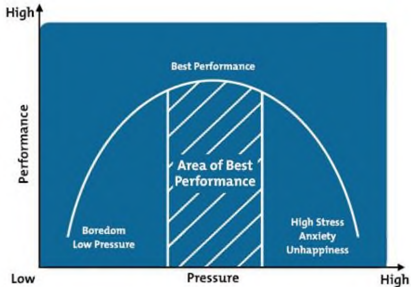
Slika 3. Model obrnutog U 9

U reguliranju razine pritiska sportaša i učenju tehnika nošenja s pritiskom je od iznimne važnosti rad trenera i sportskog psihologa sa sportašima. Gröpel i Mesagno (2017) su naveli jedan od primjera kako je sportski psiholog njemačke nogometne reprezentacije na Svjetskom prvenstvu 2016. godine osigurao da njegovi igrači za vrijeme raspucavanja (penali) postignu pogodak i osiguraju pobjedu. Naime, Tim Borowski (tadašnji reprezentativac) je prije pucanja penala viknuo svojoj klupi i vrataru suparničke momčadi gdje će pucati. U trenutku kada je zapucao, vratar se bacio u tu stranu no Tim je svakako uspio postići zgoditak. Njemačka reprezentacija je u nekoliko utakmica prošla dalje zahvaljujući fazi raspucavanja te su svi igrači, osim jednog, uspješno postigli pogotke na isti način.