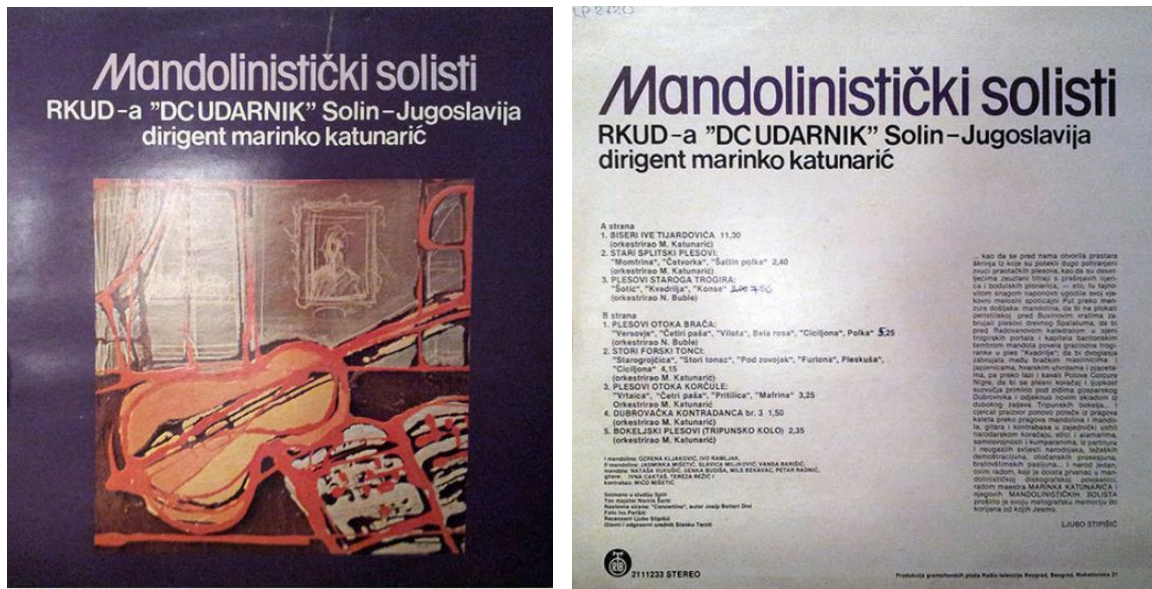
Slika 10. Izgled albuma mandolinističkih solista iz 1982.