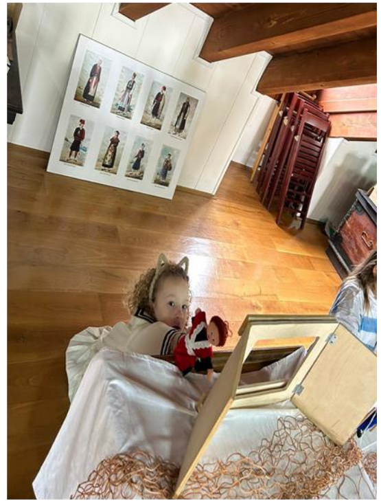
Slika 25. Radionica „Ribar Jure“ – dramski centar