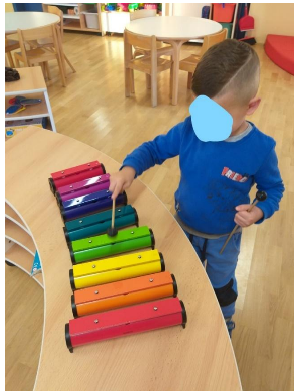
Slika 21. Igra bojama