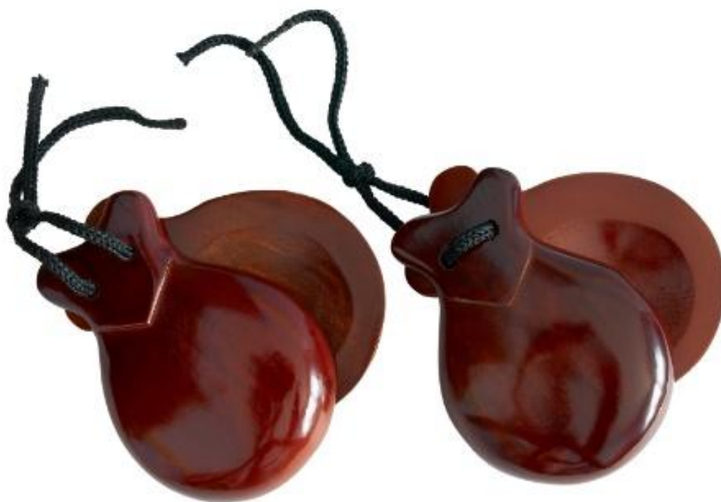
Slika 13. Kastanjete

Kastanjete su španjolski narodni glazbeni instrument. Sviraju se tako da se vrpca natakne na palac ili srednji prst te se spretnošću svirača, kao i pokretima prstiju i dlana, dobivaju precizni ritmovi. Ovaj glazbeni instrument djeci može biti zahtjevan za sviranje, no ako dječji vrtić posjeduje kastanjete, možemo ih ponuditi djeci kako bi pokušala njima pratiti svoj ples. U vrtićima i orkestrima postoje još i kastanjete koje izgledaju kao drvena ili plastična pločica na kojoj je sa svake strane pričvršćena po još jedna pločica. Mahanjem tom udaraljkom pločice naizmjenice klopću po srednjoj pločici te tako proizvode zvuk (Gospodnetić, 2015:187).