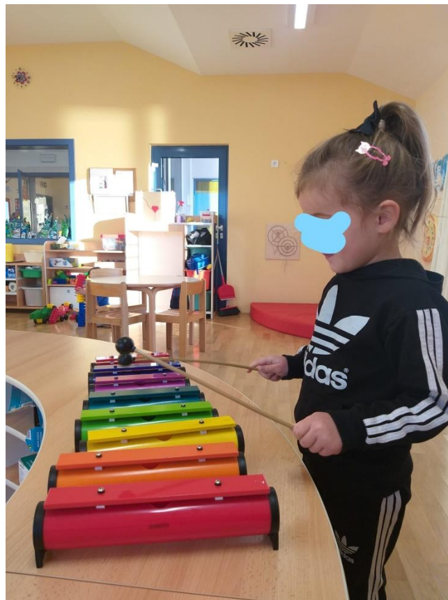
Slika 22. Zvuk metalofona