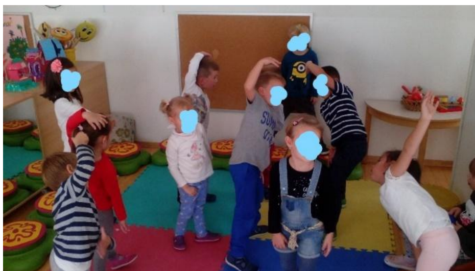
Slika 16. „Hod životinja“