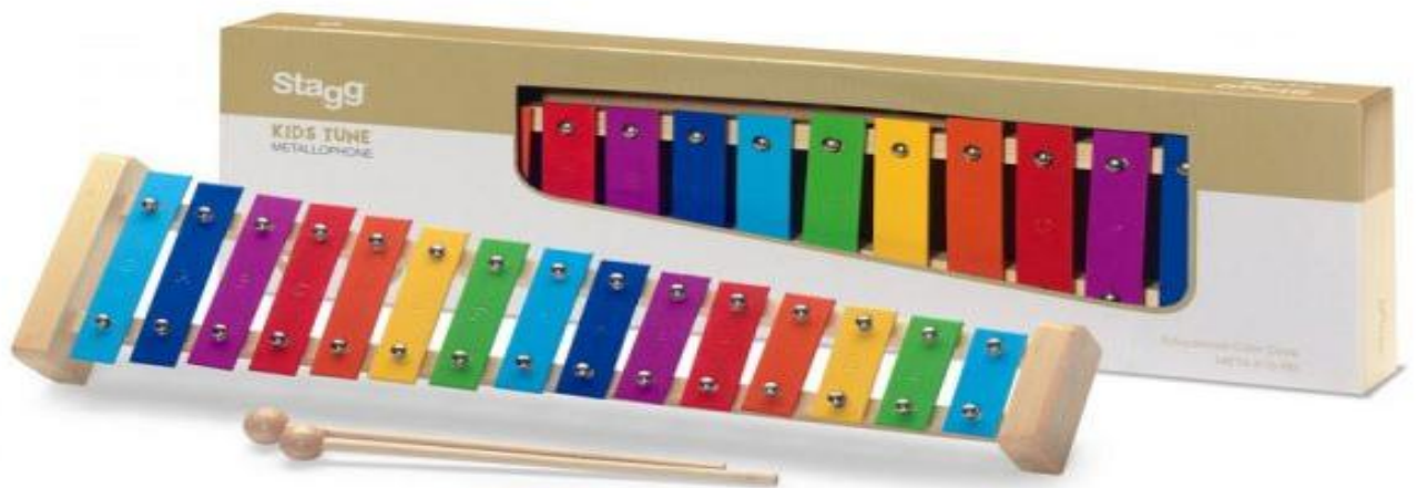
Slika 3. Metalofon

Metalofon je instrument sličan ksilofonu, a od njega se razlikuje po tome što ima metalne pločice i svira se drvenim batićima (Gospodnetić, 2015:180).