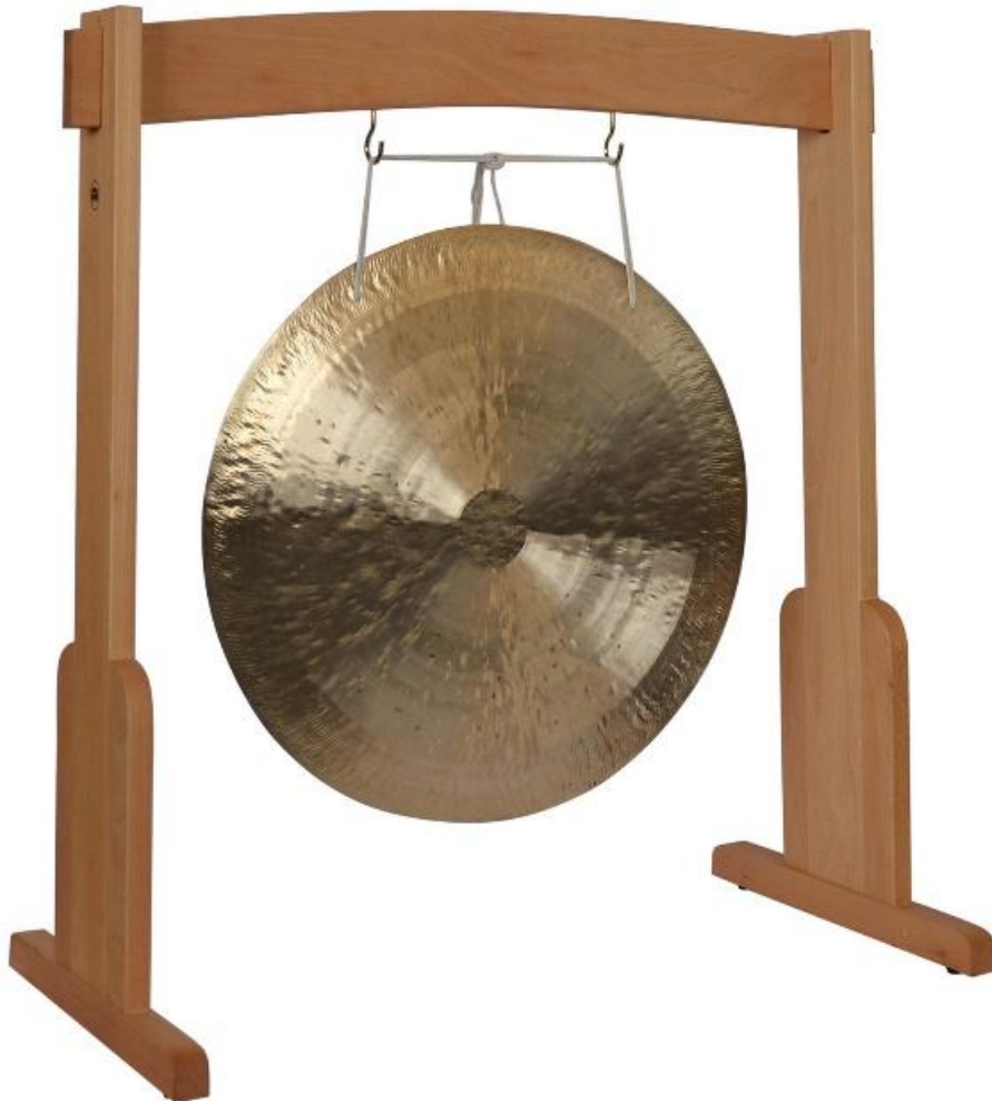
Slika 5. Gong

Gong je instrument nalik većoj brončanoj čineli koja visi uspravno. Svira se mekim batom kojim se udara po sredini kruga, gdje se nalazi izbočina poput grbe. Gong daje samo jedan ton koji dugo odzvanja (Gospodnetić, 2015:182).