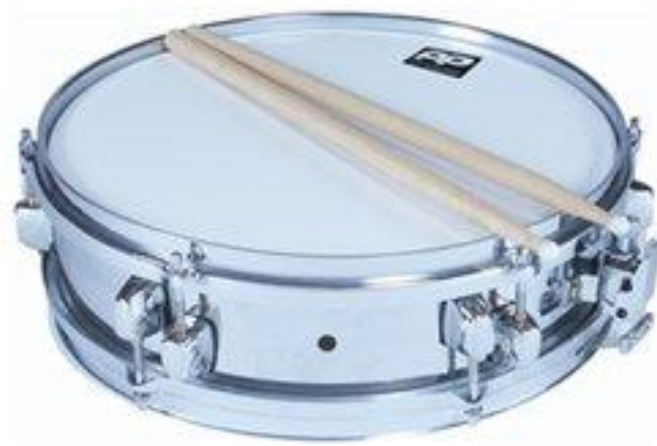
Slika 7. Mali bubanj

Plast valjka najčešće je napravljen od mjedi, dok je ponekad napravljen od drveta. Mali bubanj ima vrpcau pomoću koje ga dijete može objesiti oko vrata. Za sviranje se uglavnom upotrebljavaju lagane palice s drvenim glavama (Gospodnetić, 2015:184).