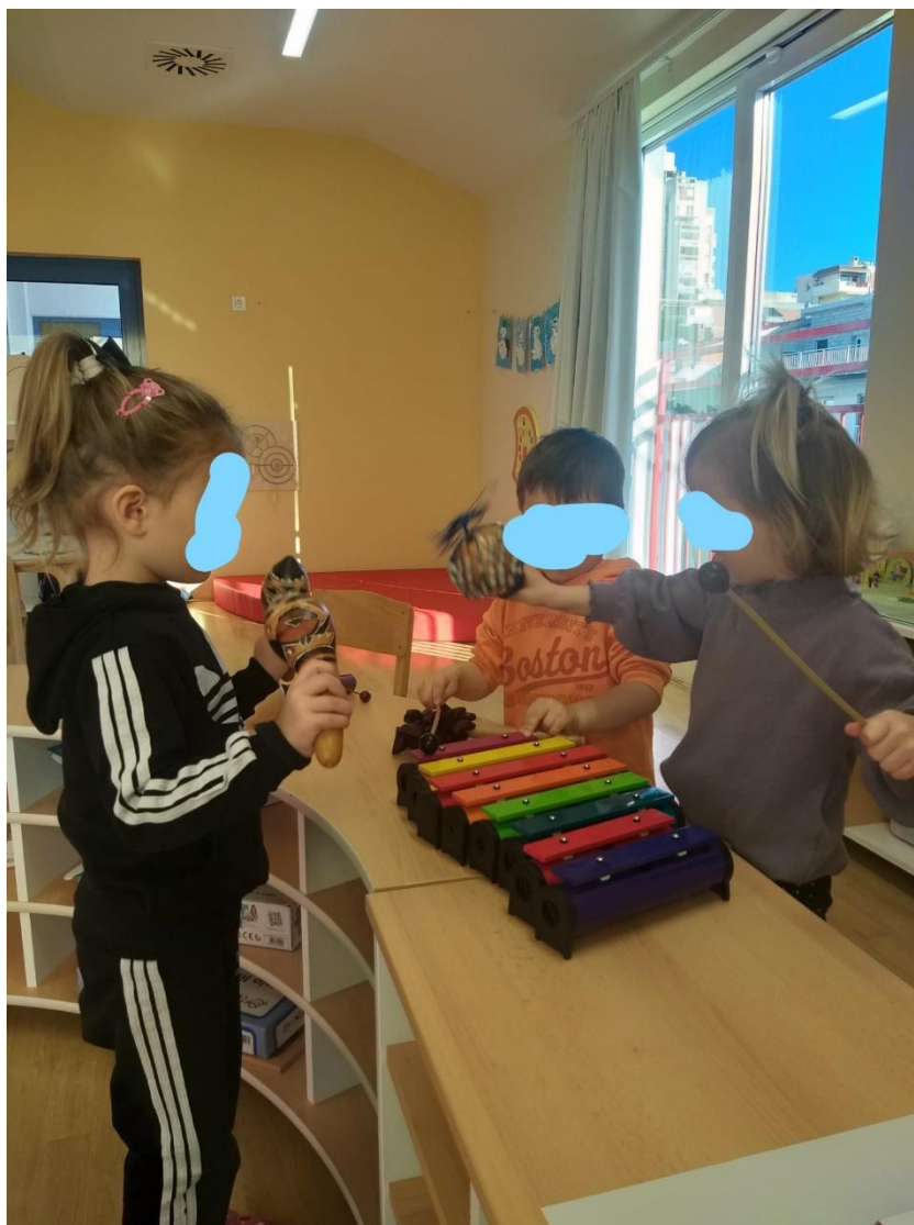
Slika 23. Koncert udaraljka