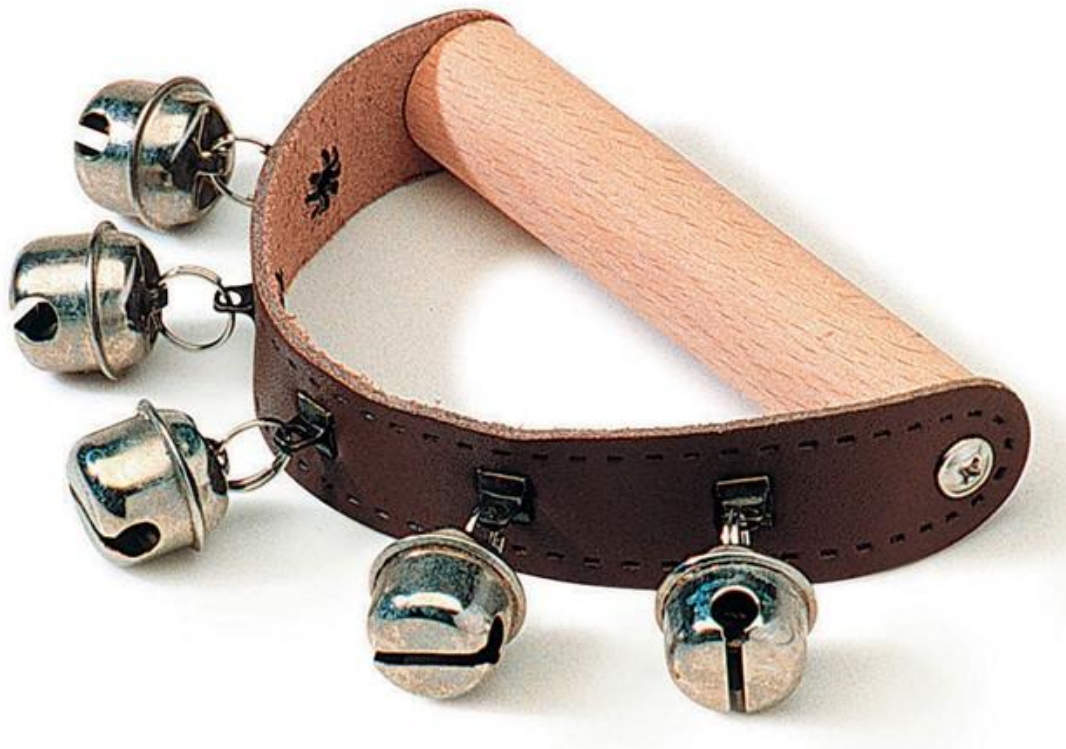
Slika 12. Praporci

Praporci su male metalne kuglice, od kojih svaka funkcionira kao zvečka. Uvijek se sastoje od nekoliko kuglica prikačenih na drveni štapić. Taj se drveni štapić drži u ruci i njime se trese ili se po njemu lupka. Kuglice praporaca također mogu biti nanizane na kožnu narukvicu koja se zaveže djetetu oko ruke ili noge, tako dijete istovremeno pleše i svira (Gospodnetić, 2015:187).