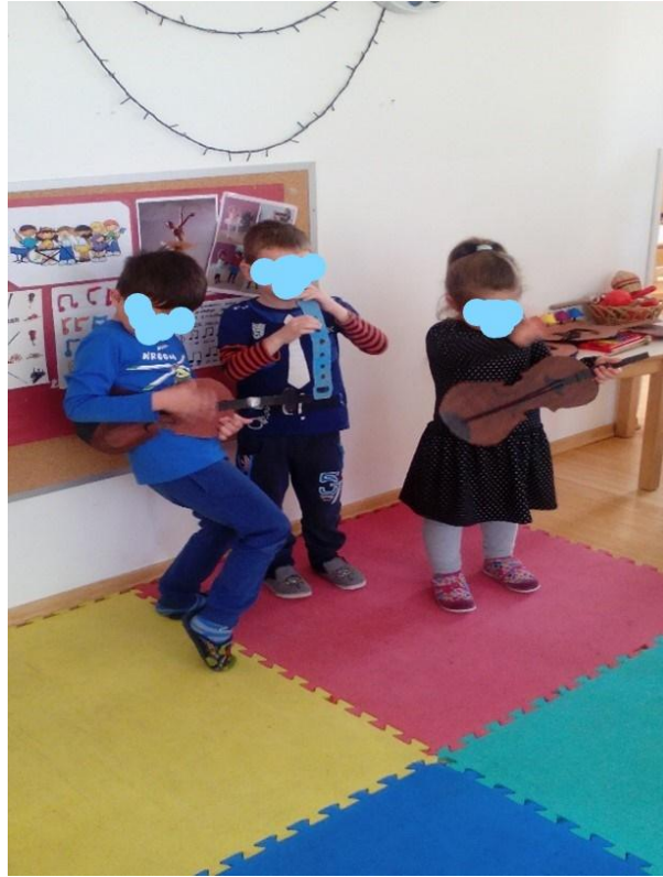
Slika 18. „Melodija iz mašte“