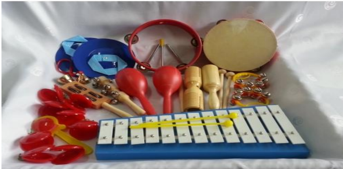
Slika 1. Orffov instrumentarij

Orffov instrumentarij koristi se u nastavi glazbe u osnovnoj školi još od 1959. godine, kada se prvi puta spominje u nastavnom planu i programu (Enciklopedija.hr).