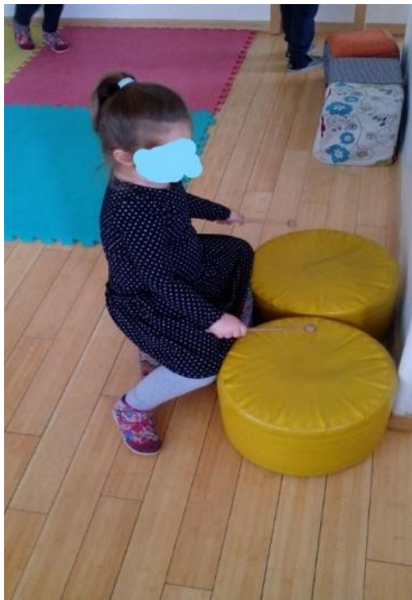
Slika 19. „Mali bubnjar“