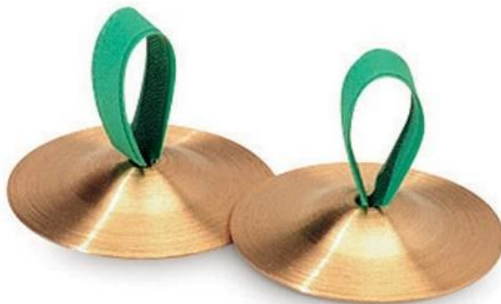
Slika 9. Činele