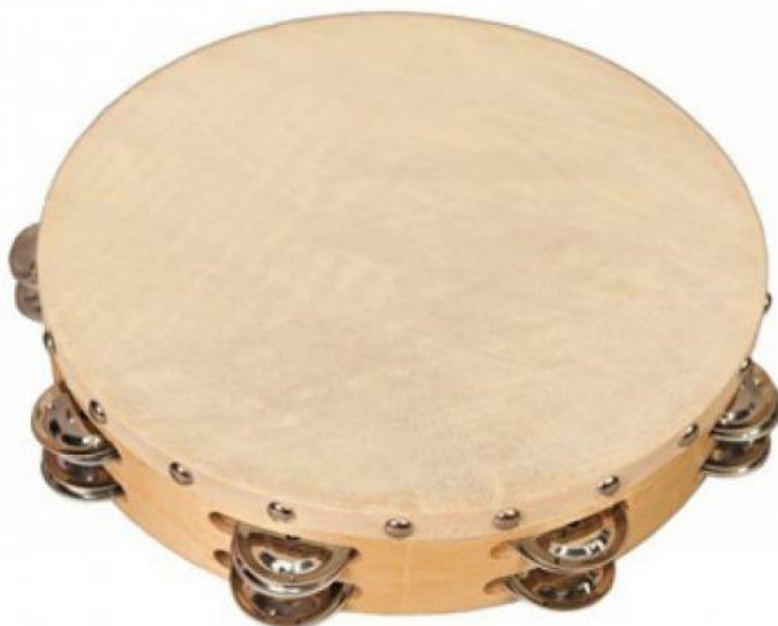
Slika 11. Tamburin

Postoje i razne druge kombinacije (npr. lupkanje defom po boku) koje proizlaze iz raznih folklornih zona ili pak kreativnosti pojedinog svirača (Gospodnetić, 2015:186).