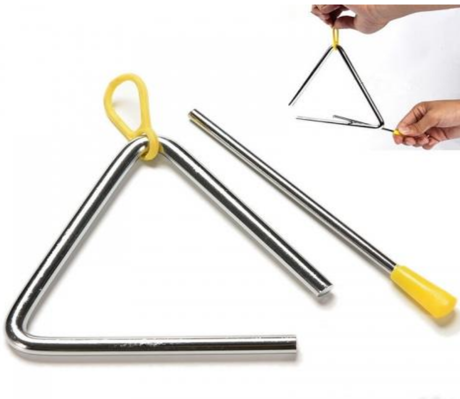
Slika 8. Triangl

Triangl je instrument izrađen od finoga čelika. Svira se tako da lijeva ruka drži vrpцу na kojoj visi triangl, pri čemu treba paziti da prst ne dotakne metal. Ako se to dogodi, triangl neće moći titrati i proizvoditi zvuk. Triangl se može objesiti i na stalak te se tako desnom rukom tankim čeličnim štapićem svira po donjoj stranici, pazeći da se ruka brzo odmakne. Da bismo zaustavili zvuk, potrebno je lagano rukom dotaknuti trokutić. Instrument je vrlo glasan i prodoran pa se preporuča upotreba samo jednog trianglera istovremeno (Gospodnetić, 2015:184).