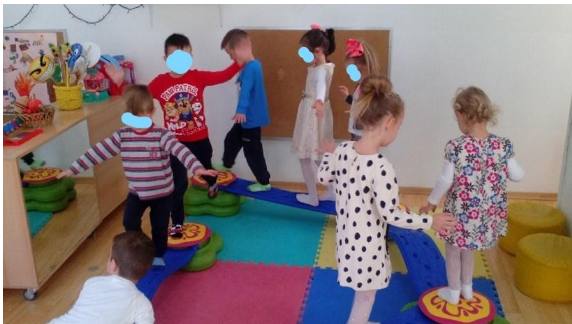
Slika 15. „Stupanje vojnika“

Ovo su neki od primjera aktivnosti u kojima je glazba korištena kao poticaj: