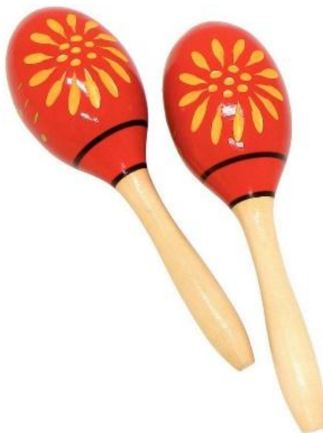
Slika 10. Zvečke

Zvečka je, uz štapiće, najčešće korištena udaraljka u dječjem vrtiću zato što se može lako i kvalitetno izraditi s djecom ili za djecu od različitih neoblikovanih materijala (Gospodnetić, 2015:186).