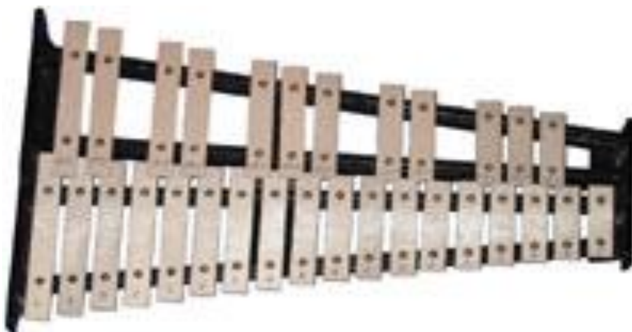
Slika 4. Zvončići

Zvončići su instrument sličan metalofonu. Od metalofona se razlikuju po boji zvuka i po visini tonova koji obuhvaćaju oktavu više nego metalofon. Za sviranje se koriste lagani metalni batići ili lagane palice s drvenim glavama (Gospodnetić, 2015:180).