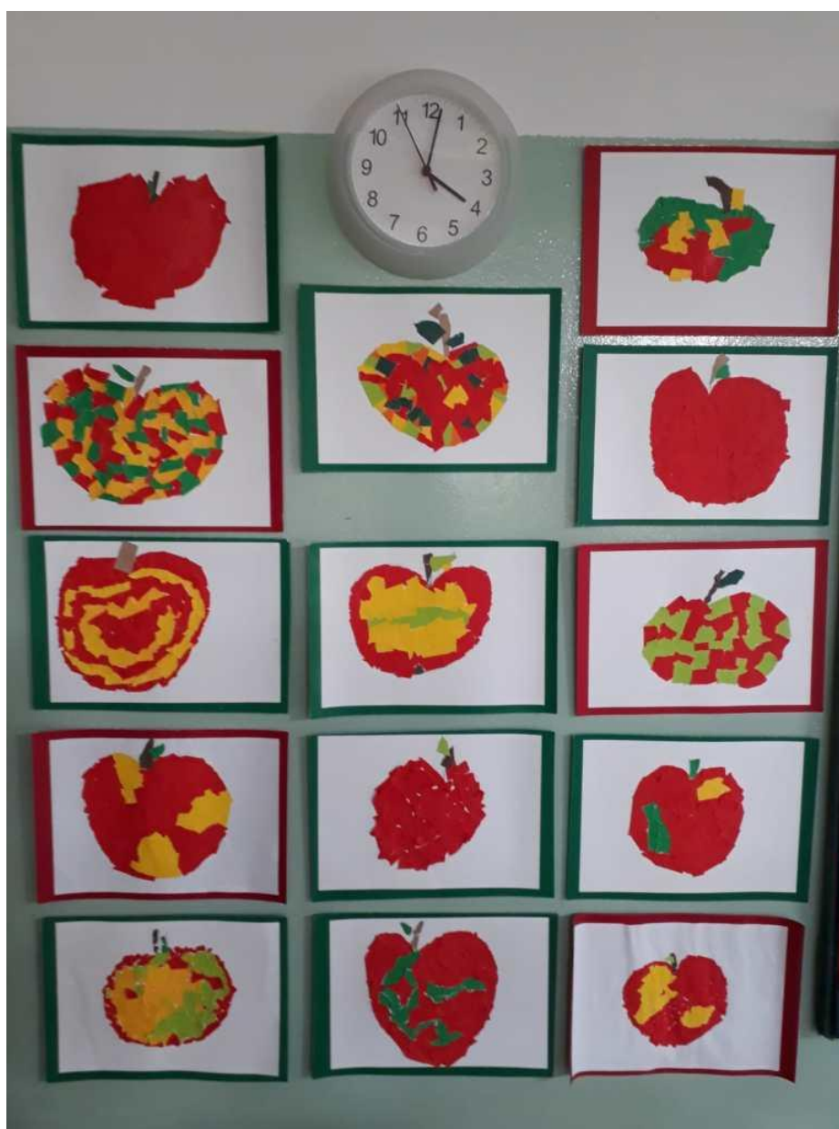
Slika 14. Jabuka, kolaž

Cilj aktivnosti koje uključuju glazbu nisu vježbanje izgovora, kao ni razvijanje pravilnoga disanja ili usvajanje matematičkih pojmova. Cilj je doživljaj glazbe. Takve aktivnosti je važno povezivati ostalim vrstama aktivnosti. Na primjer, kad s djecom pjevamo pjesmu „Jula i jabuka“, crtanje jabuke predstavlja aktivnosti izražavanja i stvaranja, dok je brojanje jabuka primjer istraživačko-spoznajnih aktivnosti. Ako tijekom aktivnosti dominira pjevanje, onda se radi o čistoj aktivnosti izražavanja i stvaranja, ali glazba se može prožimati i s drugim vrstama aktivnosti pa se tako tijekom pokretnih igara često u radu s djecom koriste bubanj ili tamburin koji daju tempo trčanju. Primjer može biti i igra tijekom koje djeca broje koliko su otkucaja čula pa toliko igračka mogu uzeti sa stola (Gospodnetić, 2015:59).