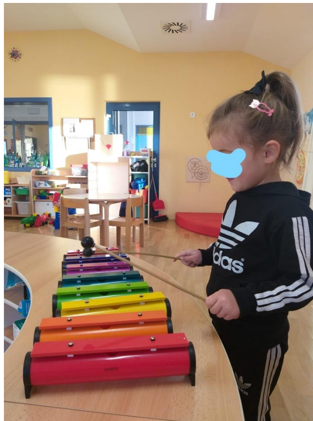
Slika 22. Zvuk metalofona

E. M. prilazi šuškalicama i uzima ih u obje ruke. Zvuk šuškalica joj je zanimljiv te kod nje izaziva radost i veliki osmijeh. S metalofonom rukuje spretno. Tijekom aktivnosti djevojčica E. M. komentira: „Kod babe i dide imam šuškalice, a ovo ti je moja seka imala kad je bila mala i svirala je, al' mene nije bilo kad je ona bila mala.“ Odlazi do stolića s metalofonom. Štapićima klizi po tonovima i raduje se tome. Počinje naizmjenično svirati na instrumentima. Zaplesala je sa šuškalicama u rukama. Dijete se u aktivnosti zadržalo oko 14 minuta.