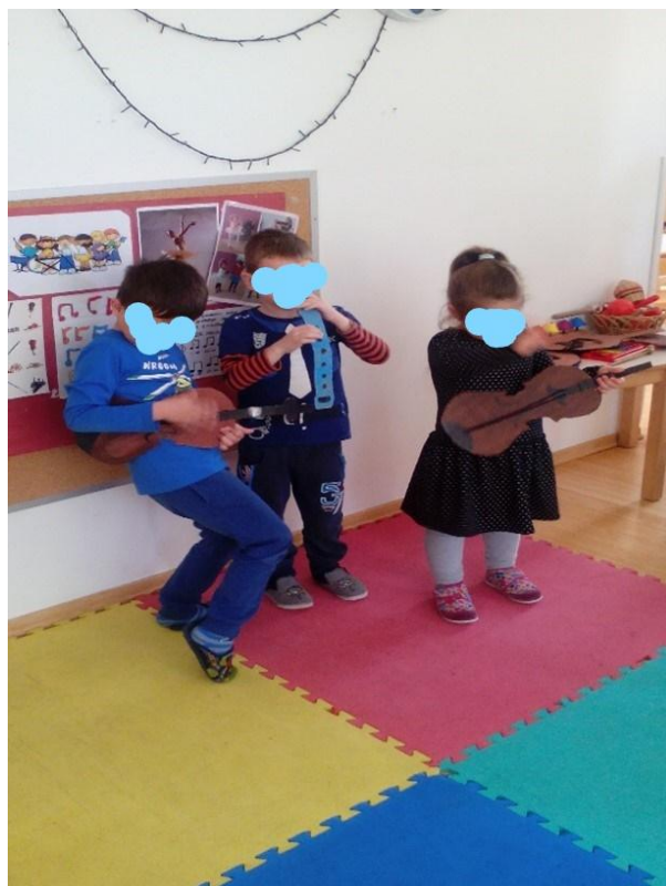
Slika 18. „Melodija iz mašte“