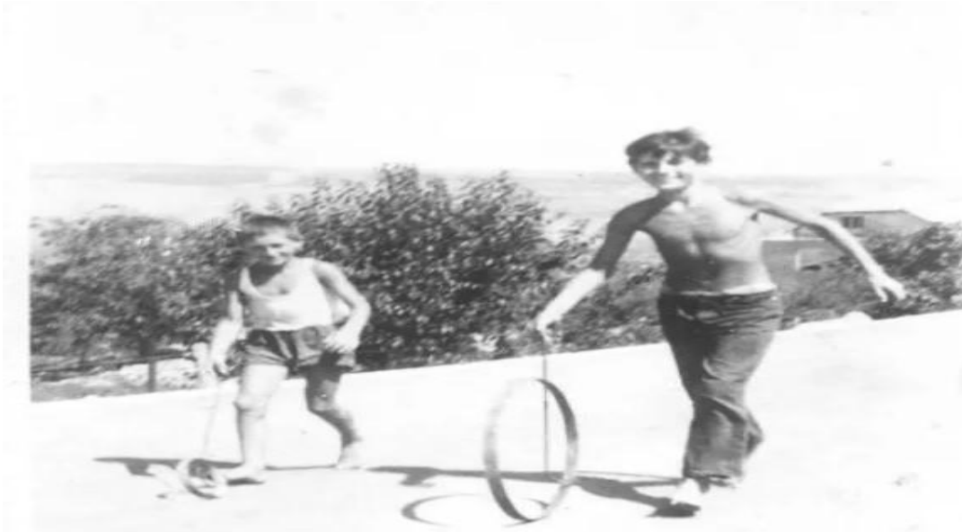
Slika 10. Guranje obruča od bačve