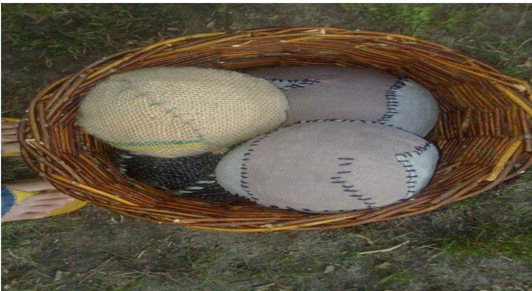
Slika 8. Suvremena inačica krpene lopte