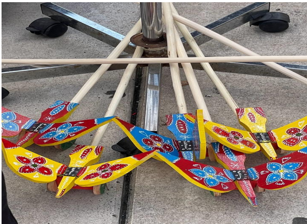
Slika 5. Klepetalo