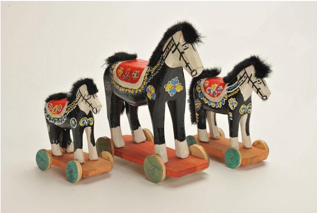
Slika 6. Crno-bijeli konjići