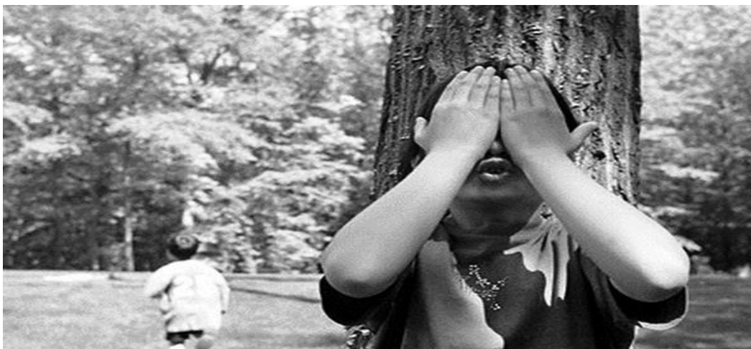
Slika 3. Skrivača