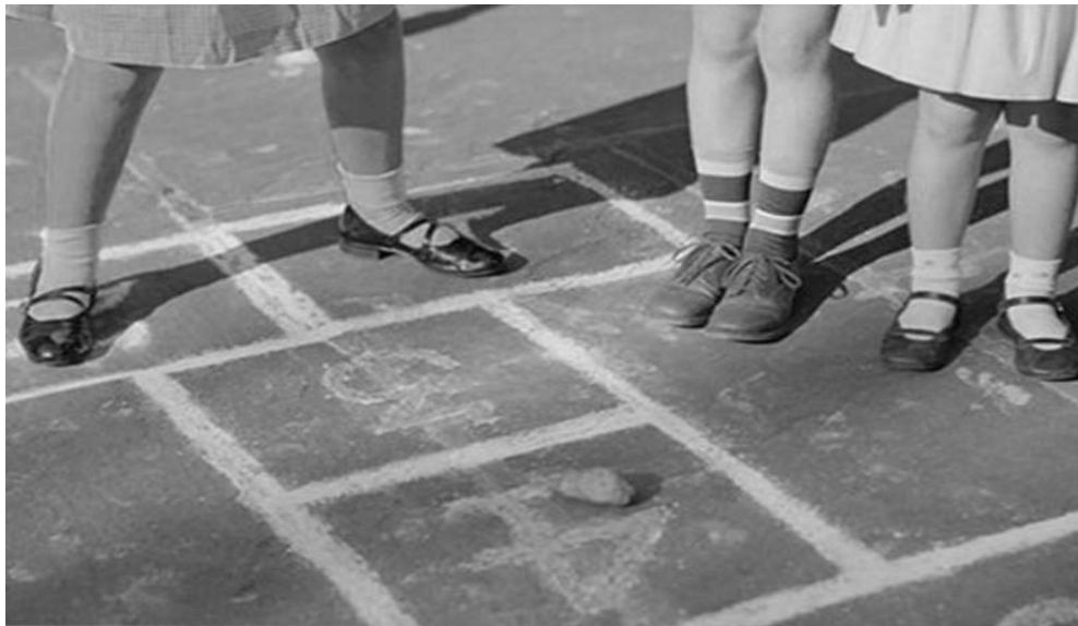
Slika 2. Školica