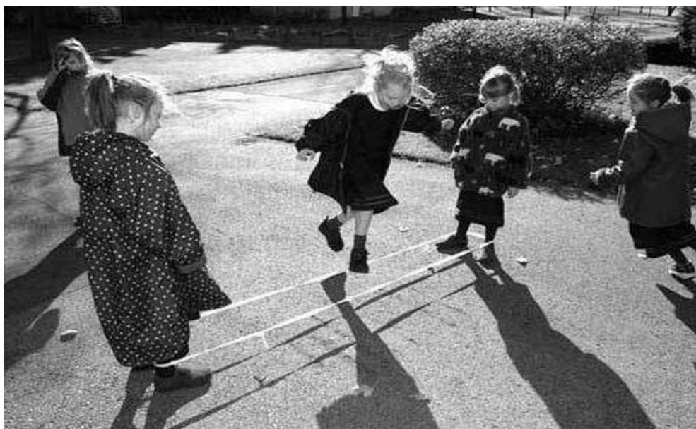
Slika 1. Igra s elastičnom trakom