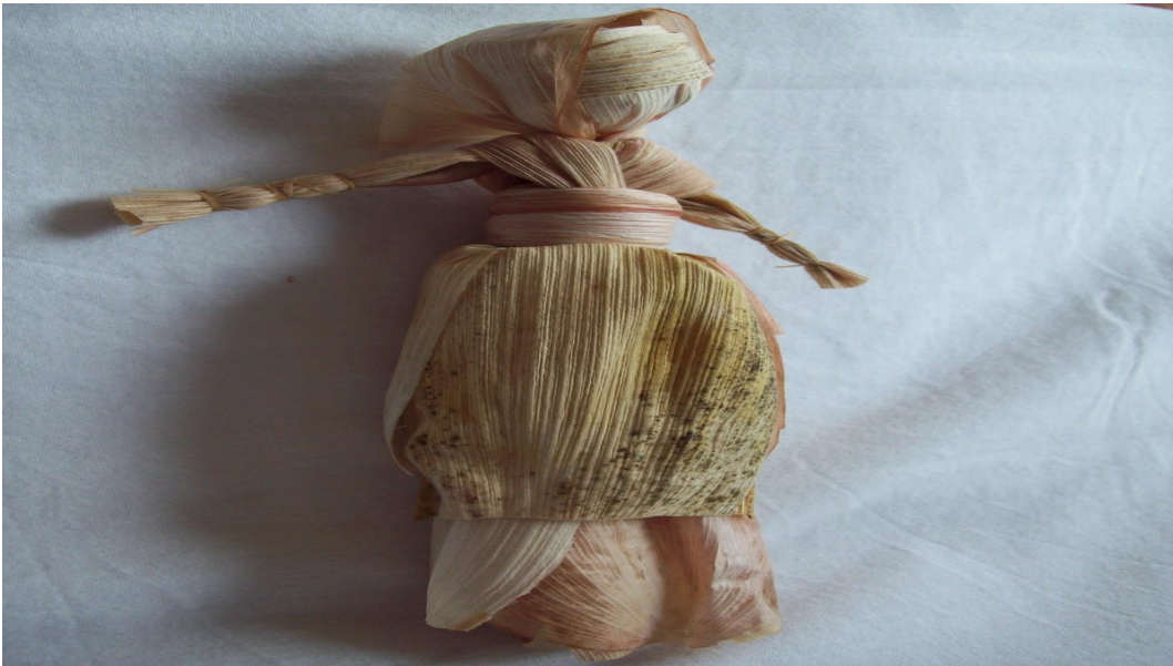
Slika 7. Lutka od kukuruznih listova