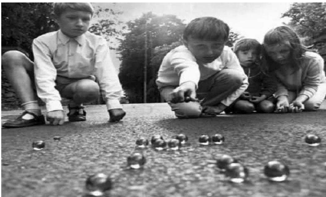
Slika 9. Igra s franjama