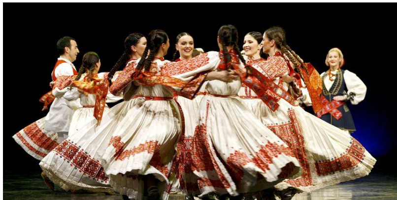
Slika 1. Narodni ples

Narodni plesovi, kao najdrevnija izražajna forma narodne umjetnosti, nastali su unutar specifičnog naroda i odražavaju sve njegove karakteristike koje ga čine jedinstvenim u odnosu na ostale narode, kao što su odjeća, tradicija, običaji i vjera. Kroz folklor, ove osobine se pokušavaju očuvati i prenositi na nove generacije putem narodnih plesova. Autorica Bijelić (2006) ističe podjelu plesa temeljenu na glazbenoj pratnji, obliku plesanja i spolu. Prema navedenoj podjeli, ples može biti s glazbenom pratnjom, bez glazbene pratnje, s glazbenom pratnjom uz vokalnu pratnju ili bez glazbene pratnje s vokalnom pratnjom. Zatim, prema obliku plesanja, postoji solo ples, lese, ples u parovima, trojkama, četvorkama i slično. I na kraju, prema spolu, može biti samo muški ples, samo ženski ili mješoviti (Bijelić, 2006).