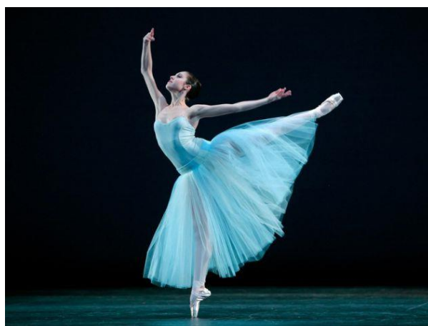
Slika 3. Umjetnički ples

Kada je riječ o umjetničkom plesu, on se podijelio na klasični i suvremeni balet. Njegovi korijeni sežu u Italiju tijekom renesanse i baroka. Grčka je imala značajnu ulogu u napredovanju baleta zbog svoje napredne plesne umjetnosti koja je bila ispred svog vremena. Isadora Duncan (1877.-1927.) je postavila temelje suvremenog baleta, donoseći novi zakon slobodne plastičnosti i oslobađajući pokret od strogih oblika (Bijelić, 2006).