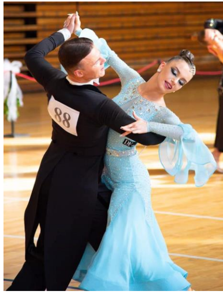
Slika 4. Sportski ples

uključuje natjecanja u standardnim plesovima poput engleskog valcera, tanga, brzog valcera, bečkog valcera i slowfoxa. Također, tu su natjecanja u latinskoameričkim plesovima poput sambe, cha-cha-chá, jivea, rumba i paso doblea. Također postoje natjecanja koja spajaju latino i standardne plesove zajedno. Osim toga, natjecanja obuhvaćaju i ples u formacijama, gdje grupe plesača izvode koreografije kao timovi (Bijelić, 2006).