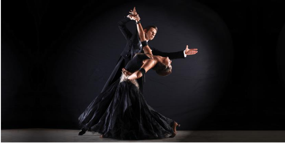
Slika 2. Društveni ples

društvene plesove. Oba plesa, bachata i kizomba , su nastala prošlog stoljeća i danas se plešu diljem svijeta u brojnim plesnim školama.