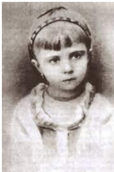
Fotografija broj 1. Ivana Mažuranić kao četverogodišnja djevojčica (1878.) 1

Treba spomenuti i njezin rodni Ogulin gdje je Ivana 1880. i 1886. godine dobila nadahnuće da napiše svoju prvu pjesmu koja se zove „Zvijezdi moje domovine”. Ivana je dva razreda polazila u djevojačkoj školi u Zagrebu, a ostale razrede školovala se u privatnoj školi na francuskom jeziku. Uz navedenu hrvatsku pjesmu koju je napisala, treba spomenuti i prve pjesničke pokušaje koje je pisala na francuskom jeziku, pjesme sentimentalnog-filozofskog sadržaja – „Le bonheur” i „Ma Croatie”. Osim francuskoga jezika, učila je ruski, njemački i engleski jezik te je na svim navedenim jezicima i čitala. Ona ističe slobodu koju je imala pri odabiru lektira što je kasnije utjecalo na njezinu slobodu prosuđivanja. Od važnijih događaja treba spomenuti Ivanino putovanje u Primorje gdje je u Novom Vinodolskom susrela najstarijega djedovoga brata Josipa, koji je u razgovoru s Ivanom izgovorio odlomak stare novljanske pjesme „O misecu travnju”, što je Ivana odmah zapisala u svoju bilježnicu. No, treba spomenuti i susret s očevim bratićem Franom Mažuranićem koji ju je motivirao da svoje doživljaje i razmišljanja počne pisati u Dnevnik te susret s djedom Ivanom Mažuranićem kad je umirao gdje je Ivana na koricama knjige zabilježila „Posljednje časove Ivana Mažuranića” (Zima, 2001: 14-17).