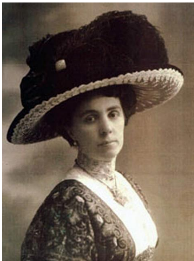
Fotografija broj 2. Ivana Brlić-Mažuranić , 1912. 2

Godine 1927. objavljuje zbirku dječjih stihova pod nazivom „Dječja čitanka o zdravlju”. Povodom predavanja koje je održala na Dan mira 11. studenoga 1929. godine, 1930. godine objavljuje „Mir u duši”. Nedugo nakon toga (1934.-1935.) objavljuje tri sveska sređene građe iz obiteljske arhive pod nazivom „Iz arhiva obitelji Brlić u Brodu na Savi”. Ivanin otac Vladimir Mažuranić umro je 1928. godine. Iste te godine „Priče iz davnine” prevedene su s engleskoga jezika na švedski i češki te objavljene u Stockholmu i Pragu. Prijevod iste sa švedskoga na danski jezik bio je 1929. godine te objavljen u dva sveska u Kopenhagenu (Zima, 2001: 25-27).