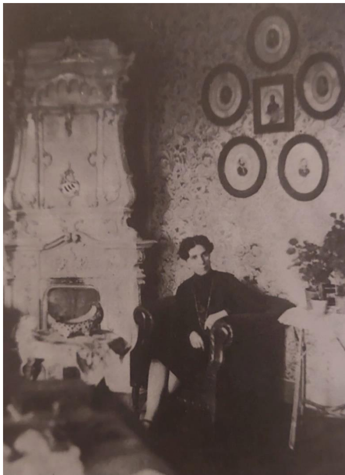
Fotografija broj 4. Ivana Brlić-Mažuranić kod kamina u obitelji Brlić godine 1929. 4

smatrala kao važan poticaj svake umjetnosti, a i zbog mitologije koja je bila motiv u „Pričama iz davnine” (Zima, 2001: 97-98).