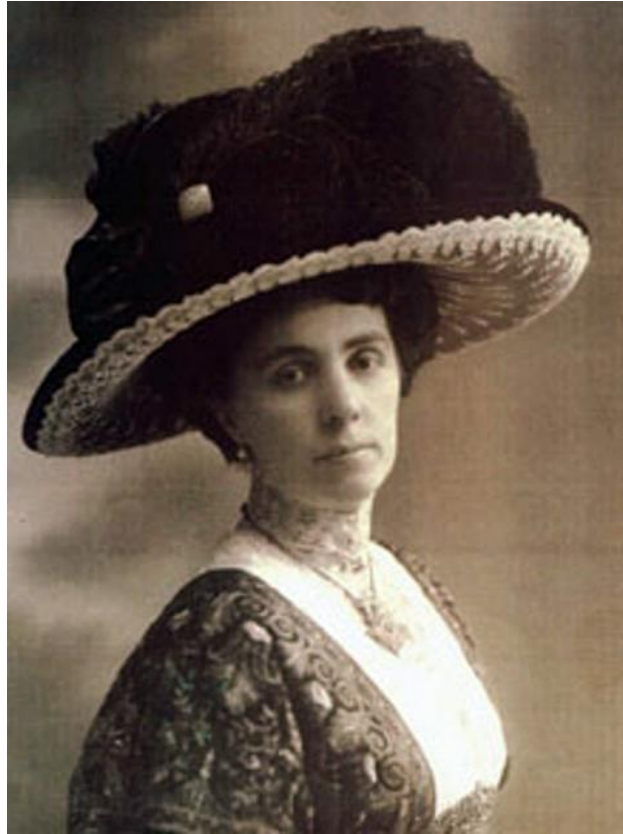
Fotografija broj 2. Ivana Brlić-Mažuranić , 1912. 2

Godine 1927. objavljuje zbirku dječjih stihova pod nazivom „Dječja čitanka o zdravlju”. Povodom predavanja koje je održala na Dan mira 11. studenoga 1929. godine, 1930. godine objavljuje „Mir u duši”. Nedugo nakon toga (1934.-1935.) objavljuje tri sveska sređene građe iz obiteljske arhive pod nazivom „Iz arhiva obitelji Brlić u Brodu na Savi”. Ivanin otac Vladimir Mažuranić umro je 1928. godine. Iste te godine „Priče iz davnine” prevedene su s engleskoga jezika na švedski i češki te objavljene u Stockholmu i Pragu. Prijevod iste sa švedskoga na danski jezik bio je 1929. godine te objavljen u dva sveska u Kopenhagenu (Zima, 2001: 25-27).