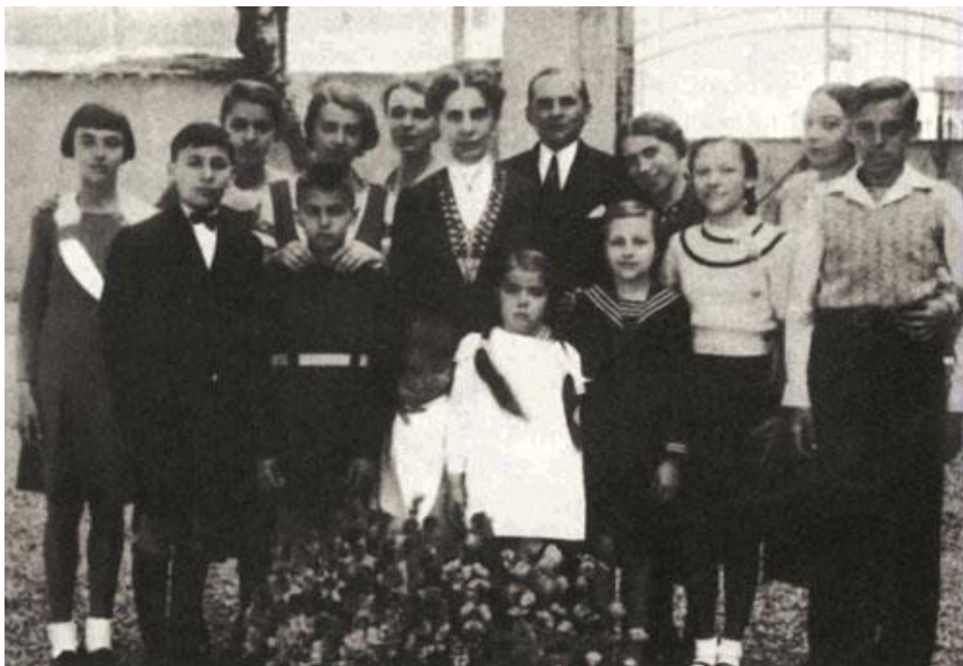
Fotografija broj 3. Ivana Brlić-Mažuranić okružena djecom i unučadi prilikom proslave 60-godišnjice njezina života. 3

Ivana je umrla 21. rujna 1938. godine u Gotlibovu sanatoriju na Srebrenjaku u Zagrebu te je pokopana u obiteljsku grobnicu na Mirogoju. Nakon Ivanine smrti objavljena je knjiga „Srce od licitara” (1938.), a 1943. godine objavljene su „Basne i bajke” koje su prije bile objavljivane u periodici te pronađene u rukopisnoj ostavštini. U njezinoj ostavštini nalazi se još jedan dio rukopisne građe koji nije objavljen kao i privatna korespondencija koja je djelomično proučena. Nakon njenoga velikoga književnoga uspjeha, njezina se djela prevode na većinu europskih jezika. Najnoviji prijevod romana „Čudnovate zgone šegrta Hlapića” objavljen je 1998. godine (Zima, 2001: 29-31).