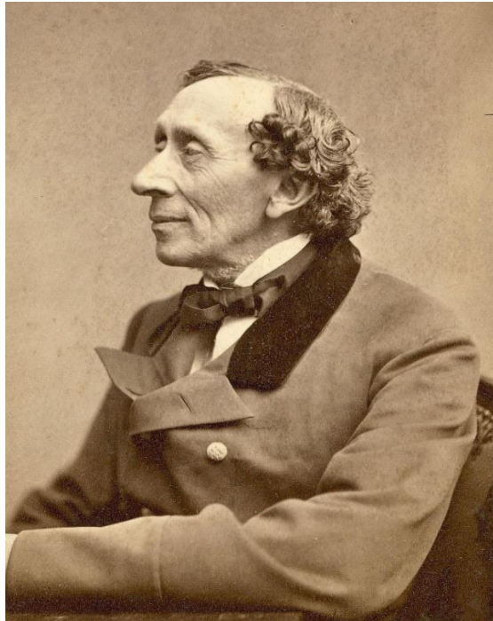
Fotografija broj 5. Hans Christian Andersen (1869.) 7

Portugal, Norvešku, Nizozemsku, Austriju i Italiju (Javor, 2005: 42). Putovanje u Italiju ostavilo je utisak na njegov književni opus (Crnković, 1967: 37).