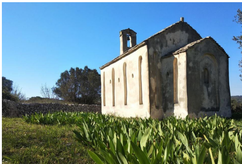
Slika 5: Crkva Sv. Kuzme i Damjana u Zablacu

https://volimteotoce.com/2019/03/26/malena-crkva-svetih-lijeznika-kuzme-i-damjana-koja-cuva-zavjetne-crteze/