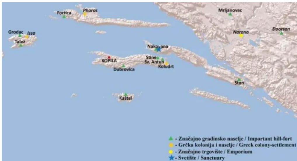
Slika 1: Srednji Jadran u protopovijesti/helenizmu (izradio: I. Borzić)