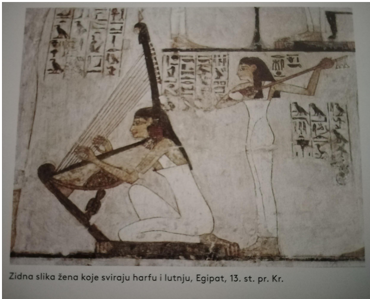
Slika 1. Žene sviraju harfu i lutnju