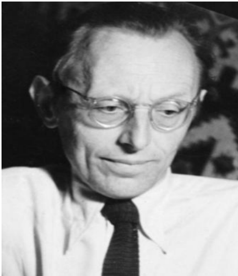
Slika 3. Karl Orff

Blok flauta se svira upuhivanjem zraka, dok se prsti pomiču po pravilno raspoređenim rupama na drvu cjevastog oblika ( https://orfovinstrumentarij.blogspot.com ., Hrvatska Enciklopedija, 2021).