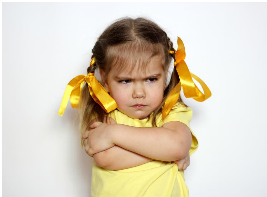
Slika 1. Facijalna ekspresija i položaj tijela koji ukazuju na emociju ljutnje kod djeteta

Sedam je temeljnih emocija, koje se ne razlikuju od kulture do kulture i svakom su čovjeku urođene, a to su: gađenje, strah, radost (sreća), gnjev (ljutnja), tuga, iznenađenje i prijezir. Od njih se razvijaju sve ostale emocije (Slunjski, 2014).