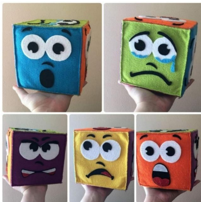
Slika 6. Kocka emocija

Posljednja strategija uključuje korištenje linija i oblika koji predstavljaju osjećaje. Djeca crtaju linije i oblike koji prikazuju kako se osjećaju tijekom čitanja priče. Ove strategije su korisne za djecu u dobi od 3 do 8 godina i pomažu im da razviju vještine razumijevanja, vokabulara i izražavanja emocija. Korištenje ovih strategija i aktivnosti može biti korisno za podršku socijalno-emocionalnoj pismenosti kod djece. Osim što razvijaju jezične vještine, ove aktivnosti također pružaju priliku za otvorenu raspravu o emocijama i potiču razumijevanje i upravljanje emocijama kod djece (Harper, 2016).