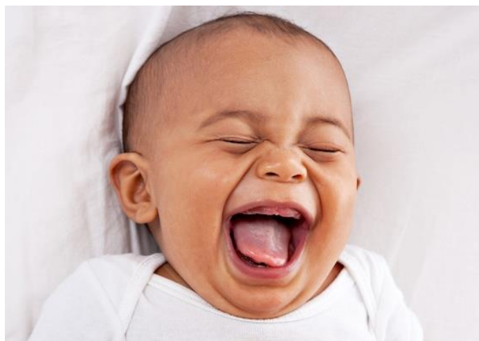
Slika 2. Facijalna ekspresija koja ukazuje na emociju radosti kod djeteta