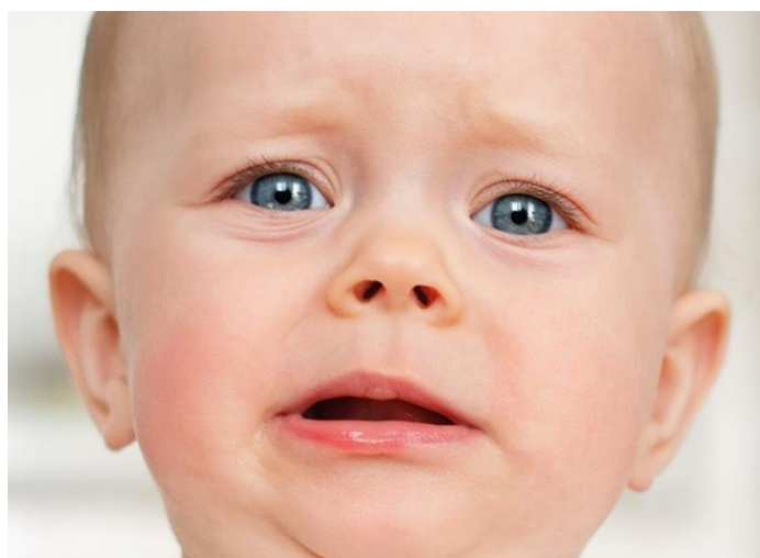
Slika 4. Facijalna ekspresija koja ukazuje na emociju straha kod djeteta