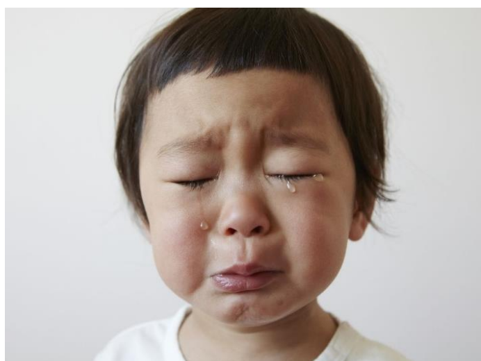
Slika 3. Facijalna ekspresija koja ukazuje na emociju tuge kod djeteta