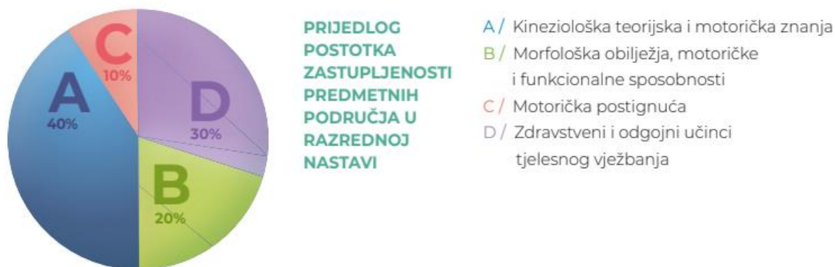
Slika 3: Prijedlog postotka zastupljenosti predmetnih područja u razrednoj nastavi 4

Nakon posljednje tablice pojedinog obrazovnog razdoblja, dakle nakon tablice za 4. i 8. razred osnovne te 4. razred srednje škole nalazi se grafički prikaz u kojem je predložena raspodjela predmetnih područja za to razdoblje (Slika 3.)