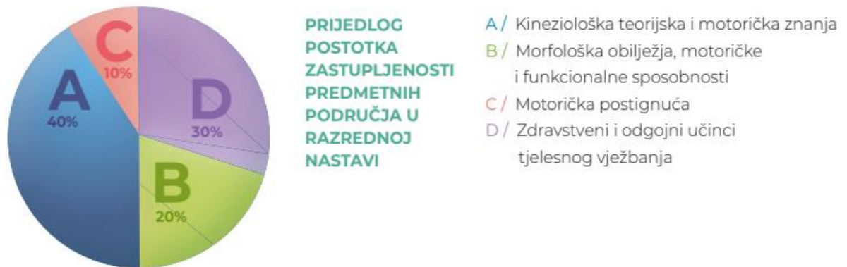
Slika 3: Prijedlog postotka zastupljenosti predmetnih područja u razrednoj nastavi 4

Nakon posljednje tablice pojedinog obrazovnog razdoblja, dakle nakon tablice za 4. i 8. razred osnovne te 4. razred srednje škole nalazi se grafički prikaz u kojem je predložena raspodjela predmetnih područja za to razdoblje (Slika 3.)