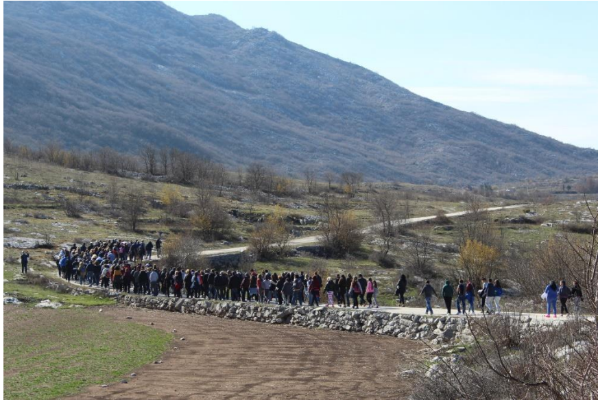
Slika 1: Križni put na Veliki Petak u vrgorskim župama

Župa Navještenja Blažene Djevice Marije u Vrgorcu je postavila video na svom YouTube kanalu koji je snimljen tijekom emisije Radija Biokovo iz 2006. godine, a u emisiji se slušalo izvođenje Gospinog plača u Vrgorcu. Fra Toma Babić i fra Petar Knežević su izveli taj spjev jer su osjećali potrebu da na najrazumljiviji način prenesu evanđeosku poruku o Isusovoj patnji, smrti, uskrsnuću i boli njegove majke Blažene Djevice Marije nepismenim ljudima. No, župnik također napominje da je u Vrgorcu postojao drugi način izvođenja Gospinog plača, koji je temeljen na djelu fra Tome Babića i u lokalnoj župi se zvao "buninsko pivanje" ili "kantanje". Stariji stanovnici Vrgorca bi tijekom korizme često pjevali Muku Isusovu dok su radili na polju. Ova tradicija obično bi se odvijala kad bi se sreli dvojica muškaraca koji bi zajedno izvodili dvostih iz ovog spjeva. 65