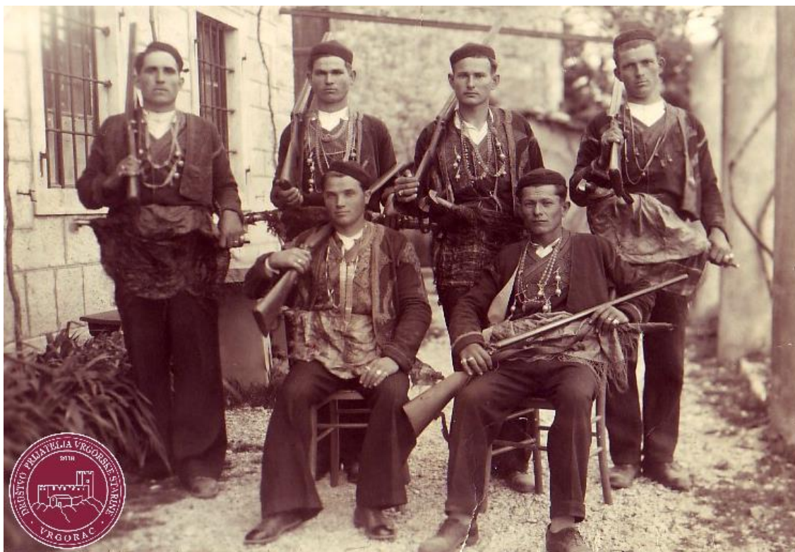
Slika 2: Rondari Župe Navještenja Blažene Djevice Marije (Vrgorac)