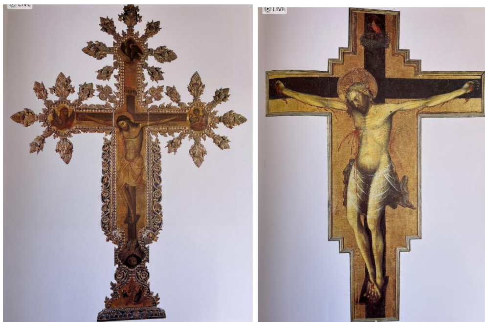
Slika 23 Kretski slikar, malo raspelo, oko 1400. godine, drvo, tempera Slika 24 Blaž Trogiraniin, raspelo, oko 1412. godine, drvo, tempera (Izvor : Gamulin Grgo : Slikana raspela u Hrvatskoj, Grafički zavod Hrvatske, Zagreb 1983.)

Isti problem nepoznavanja autora prisutan je i kod dva korčulanska italokretska raspela koja su prenesena iz Kandije 1668. godine. Zapravo se radi o primjeru kretske varijante mletačkog tipa 14. stoljeća, odnosno o derivaciji tipa koje je stvorio majstor Paolo. Veliko raspelo iz Svih Svetih je nešto cjelovitije umjetničko djelo, ali je do nas došlo samo kao torzo. Krist je prikazan sa dugom ovojnicom oko bedara i obogaćen zlatnim okvirom. U crkvi sv. Kuzme i Damjana benediktinskog samostana na Čokovcu kod Tkona ispod trijumfalnog luka visi raspelo koje je bitan korak u razvoju slikarstva kasne gotike. 53 U obliku dva korčulanska raspela je vidljiv venecijanski utjecaj te je ono većih dimenzija izrađeno kvalitetnije. Lik Krista na manjem raspelu je slabiji i manje dramatičan od onog na većem raspelu. Ova dva raspela su preteče italokretske škole te su jedina svoje vrste. 54