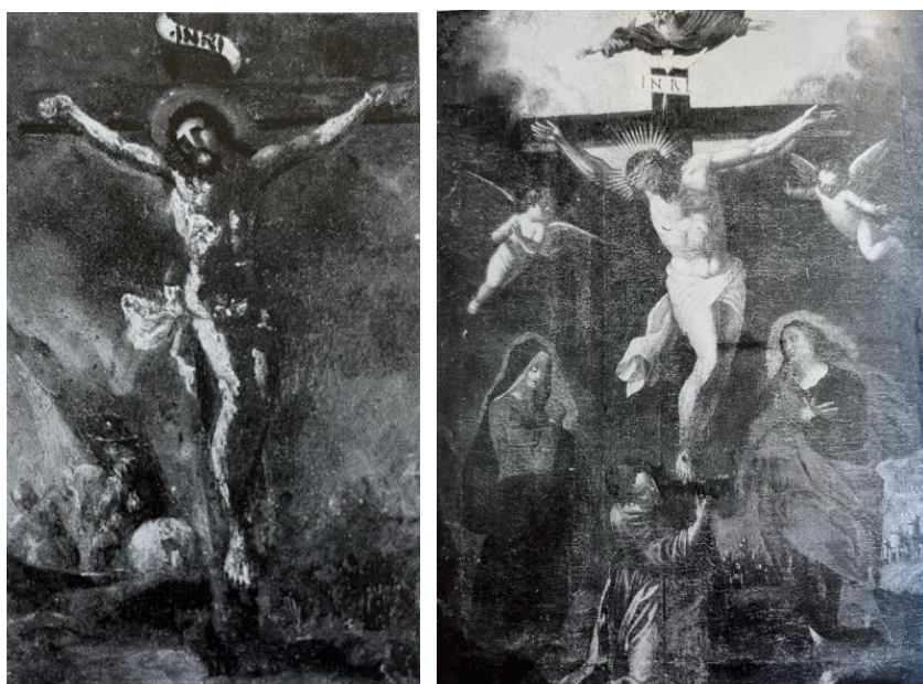
Slika 16 Raspelo u benediktinskom samostanu i crkvi sv. Nikole u Trogiru Slika 17 Raspelo iz privatne zbirke (Radoslav, Tomić. "Trogirska slikarska baština od 15-20. stoljeća". Zagreb-Split: Matica Hrvarska, Ministarstvo kulture Republike Hrvatske konzervatorski odjel, 1997.)s

malog formata nepoznatog autora. Slika je rađena kao skica, mrljastim i isprekidanim potezima. Kristova glava je preslikana, a iza njega se naslućuju dva konjanika. Kristova fizionomija upućuje na slikarstvo G.B. Piazzette. U privatnog zbirki trogirске slikarske baštine se nalazi Raspeće iz 17. stoljeća čiji je autor također nepoznat. Krist je prikazan savijenog tijela i nagnute glave sa aureolom i trnovom krunom. Oko njega se nalaze Bogorodica i sv. Ivan te Marija Magdalena koja kleči i grli križ. Iznad križa se nalazi Bog otac i Duh Sveti, a sa strane lete dva anđela. U dnu slike se naziru zidine grada. 36