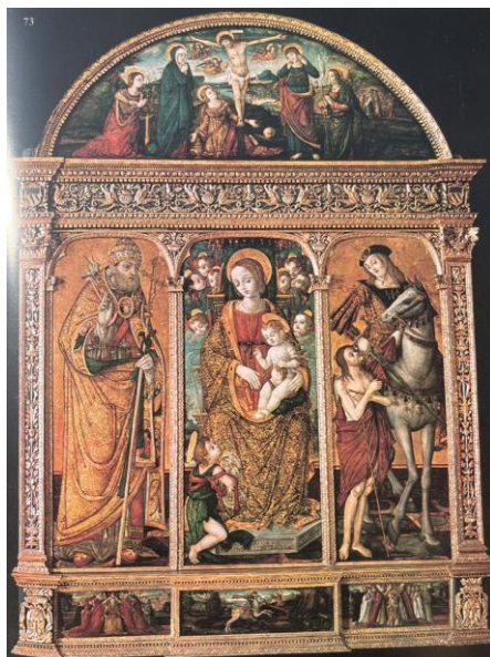
Slika 10 Nikola Božidarević, Poliptih iz crkve Gospe na Dančama u Dubrovniku ( Prijatelj, Kruno. "Dalmatinsko slikarstvo 15. i 16. stoljeća". Zagreb : Udruženi izdavači, 1983.)