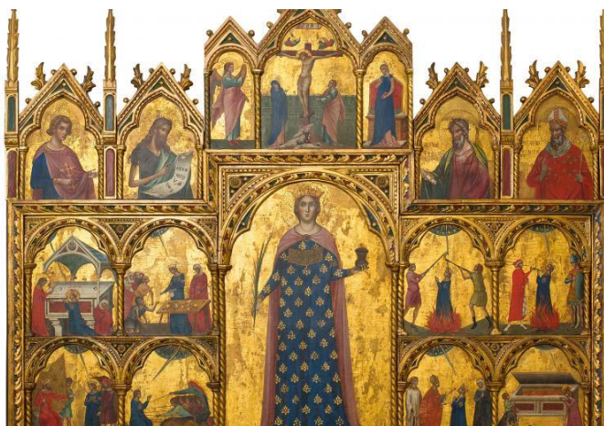
Slika 1 Poliptih sv. Lucije u Biskupiji u muzejskoj zbirci crkve sv. Kvirina ( https://www.info-krk.com/images/cache/culture/19c2063f006e8597b069e4da26cd5ff6.jpg .)

Prikaze Kristove smrti na križu možemo razlikovati od onih s brojnim sudionicima s prikazom Gospe u nesvijesti, do nešto jednostavnih prikaza na kojima su prikazani Krist, Marija i Ivan Evanđelist te onih na kojima je samo prikazan Krist. U srednjem vijeku veliku pozornost se posvećuje prikazivanju Kristove i Marijine muke. Pojmovi humanitas - čovječanstvo i humilitas - poniznost se ističu te ih se nastoji što vjernije prikazati. U renesansi se na prikazima također pozornost pridodaje i realističnom prikazivanju krajolika. Takav prikaz se nalazi na poliptihu na Dančama Nikole Božidarevića. U luneti triptiha je smješten prikaz Golgote. Grad koji se proteže iznad njih podsjeća upravo na Dubrovnik. 14