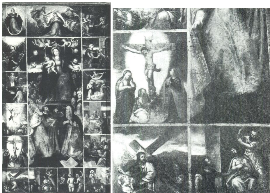
Slika 12 Pala Gospe od Ružarija, Trogir, dominikanska crkva Slika 13 Detalj pale Gospe od Ružarija (Prijatelj, Kruno. "Trogirske slikarske teme." Prilozi povijesti umjetnosti u Dalmaciji 23, br. 1 (1983): 253-274. str. 253-264)

Pala Gospe od Ružarija se nalazi u trogirskoj dominikanskoj crkvi. Sliku je Kruno Prijatelj pripisao Giovanniju Battisti Argentiju na temelju usporedbe s njegovom potpisanom palom u čiovskoj crkvi sv. Petra, a nastala je 1601. godine. U srednjem polju je naslikana Gospa od Ružarija na prijestolju s Djetetom i krunicom. Ispod prijestolja su sv. Dominik, sv. Katarina Sijenska te papa Pio V s tijarom na glavi. Iza njih se nalazi skupina likova koji su povezani s bitkom kod Lepanta. Oko središnje slike su smješteni prikazi petnaest Otajstava od kojih je prikazan i Krist na križu. Krist je u sredini, a s lijeve i desne strane se nalaze Bogorodica i sv. Ivan. Također je prikazan i treći lik koji kleči i grli križ. To je lik Marije Magdalene. Bogorodica drži jednu ruku na licu u znak boli, a sv. Ivan drži sklopljene ruke te gleda prema Kristu. Krist je prikazan izmučen i nagnute glave. Slikar mnogo bolje izrađuje male slike nego velike likove. 33