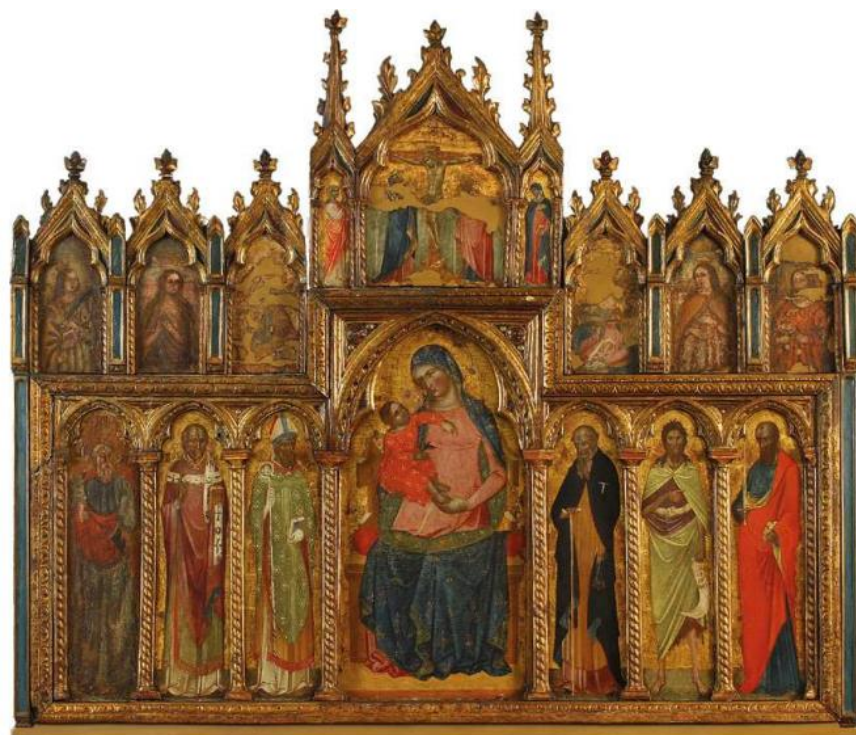
Slika 4 Ivan Ugrinović, Poliptih u crkvi Sv. Antuna na otoku Koločepu (Prijatelj, Kruno. "Dalmatinsko slikarstvo 15. i 16. stoljeća". Zagreb : Udruženi izdavači, 1983.)

U crkvi sv. Antuna na otoku Koločepu se nalazi poliptih s prikazom Bogorodice sa svecima. Poliptih je Lisičar prepisao Ivanu Ugrinoviću te se datira u 1434. godinu. Na središnjem polju je prikazana Bogorodica s malim Isusom u naručju. U donjem redu se nalazi šest figura svetaca od kojih je sv. Petar preslikan. U gornjem redu je bilo naslikano šest figura, ali su sačuvana samo dva fragmenta. U sredini gornjeg niza je prikaz Golgote. S lijeve i desne strane Raspeća se nalaze Bogorodica i sv. Gabrijela. Sam prikaz Raspeća je sličan onom na poliptihu sv. Lucije, a glave Bogorodice i sv. Ivana kraj Krista su značajno oštećene. 20