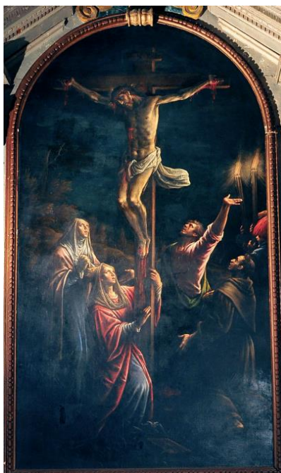
Slika 11 Leandro Bassano, Raspeće, franjevački samostan Gospe od milosti - Hvar Žic, Igor. " Crkveno slikarstvo na otoku Krku od 1300. do 1800. godine". Rijeka : Glosa, 2006., Bibić, Zorka. "Oltarna pala Gospe od Ružarija u Vrboskoj i ostala djela slikarske obitelji Bassano na otoku Hvaru." Prilozi povijesti otoka Hvara XII, br. 1 (2014): 193-215.)