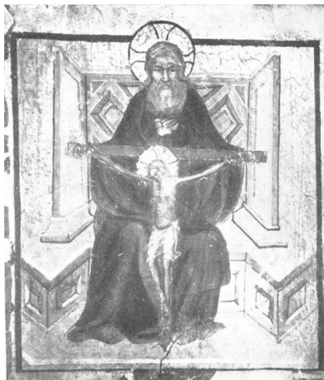
Slika 8 Blaž Jurjev Trogirarin, Minijatura u Matrikuli bratovštine Svih svetih u Trogiru, Muzej Sakralne umjetnosti, Trogir (Priatelj, Kruno : „Slikar Blaž Jurjev“. Zagreb: Društvo historičara umjetnosti Hrvatske, 1965.)

Najstarije djelo Blaža Jurjeva Trogirana nakon povratka iz Mletačke Republike su minijature na matrikuli trogirске bratovštine sv. Duha. Nastale su nakon 1428. godine, što se vidi iz oštećene godine ispisane ispod minijature. Na lijevoj minijaturi su prikazani bratimi koji kleče noseći zastavu s lavom sv. Marka, a na desnoj je prikazan Bog Otac na prijestolju koji drži križ na kojem je obješen Krist. Ovaj primjer spada pod alegorijski tip raspeća u kojem je prikazano Presveto Trojstvo. Bog Otac je prikazan s naglašenim obrvama i bademastim očima s izbočenim zjenicama. Sličan je s mnogim drugim Blaževim staračkim likovima. Oba lika su naglašena aureolom sa upisanim križem. 26