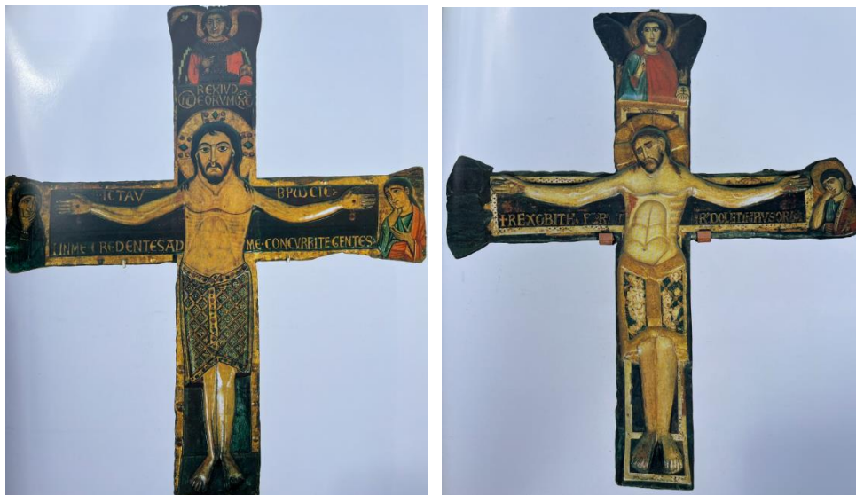
Slika 18 Raspelo Franjevaca u crkvi sv. Frane u Zadru, oko polovine XII. Stoljeća, drvo, tempera Slika 19 Raspelo u crkvi sv. Mihovila u Zadru, oko 1200. godine, drvo, tempera na platnenoj podlozi (Izvor : Gamulin Grgo. "Slikana raspela u Hrvatskoj". Zagreb : Grafički zavod Hrvatske, 1983..)

Raspelo se nalazilo na oltaru ili u sredini glavne lađe. Za sjevernu Italiju je bilo karakteristično postaviti raspelo u trijumfalni luk ili u apsidi, iako ih je malo do danas sačuvano. 37 Zbog neistraženosti radova i velikih praznina i gubitaka što ih je vrijeme prouzročilo nisu dostupni potrebni podaci na temelju kojih bi mogli vidjeti stvarni doprinos radionica u gradovima istočne obale Jadrana. 38 Do danas je sačuvano 17 slikanih raspela koji obuhvaćaju raspon od 12. do 15. stoljeća. Vrhunac razvoja se događa s Blažom Jurjem Trogiranimom. Raspelo koje je do danas ostalo sačuvano na svom izvornom mjestu u trijumfalnom luku je raspelo s Bogorodicom i Ivanom u crkvi „bijelih fratara“ u Dubrovniku koje datira iz 1358. godine. 39