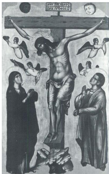
Slika 7 Krist na križu između Bogorodice i sv. Ivana evanđeliste, Split. Srpsko- - pravoslavna crkva (Priatelj, Kruno. "Neobjelodanjena slika iz kruga Paola Veneziana u Splitu." Prilozi povijesti umjetnosti u Dalmaciji 26, br. 1 (1986): 99-117)

U Splitu u stanu obitelji Urukalo se nalazila slika "Krist na križu između Bogorodice i sv. Ivana Evanđeliste" koja je danas donirana u Srpsko-pravoslavnu crkvu u Splitu. Nastala je u drugoj četvrtini 14. stoljeća. Slikana je temperom na drvu te je dimenzija 112 x 65 cm. U središtu je lik Krista na križu duge kose i zatvorenih očiju prikazan glave nagnute na jednu stranu. Njegovo mrtvo tijelo je zelenkaste boje, a prsti razapetih ruku su mu stisnuti. Ispod desne grudi je naslikana rana iz koje curi krv. Oko bokova je polu prozirna bijela perizoma. Ispod križa je Adamova lubanja, a tri anđela sakupljaju krv u posude s tri Isusove rane. Četvrti anđeo je prikazan sklopljenih ruku. Na vrhu križa se nalazi natpis "IESV-NACARENU/ REX. IVDEORU" kojem su s lijeve i desne strane glave Sunca i Mjeseca. Sunce i Mjesec se također pojavljuju na prikazu Skidanja s križa na Buvinim vratnicama u splitskoj katedrali. Oni najčešće označavaju prikaz Starog i Novog zavjeta ili pomrčinu Sunca u trenutku Isusove smrti. Lijevo od Krista je Bogorodica skupljenih ruku odjevena u zelenu haljinu sa ljubičastim plaštem. Ističe se gornja usta koja je bitno veća od donje. Desno je mladi lik sv. Ivana Evanđeliste odjeven u zelenu haljinu sa crvenim plaštem. Danas zlatna pozadina je prvotno bila sivoplave boje. 22