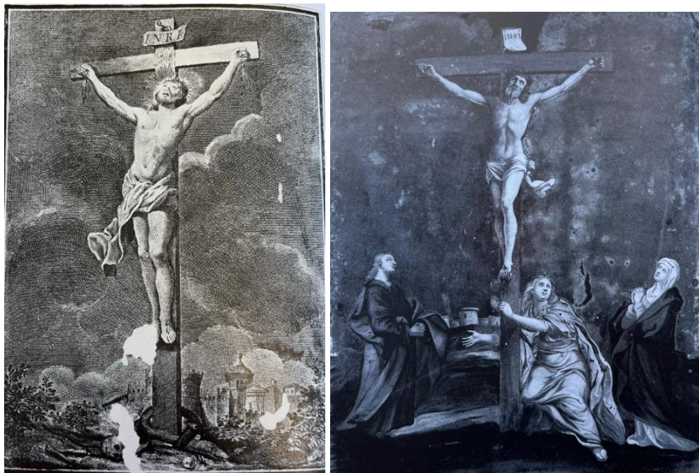
Slika 14 Antonio Baratti, Raspeti Krist u crkvi sv. Petra Slika 15 Nepoznati mletački slikar, Raspeće iz zbirke dominikanskog samostana u Trogiru (Radoslav, Tomić. "Trogirska slikarska baština od 15-20. stoljeća". Zagreb-Split: Matica Hrvarska, Ministarstvo kulture Republike Hrvatske konzervatorski odjel, 1997)

U crkvi sv. Petra u Trogiru su pronađena tri bakropisa na kojima se nalazi prikaz raspetog Krista. Bila su postavljena na bočnim stranama dviju drvenih propovjedaonica. Sačuvan je samo jedan te je uspješno restauriran. Križ se nalazi ispred oblačnog neba, a u donjem desnom kutu se nazire grad. Krist gleda prema nebu, otvorenih usta sa aureolom oko glave. Oko pojasa mu se nalazi perizoma kojeg vjetar nosi u lijevu stranu. Ispod prikaza je potpis Antonia Barattia te natpis sa 1778. godinom. 34