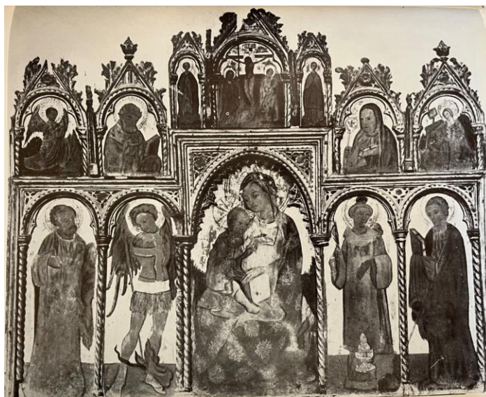
Slika 9 Poliptih Blaža Jurjeva u biskupskoj kapeli u Šibeniku (Prijatelj, Kruno : „Slikar Blaž Jurjev“. Zagreb: Društvo historičara umjetnosti Hrvatske, 1965.)

Poliptih iz šibenske crkvice sv. Antuna, koji je bio premješten u umjetničku zbirku u crkvi sv. Barbare, danas se čuva u kapeli šibenske biskupske palače. Ovaj poliptih je u vrlo lošem stanju te nedostaje velika većina njegovih dijelova. Sačuvan je samo donji dio sa središnjim likom Bogorodice s Djetetom. Na bočnim poljima su likovi sv. Petra, sv. Mihovila, sv. Stjepana i sv. Jakova. Sačuvana je nedatirana fotografija koju je objavio Ljubo Karaman 1933. godine na kojoj se vidi originalno stanje poliptiha koji je imao i gornje polje. 27 Na sredini gornjeg dijela se nalazio Krist na križu oko kojeg su Bogorodica i sv. Ivan. S lijeve i desne strane su prikazana dva uspravna sveca, a do njih dva sveca do poprsja. Uz njih se nalazi Bogorodica i anđeo iz navještenja. Gornji red sa danas sačuvanim dijelom poliptiha tvori jedinstvenu kompoziciju. Likovi su prikazani na zlatnoj pozadini, a na prikazu Golgote i Navještenja se nazire pejzaž u pozadini. Bogorodica i sveci su prikazani s naglašenim očima i podbratkom te izdubljenim prstima što je karakteristično za Blaža Trogiranina. Pretpostavlja se da je autor poliptiha bio njegov učenik. 28