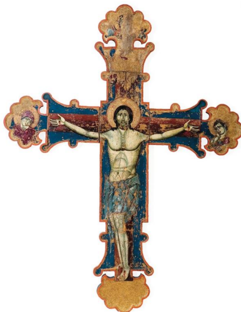
Slika 21 Raspelo sv. Andrije na Čiovu nakon restauracije

može utvrditi što. Sva tri lika imaju aureolu istih dimenzija. Dimenzije raspela su 208,6 x 161,8 x 4,2 cm. 48