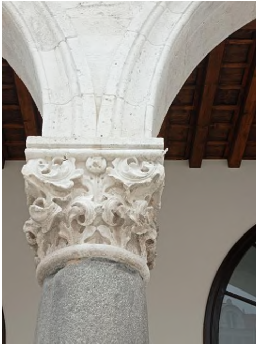
Slika 9 Bonino da Milano, kapitel lože gradske vijećnice na Narodnom trgu u Splitu