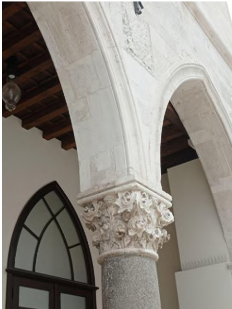
Slika 10 Bonino da Milano, kapitel lože gradske vijećnice na Narodnom trgu u Splitu