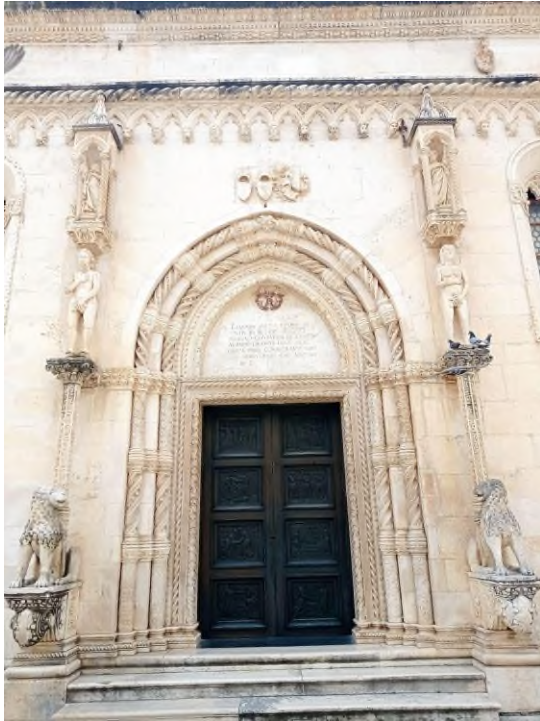
Slika 13 "Lavlji portal", katedrala sv. Jakova u Šibeniku