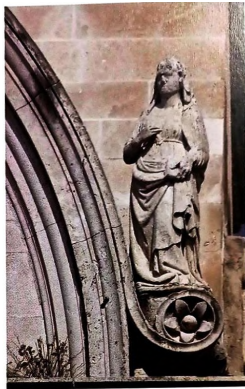
Slika 12 Bonino da Milano, Marija Navještenja, katedrala sv. Jakova u Šibeniku