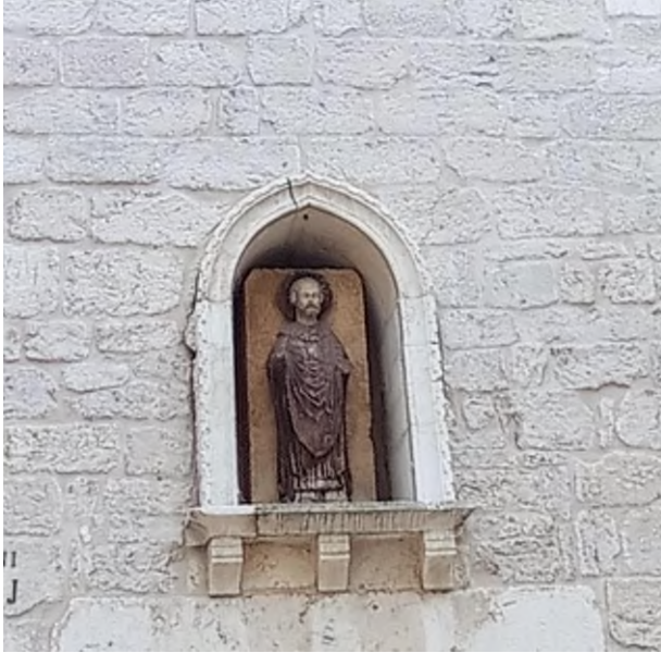
Slika 18 Bonino da Milano, reljef sv. Nikole na crkvi sv. Barbare u Šibeniku