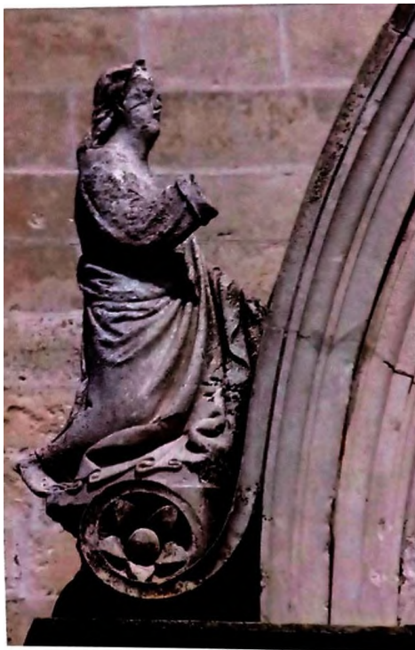
Slika 11 Bonino da Milano, Anđeo navještenja, katedrala sv. Jakova u Šibeniku

skulptura Navještenja pomaže i kod pitanja Boninovog projekta prve katedrale. S obzirom na njihovu veličinu, skulpture su očito bile predviđene na vrhu, odnosno na krajevima glavnog pročelje prve gotičke crkve. 41 Prema rekonstrukciji prve gotičke crkve koju je predvidio Johann Graus, skulpture bi se trebale nalaziti unutar baldahinskih tornjića. Takvo rješenje je bilo tipično u čitavoj sjevernoj Italiji, posebice u Veneciji. Također lik Arkandela izrađen je bez krila jer bi mu ona inače smetala u slučaju smještaja unutar tabernakula. Zbog toga se zaključuje da Bonino nije imao samo kiparsko-dekorativnu ulogu za izradu portala, već je trebao predvidjeti čitav izgled i dimenzije glavnog pročelja katedrale, a samim time izgled buduće katedrale u cjelini. Iz ovih činjenica ustvari proizlazi da imenovani primus magister Bonino da Milano je bio projektant prve faze izgradnje katedrale sv. Jakova. Iako nije mogao biti voditelj gradnje, njegova ideja je zaživjela u gradnji katedrale. 42