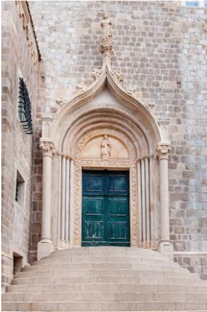
Slika 3 Bonino da Milano, južni portal crkve sv. Dominika u Dubrovniku

francuskog leksika odnosno iz francusko-anžuvinske gotike koja se raširila i kasnije udomaćila u Italiji. Na vrhu se nalazi podanak za postavljanje kipa u obliku bokora akantnih listova. Na njemu se nalazi i velika skulptura Stvoritelja koji blagoslivlja. Prije potresa 1667. godine su se sa strana na jakim stupovima dva manja nestala pobočna kipa. 15