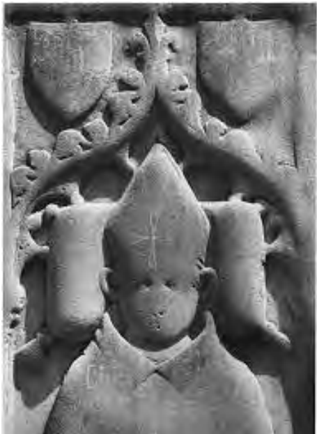
Slika 7 Bonino da Milano, nadgrobna ploča nadbiskupa Petra Diškovića