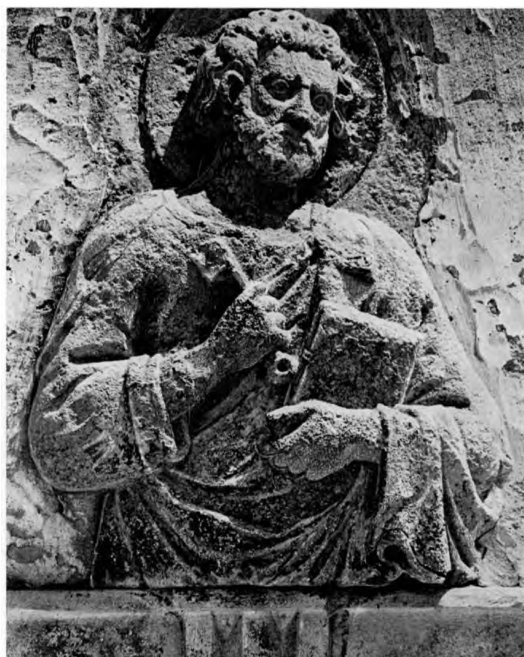
Slika 2 Bonino da Milano, reljef sv. Petra na crkvi sv. Petra u Korčuli