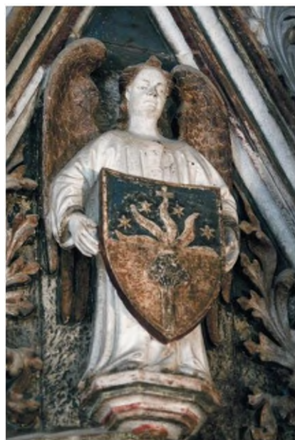
Slika 6 Bonino da Milano, anđeo s grbom Petra Diškovića na ciboriju kapele sv. Dujma