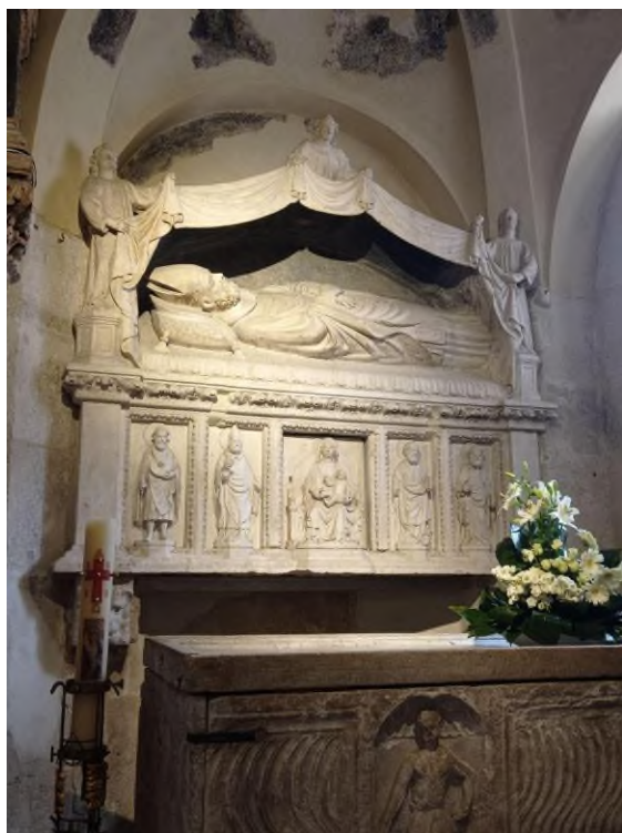
Slika 5 Bonino da Milano, sarkofag sv. Dujma u splitskoj katedrali