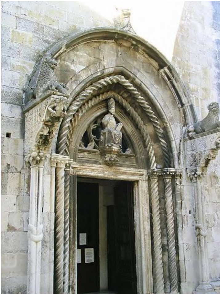
Slika 1 Bonino da Milano, portal katedrale sv. Marka u Korčuli

DIVOQUE MARCO EVANGELISTAE SACRUM)”. 8 Šiljasta luneta ispunjena je tranzenom sa prošupljenim križem koji ima oblik djetelina lista. Uz njega se savijaju dva otvora u obliku ribljeg mjehura. Pred lunetom, na lisnatoj konzoli postavljen je kip zaštitnika crkve sv. Marka. Lik sveca prikazan je u biskupskom orantu na sjedalici prekrivenoj jastukom. Desnom rukom čini gestu blagoslova, a u lijevoj ruci drži knjigu. Naime ruke i knjiga su kasnije nadomještene drvenom imitacijom. 9