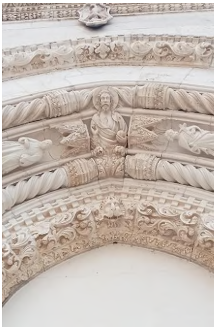
Slika 16 lik Krista Pantokratora na arhivoltu portala "Posljednjeg suda"