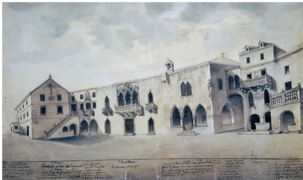
Slika 8 Komunalna i kneževa palača na Trgu sv. Lovre u Splitu prije rušenja, Vicko Andrić

splitskog Kneževog dvora kasnije se mijenjao. Polovicom 19. stoljeća rušile su se zgrade dvora, a trg je proširen na zapad. Kneževa loža je pregrađena u neogotičkom stilu. Vicko Andrić je prije rušenja dokumentirao izgled Kneževog dvora. 34