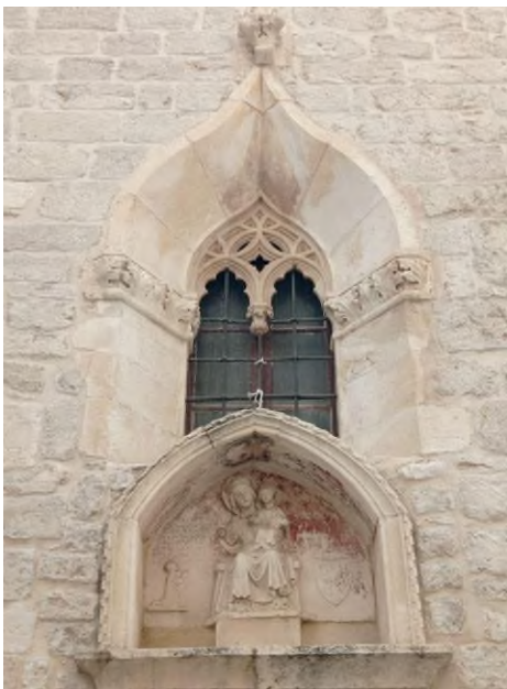
Slika 17 Bonino da Milano, prozor crkve sv. Barbare u Šibeniku

Kao što sam spomenula u prethodnom poglavlju, katedrala sv. Jakova nije bila jedini rad Bonina da Milana. On je također radio pri izgradnji crkve sv. Nikole i Benedikta, odnosno današnje crkve sv. Barbare. 49 Boninu je naposljetku bio pripisan samo jedan prozor na sjevernoj strani crkve koji se nalazi iznad jednog starog reljefa, a kasnije je u njegov opus dodan i reljef sv. Nikole koji se nalazi u luneti na zapadnoj strani crkve. Prozor na crkvi sv. Barbare je mali skulptorski rad, no predstavlja zanimljive dekorativne motive koje je majstor poznavao. Mrežište prozora ima vrlo kompliciranu strukturu, što nam svjedoči da je Bonino poznavao kasno-gotičke dekorativne motive “sjevernjačkog” karaktera, koji se javljaju isto i na katedrali u Milanu. Kod reljefa sv. Nikole primjećuje se tipično Boninovo oblikovanje svetačkog lica sa istaknutim lukovima obrva, izbočenim jagodicama i karakterističnu izradu kose, brade, brkova i odjeće. Prema ovim vidljivim karakteristikama na reljefu, bez problema bi ga mogli uvrstiti u Boninov opus, pa čak i među njegovim boljim radovima. 50