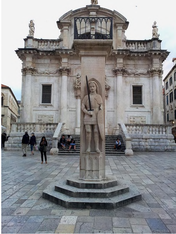
Slika 4 Bonino da Milano, Orlandov stup u Dubrovniku