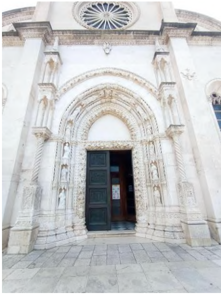
Slika 15 portal "Posljednjeg suda", katedrala sv. Jakova u Šibeniku