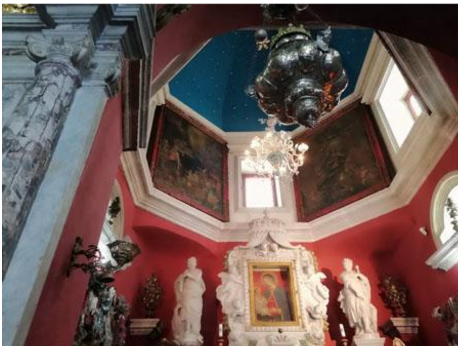
Slika 6. Unutrašnjost svetišta

Kako bi se izložila Gospina slika koju su Peraštani smatrali svetinjom, godine 1718. prokurator svetišta, kapetan Nikola Burović naručio je novi mramorni oltar u Veneciji. Oltar je posredovanjem opata Antona Zambelle završen 1720.godine. Na antependiju piše: Unanimi voto