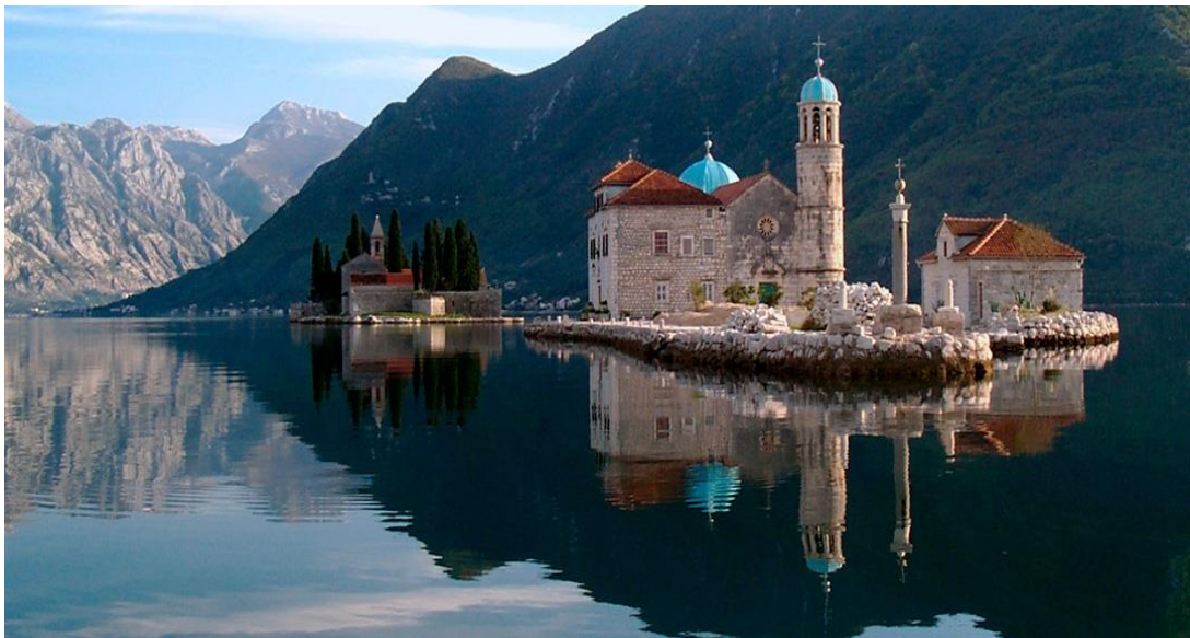
Slika 1. Otočić Gospe od Škrpjela

Gospinu sliku koja se u literaturi pripisuje slikaru Lovri Marinovu Dobričeviću, Peraštani su izložili na oltaru sagrađene crkve. Na dan 22. srpnja svake godine, u drevnom i jednostavnom procesijskom obredu, u sumrak, sve barke iz Perasta, povezane jedna za drugu i ispunjene kamenjem ,ceremonijalnim ophodom duž obale, uz pjevanje narodnih pjesama i napjeva, kreću prema otoku Gospe od Škrpjela kako bi oko njega nasipali kamenje. Sadašnji izgled, jednobrodna crkva sa zvonikom, datira iz 1628.-1629. godine. Stradala je u potresu 1667. god. Slijede desetljeća obnove i umjetničkog opremanja gdje važnu ulogu imaju slikar Tripo Kokolja i nadbiskup Andrija Zmajević koji je osmislio ikonografski program vezan uz Bogorodicu. 17