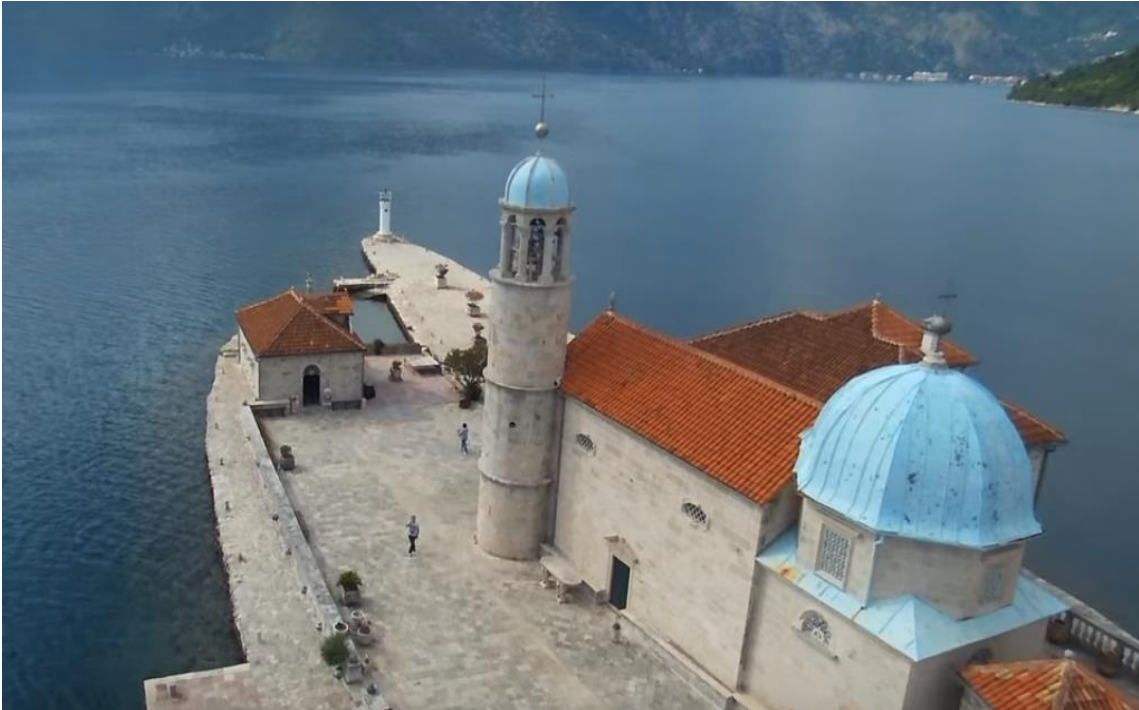
Slika 3. Kupola nad žrtvenikom

Na vrhu je pozlaćen grčki križ. Četverokutna osnova kupole ima tri prozora u stilu renesanse. 20