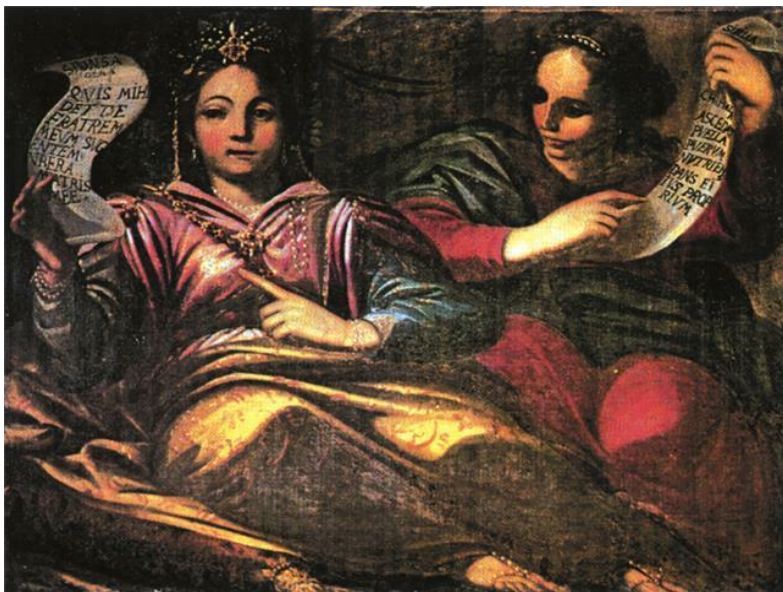
Slika 16. Zaručnica iz Pjesme nad pjesmama i kumejska sibila