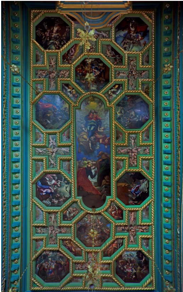
Slika 20. Strop crkve

Stil barokne likovne vizije s njezinom patetikom i elastičnošću dolazi do izražaja u prizorima na stropu koji su najspontaniji u izvedbi s duhovito riješenim igrama svjetla i sjene. Neki od takvih prizora su Navještenje, Vizitacija i Bijeg u Egipat te likovi crkvenih otaca i skupine ljupkih anđelčića. Tu je i mrtva priroda sa spomenutim košarama s cvijećem koje predstavljaju prve samostalne mrtve prirode u baroku na našim obalama. Taj motiv Kokolja kasnije ponavlja. U jednom od polja stropa Kokolja je naslikao i grb Perasta. 87