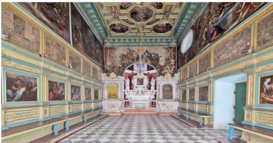
Slika 5. Unutrašnjost svetišta

slikama i uređenjem prezbitarija. Kupola je iznutra skladno spojena zavojnicama sa svojom kvadratnom podlogom. 28