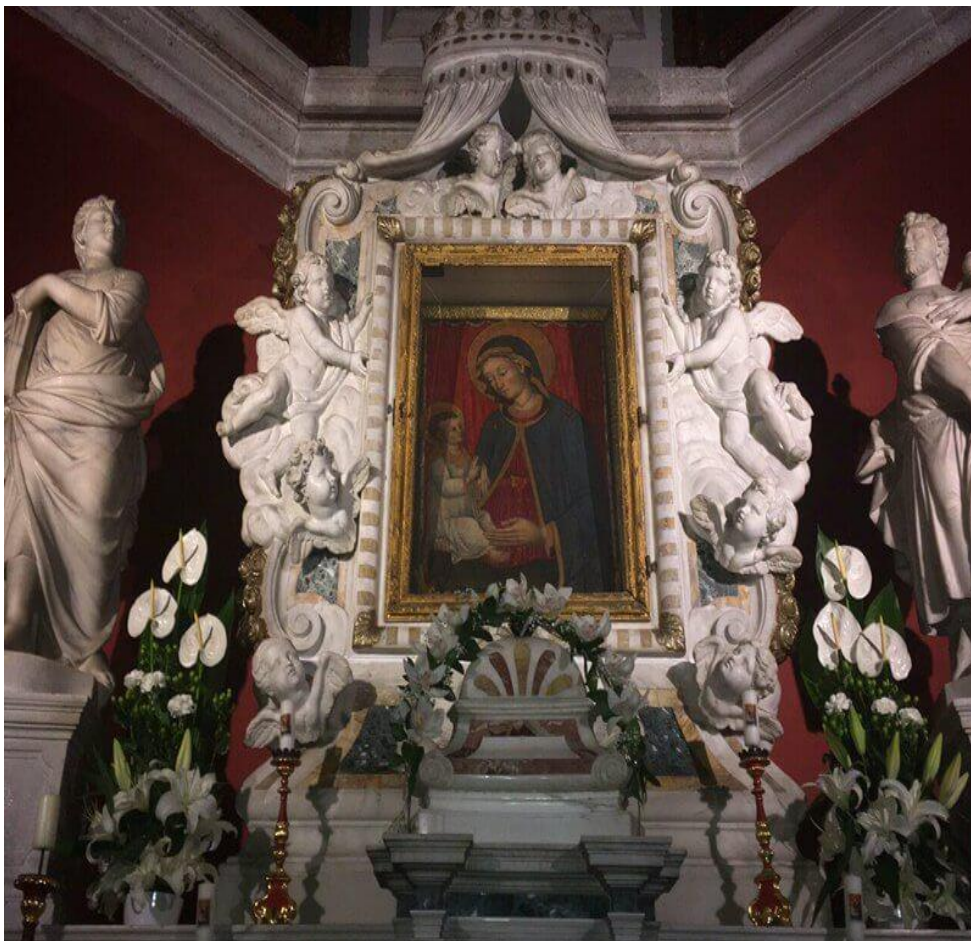
Slika 8. Gornji dio glavnog oltara

Iz prezbiterija crkve ulazi se u malenu sakristiju koja je završena 1725. godine. Tu su ispod barokno oblikovane ploče, grobovi svećenika koji su obavljali službu u Svetištu. Vrijedan je maleni reljef od kararskog mramora ugrađen u zid s prizorom Navještenja koji je nastao u radionici mletačkog kipara Francesca Cabianke u 18. stoljeću. Malena soba koja dijeli Lapidarij od sakristije ispunjena je zavjetnim slikama brodova, portretima peraških kapetana te radovima na staklu, drvu i platnu. Ističe se škrinja iz 18. stoljeća. 35