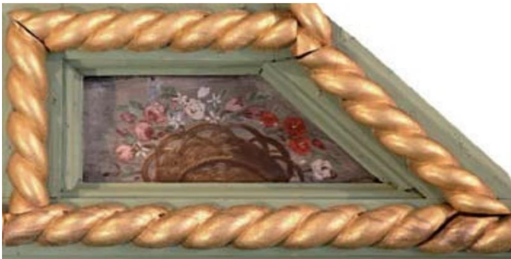
Slika 26. Košara s cvijećem

grb peraške općine, patrone svetišta. Križ drže dvije ruke s natpisom: „ nama se valja dičiti križem Gospoda našega Isusa Krista. 97