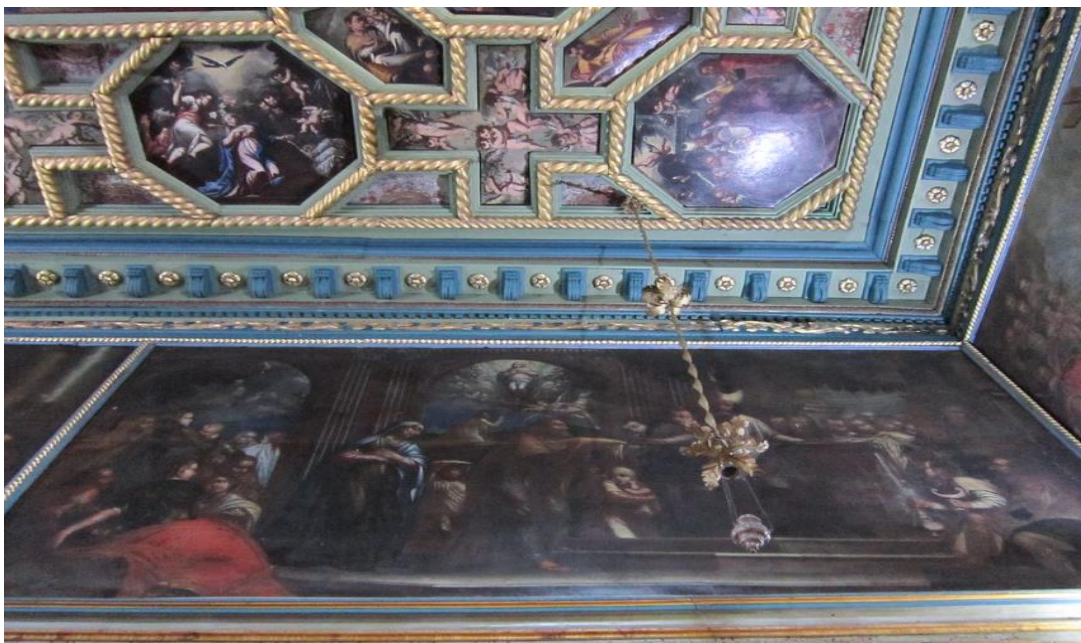
Slika 17. Odbijanje darova Joakima i Ane, Blagovijesti Joakimu i Immaculata Conceptio

Prikaz donošenja i odbijanja darova Joakima i Ane potječu iz bizantske umjetnosti 11. stoljeća. Bogorodičini roditelji, Joakim i Ana, obilježeni su nimбом pred prvosvećenikom koji stoji ispred zatvorenih vratnica oltara u znak odbijanja dara. Slikari su imućnom Joakimu pridodali janjad, ovce ili golubove, a od kasnog srednjeg vijeka pladanj pokriven tkaninom koji prvosvećenik odbija baš kao na slici u Gospi od Škrpjela. 83