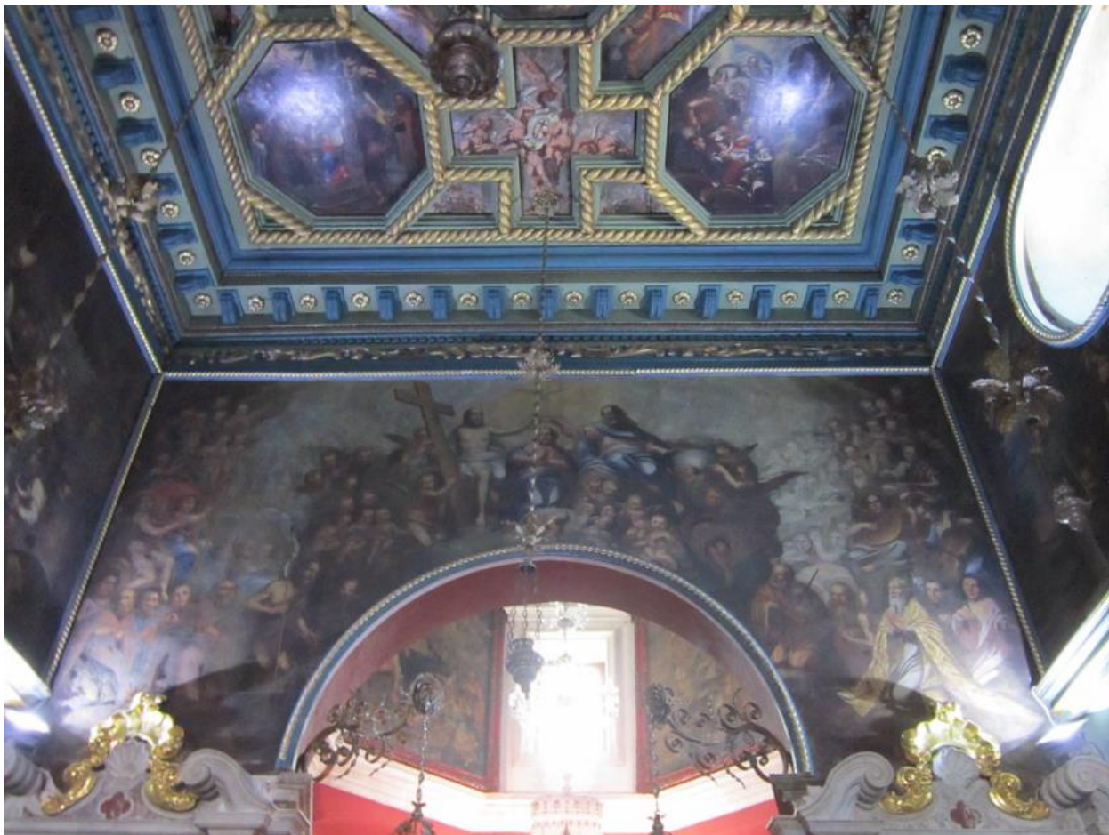
Slika 27. Krunjenje Bogorodice

Promatrajući cjelokupni obujam Kokoljinih djela može se uočiti konstantni kontrast između dominantnog čistog baroka i pojedinosti iz kojih izbija provincijska komponenta, između uspješnog kolorističkog ili svjetlosnog rješenja i površnog efekta ili nespretno nacrtane pojedinosti. To odražava tešku situaciju umjetnika u provinciji. Ovakvim suprotnostima Kokolja je odrazio sredinu u kojoj je živio, koja mu je davala poticaja, ali ga i razapinjala. Kokolja zauzima značajno mjesto u povijesti baroknog slikarstva na ovim prostorima svojom karakterističnom evolucijom, vrsnoćom u izvjesnim slikama, a i samom činjenicom da je bio pionir novih rodova mrtve prirode i krajolika u Dalmaciji. 99