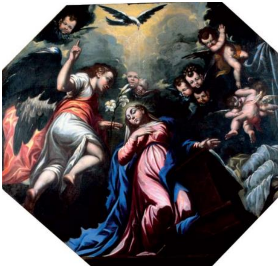
Slika 22. Navještenje (Blagovijesti)

U okviru marijanskih ciklusa Susret Marije i Elizabete se stavlja u istoj razini kao i Navještenje. Tim dvama predstavama naglašavaju se dva vida božanskog materinstva: Blagovijesti ga predočavaju, a Susret potvrđuje. 93