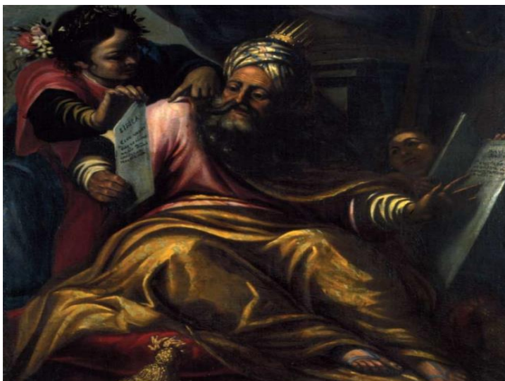
Slika 15. Kralj David i libijska proročica, Gospa od Škrpjela, Perast

Zaharija i europska sibila, Izaija i delfijska sibila, Jeremija i eritrejska sibila, Habakuk i samijska sibila, Balaam i helespontska sibila, Baruh i kumejska sibila nalaze se na sjevernom zidu u donjem redu. Gornji red ima dva velika platna: Silazak Duha Svetog te kompozicija na kojoj je prikazano Odbijanje darova Joakima i Ane, Naviještanje Joakimu i Bogorodica Bezgrešnog Začeca. 65