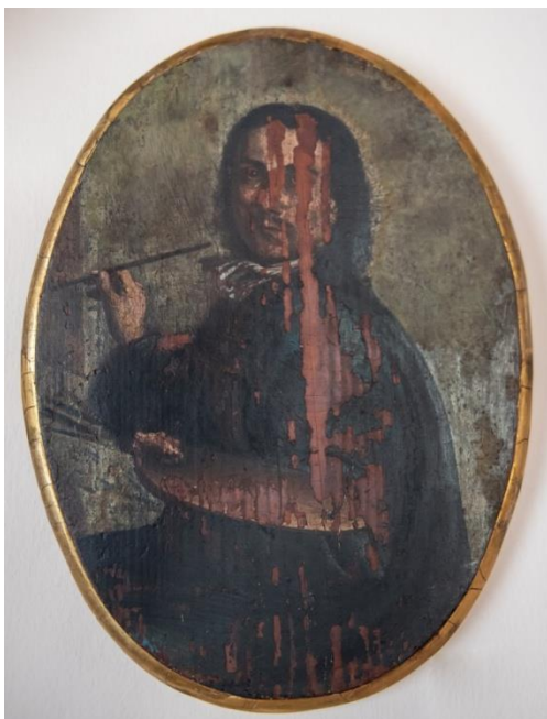
Slika 12. Autoportret Tripa Kokolje, Zavičajni muzej Perast

smrti. Manjak izvornih svjedočanstava nadoknađen je tijekom 19., 20. i 21. stoljeća. Tada su o njemu pisali i lokalni pisci i mnogi povjesničari umjetnosti. 53