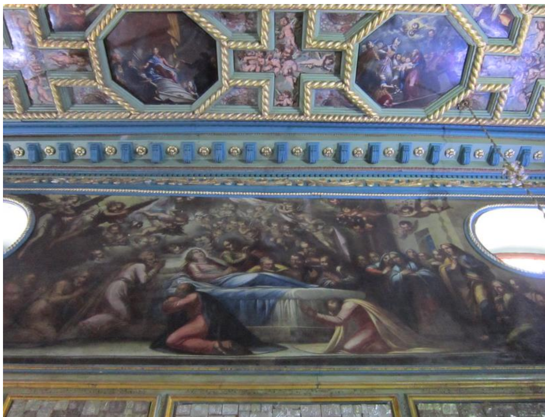
Slika 19. Bogorodičino opraštanje od zemaljskog života

Tema Bogorodičino opraštanje od zemaljskog života tradicionalno je nazvana Smrt Bogorodice. Prikazana je na cijeloj površini gornjeg dijela južnog zida crkve, presječenog s dva ovalna prozora. Kako je ova tema predstavljena, slični na opis Bogorodičine smrti u Ljetopisu. Zmajević, govoreći o tom događaju, prati dugu tradiciju čiji je korijen u apokrifnim tekstovima. Na slici se prikazuje dolazak velikih nebeskih glasnika s lijeve strane koji najavljuju Mariji skorbu smrt kao odgovor na njenu molitvu Bogu da je oslobodi života umrloga. Klečeći apostoli nalaze se oko Bogorodičine postelje, okupljeni zalaganjem Ivana koji je naslikan uz Marijino uzglavlje s prekrizhenim rukama na grudima. Bogorodičine jeruzalemske družbenice kojima je namijenila svoju odjeću, nalaze se na desnoj strani. Uobičajen Marijin atribut: ruže, nose anđeli. Slika predstavlja trenutak kada se Bogorodica oprašta od zemaljskog života što se vidi po otvorenim očima Gospe i položaju sklopljenih ruku na krilu. 86