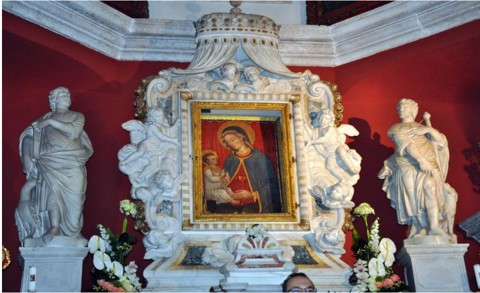
Slika 9. Kipovi glavnog oltara