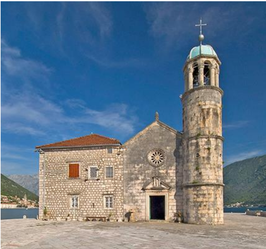
Slika 2. Pročelje crkve

Crkva je malena opsegom, jednostavne, ali bogate vanjštine. Ukusno je rađena od finog korčulanskog kamena. Sastoji se od obične lađe i kapele koja je presvođena kupolom. Ukas na glavnim i pobočnim vratima je renesansa koja prelazi u barok, rađen početkom 17. stoljeća. Nad glavnim vratima, u udubini izrađenoj u obliku portala, nalazi se kip presvete Djevice s Djetetom arhaičnog držanja. Na pročelju je romanička zvijezda. Ukas ispod obruba na krovu je po uzoru renesanse. Kupola je nad žrtvenikom visoko 11 metara, s križem na vrhu 12 i pol metara. 18 Podignuta je 1722. 19