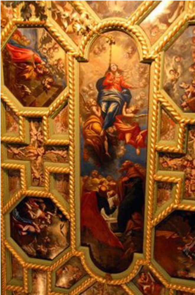
Slika 21. Uznesenje Bogorodice

Kod Uznesenja, apostoli ostaju kraj praznog Bogorodičinog groba dok prate njezin trijumfalni uspon ka nebu. Kraj Marije su anđeli. 89