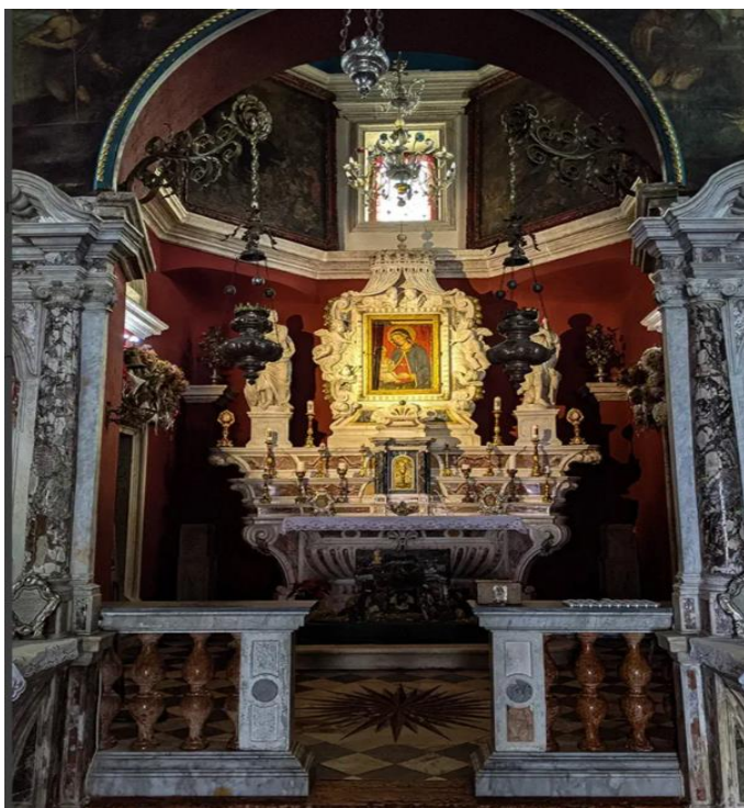
Slika 7. Glavni oltar

pia communitas erexit anno MDCCIX., što znači da ju je pobožna općina podigla na jednodušnu želju godine 1719. Na sredini je peraški grb s križem kojeg drže dvije ruke. Svetohranište dopunjeno kipovima anđela nosi mramorni okvir za Gospinu sliku. Zbog postavljanja novog oltara crkvi je između 1720. i 1725. godine u cijeloj širini lađe dodano kvadratno svetište s osmerostranim tamburom i kupolom prekrivenom olovom. Projektant svetišta najvjerojatnije je bio dubrovački majstor Ilija Katičić. Peraštani su ga pozvali pismom 7. rujna 1720. godine. Prema dokumentima, u Perastu je boravio nekoliko dana. Kamen je donesen od Jurja Foretića iz Korčule, a gradnju su izveli Vuk Kandijot iz Dobrote i Petar Dubrovčanin. Svetište je popločano mramorom iz Genove 1726. godine. Dvije godine prije toga, 1724. kapetani Luka Bačević i Vicko Smecchia darovali su crveni damast kojim su obloženi zidovi svetišta. Smecchia je kupio srebrni viseći svijećnjak 1748. godine. Ivan Zanobetti, kotorski biskup, posvetio je crkvu 13. svibnja 1736. godine. 29