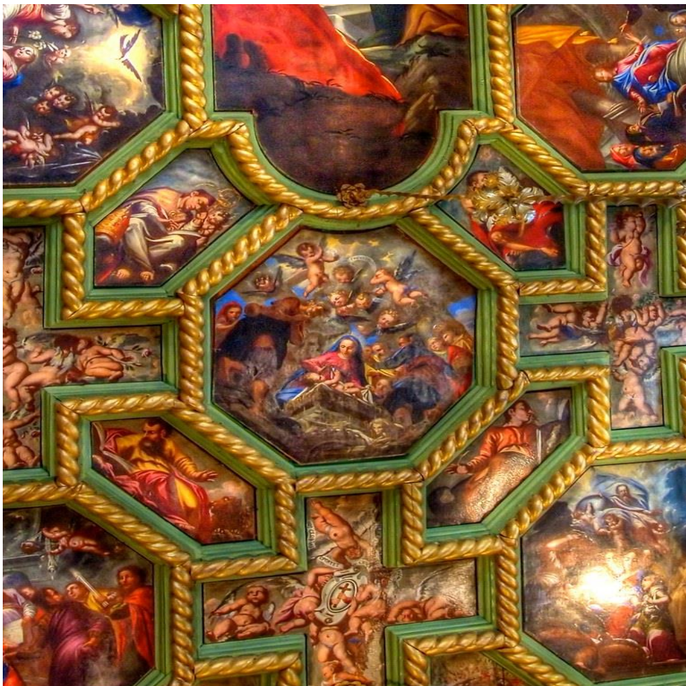
Slika 25. Detalj ciklusa sa stropa

sveti Jerolim te straga s gornje strane sveti Lav Veliki i s donje strane sveti Ambrozij. Uz dvije osmokutne slike koje se nadovezuju na zaobljene okrajke Uznesenja prikazani su u nepravilnim šesterokutima četiri evanđelista. Sprijeda su Marko i Ivan, a straga Luka i Matej. Prikazani su sa svojim simbolima te sjede gotovo ležeći u dužini slike. Oci Crkve sjede uspravno u širini slike. Između osmerokutnih slika na stropu nalaze se prikazi anđela. Uokvireni su u obliku križa te ih je ukupno osam. 96