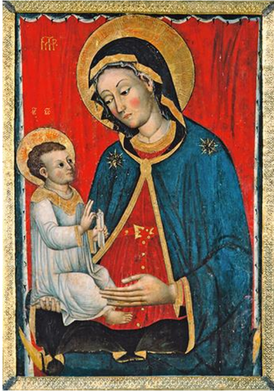
Slika 10. Ikona Gospe od Škrpjela

Bogorodičina ikona na oltaru Gospe od Škrpjela djelo je Kotoranina Lovra Dobričevića. Nastala je sredinom šestog desetljeća 15. stoljeća. 38