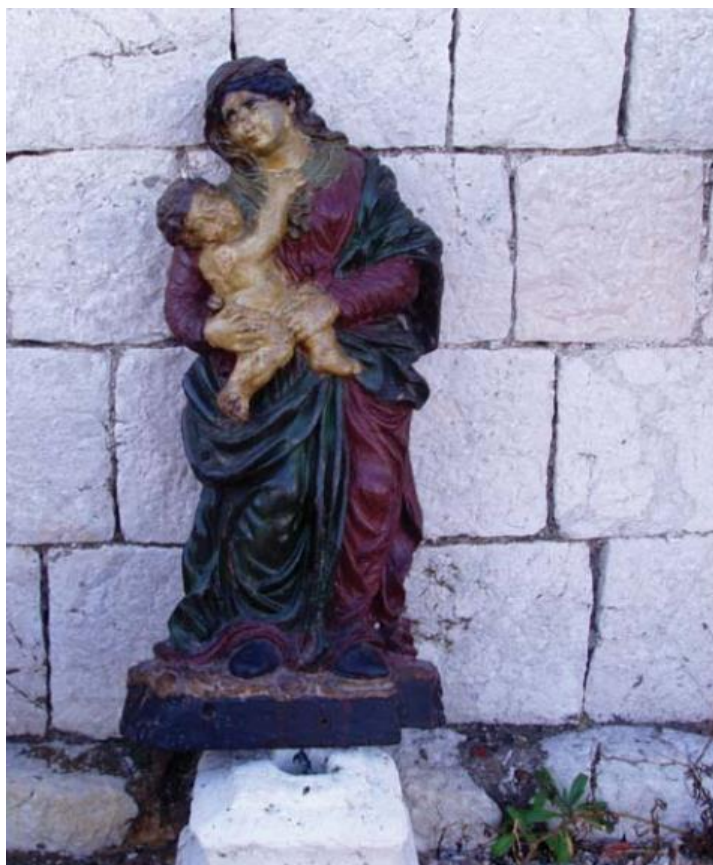
Slika 30. Pulena Gospe s Kristom, Gospa od Škrpjela, 18. st.

U istoj zbirci je pulena koja prikazuje muškarca s kraja 18. stoljeća. Svetište je pribavilo i vrlo kvalitetnu baroknu pulenu iz obitelji Dabinović. Ta pulena prikazuje Bogorodicu s Kristom u naručju. Pulena Gospe s Kristom u stojećem položaju s bazom napravljena je u tvrdom drvu, u visokom reljefu. Na poledini drvenog reljefa je kružni utor gdje se ona prikačivala na nosač. Datira se u 18. stoljeće. Spada u skupinu kvalitetnijih pulena. Svetište posjeduje i drvenu renesansnu pulenu Gospe s Kristom iz 16. stoljeća. 116