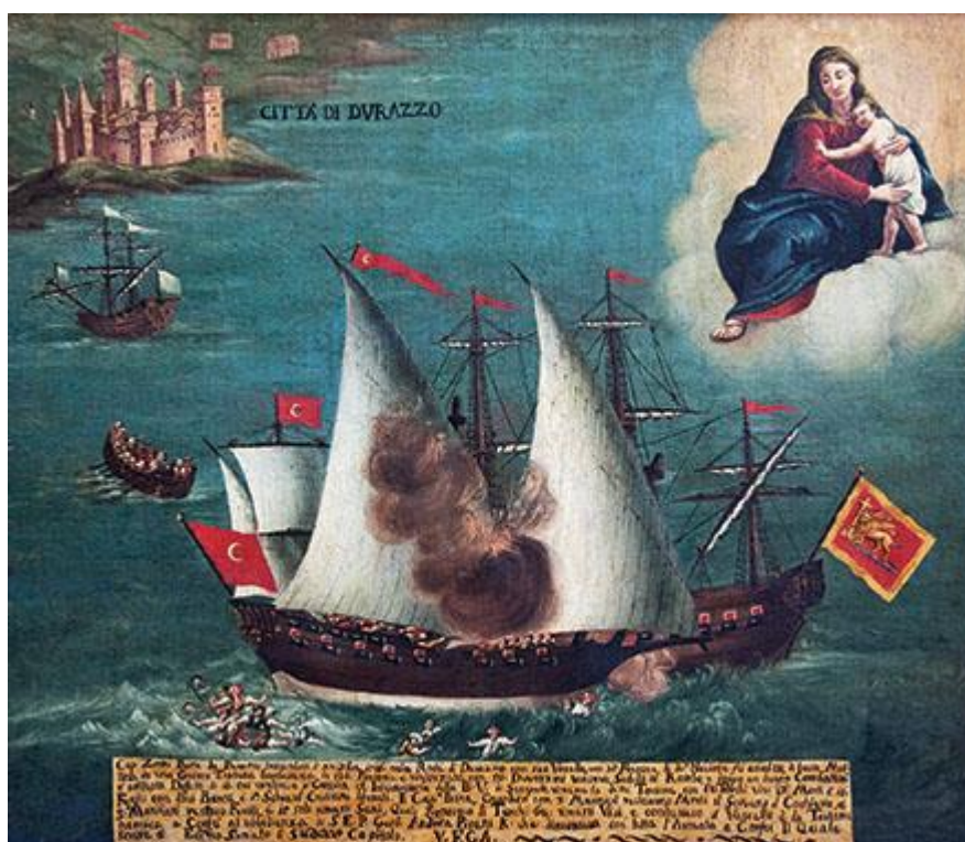
Slika 31. Slika borbe peraškog broda pod vodstvom Jurja Bana s turskim brodom ispred Drača, Muzej Gospe od Škrpjela, 1716.

Ovu muzejsku zbirku svetišta Gospe od Škrpjela sačinjavaju većinom darovi peraških pomoraca iz 17. i 18. stoljeća. Slike peraških jedrenjaka, uz veliki broj arheoloških eksponata i predmeta umjetničkih zanata, govore o nekadašnjem životu Perasta i uloge Bogorodice u njihovim životima. 122