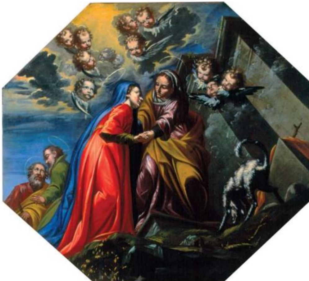
Slika 23. Susret Marije i Elizabete

Poklonstvom pastira (Rođenjem Kristovim) ispunjena su predskazanja proroka i sibila o rođenju Spasitelja. Tema Kristovog rođenja od vremena Tridentinskog koncila se izražava Poklonjenjem pastira, a ne kao u romanici predstavljanjem Kristova rođenja. To je trenutak kada je Bogorodica bezbolno rodila Krista, poklonila se Djetetu i odala hvalu Gospodinu. Prvi koji su imali čast pokloniti se Nebeskom kralju bili su rođeni u siromaštvu pastiri. Nasuprot Poklonjenju pastira prikazano je Poklonjenje kraljeva. 94