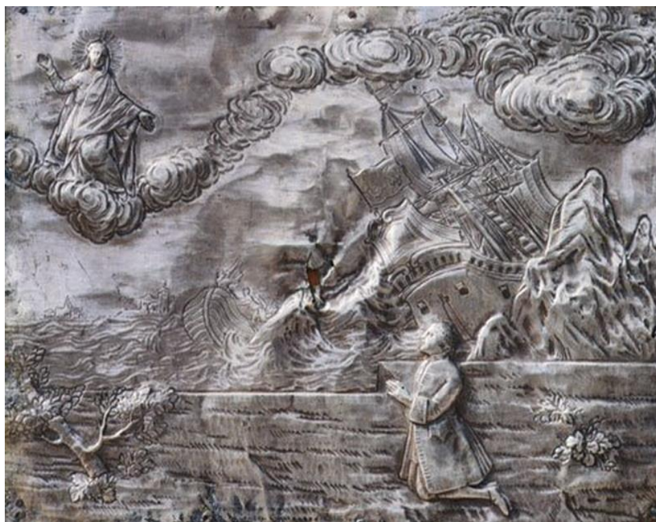
Slika 29. Srebrna votivna pločica

Srebrne pločice različitih veličina i težina učvršćene su u 15 okvira na zidovima svetišta. Stavljene su na dovoljnu visinu kako bi se očuvale od svetogrđnih ruku. Smještaj zavjetnih pločica promijenjen je u moderno vrijeme što se da zaključiti i po redu kojim su postavljene. Daleko su od ikakvog kronološkog rasporeda vjerojatno kako bi se izbjegle moguće krađe te da ih se izloži pogledu javnosti. Težina i debljina srebrnih pločica otkrivala je financijsko stanje naručitelja. Srebro je u to vrijeme bilo skupo te se naručitelj morao žrtvovati u svakodnevnom životu čak i za mali zagovor. Najveći broj zavjetnih pločica dolazio je od strane puka. 104