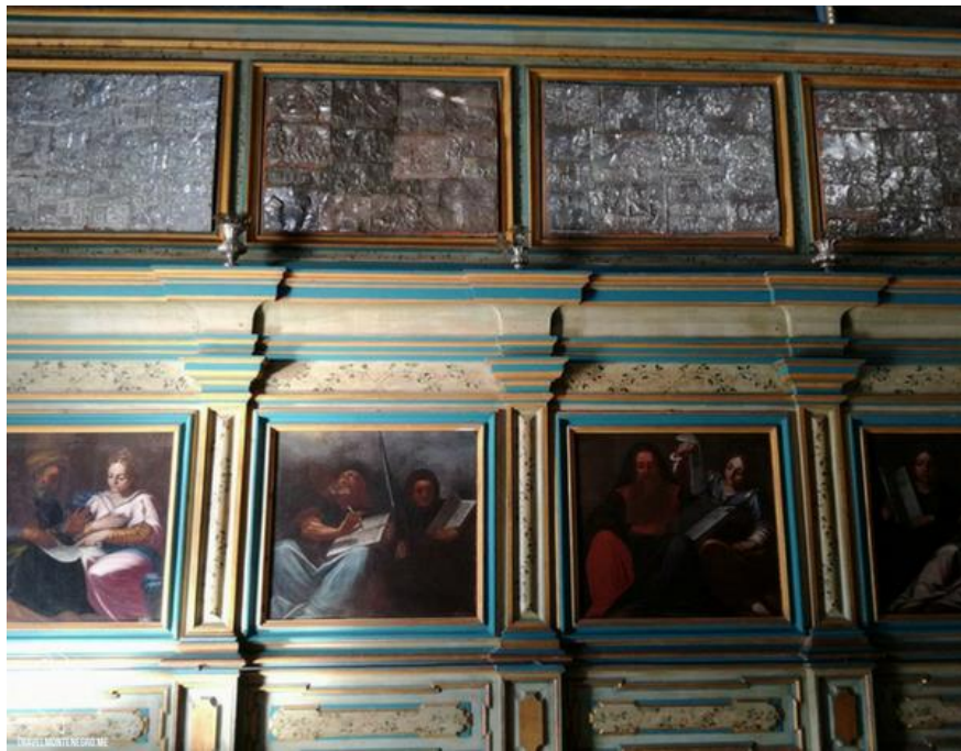
Slika 28. Zavjetne pločice

Oprema crkve uključuje i srebrne zavjetne pločice (ex-voto) koje su povezane u niz te se prostiru duž crkvenih zidova i ogradne stijenke pjevališta. Nastale su u vremenskom rasponu od 17. do 19. stoljeća. Većinom su djela lokalnih kotorskih zlatara, dok je manji i najljepši dio nastao u mletačkim radionicama. Može se reći da je riječ o djelima pučke umjetnosti neovisno o oscilacijama, od plošnih i naivnih radova do stilski definiranih majstorija. Nastale su kao znak zahvalnosti pojedinaca koji su se na moru suočili sa smrću i ostalim opasnostima. 101