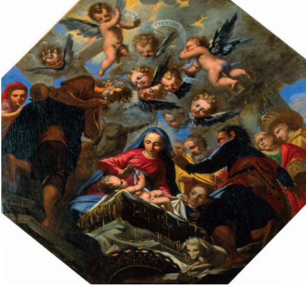
Slika 24. Poklonstvo pastira (Rođenje Kristovo)

Barokna pobožnost koja povlači Bogorodičinu svijest da će njezin Sin svijet spasiti svojom smrću u svjetlosti Šimunovog proročanstva tumačila je niz tema iz Bogorodičinog života između ostalih i Prikazanje Krista u hramu. Temom Bijeg u Egipat nastavlja se Marijina patnja i stradavanje. Ona hoda noseći Krista u naručju te je Josip brižno očekuje u podnožju stepenica. Rasprava dvanaestogodišnjeg Krista sa židovskim misliocima (tema Krist propovijeda u hramu) u Gospi od Škrpjela prikazana je u skladu s interpretacijama toga vremena ove teme. Osnovna ikonografska shema koja je formirana od srednjeg vijeka, polazi od antičkih prikaza razgovora filozofa. Krist većinom sjedi na katedri, okružen židovskim svećenicima, dok u drugom planu stoje zabrinuti roditelji. 95