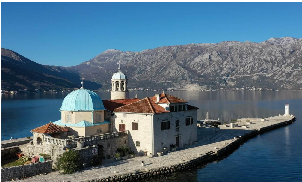
Slika 4. Čuvareva kuća i terasa s kamenom balustradom

U čuvarevoj kući čuvao se naslon za krmu stare Gospine općinske lađe koja je služila za prijenos Gospine slike za vrijeme ceremonije. Kрма je ukrašena drvorezom i na njoj je općinski grb na zlatnom polju, a pored njega krunjena žena s Marijinim monogramom 26