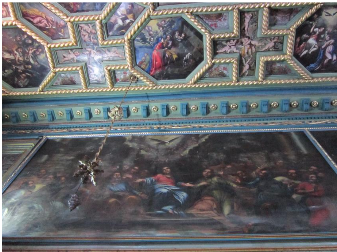
Slika 18. Silazak Duha Svetoga

Po uzoru na Djela apostolska gdje je opisana zajednička molitva Marije i apostola uoči silaska Svetog Duha, napravljen je ikonografski tip predstave Silazak Duha Svetoga. U centru je Bogorodica koja je okružena apostolima. Na najstarijim sačuvanim primjerima, nastalim u doba utemeljenja kršćanske Crkve, središnja figura Bogorodice izražavala je prisutnost crkve u njoj otjelotvorene. Teolozi zapadne Crkve tumačili su da je Marija okupila apostole i svojim molitvama ubrzala silazak Duha Svetoga. Zmajević u skladu s takvim tumačenjima opisuje u Ljetopisu: pribivaše u istu kuću na posljednjoj večeri i u njoj počekaše došašće Duha svetoga, koga primi sveta Djevica s tolikom većom milosti i darovima, nego svi ostali i pristojашe se nje dostojanstvu, budući ona ostala majka i naučiteljica sve crkve kršćanske. 85