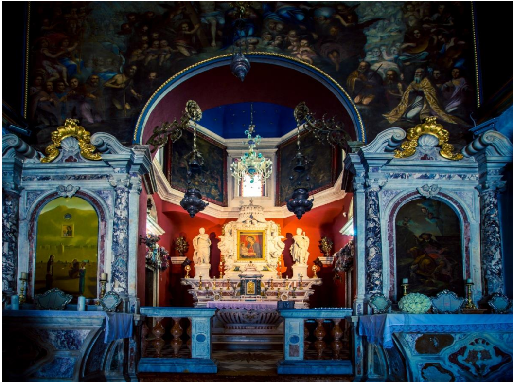
Slika 11. Bočni oltari

slike. Na oltaru je danas pala s prikazom bokeljskih svetaca crnogorskog slikara Voje Stanića (1924.). 52