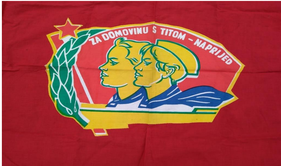
Slika 7. Pionirska zastava

Bitan dio pionirske organizacije jest Pionirski zavjet ili svečano obećanje koji je bio obavezan dio primanja u pionire. Ustaljivanjem programa primanja nakon uvodnih riječi i prijavaka, za to zaduženih pionira, prisegom je započinjalo aktivno uključivanje svih pristupnika u ritual. Prilikom izgovaranja teksta zavjeta pristupnici nisu imali kape i marame koje su pak dobivali poslije izgovorene prisege. Sam tekst zavjeta mijenjao se i nadopunjavao, ali osnovne poruke uvijek su ostajale iste. To su „vjernost domovini, čuvanje njezine neovisnosti i skladnih međunacionalnih odnosa, davanje svojeg doprinosa njezinom napretku prije svega dobrim učenjem, poštivanje općeljudskih vrijednosti te općeprihvaćenih moralnih i karakternih osobina.“ 136 Prvi Pionirski zavjet koji je sačuvan dolazi iz 1946. godine, međutim, najveća promjena dolazi 1963. godine kad je u Hrvatskoj pripremljen i isproban novi tekst koji je bio bliži dječjoj dobi i nije sadržavao pojmove kojih djeca nisu bila svjesna. Promjena je nastala i u imenu jer se otada Pionirski zavjet preimenovao u „svečano obećanje“ jer je bio primjereniji dječjoj dobi za razliku od zavjeta koji nosi preveliku težinu. Tekst svečanog obećanja pionira glasi: