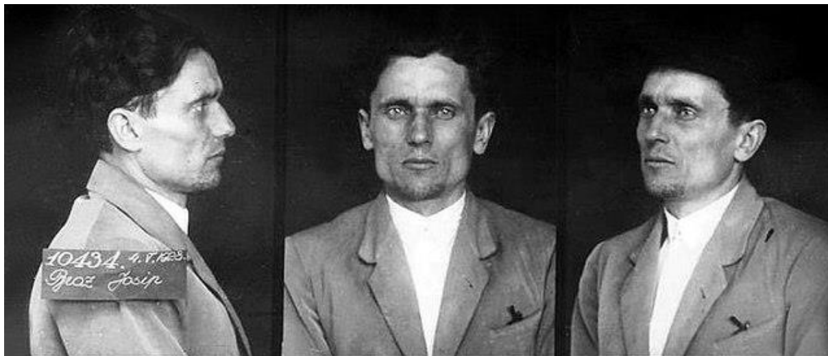
Slika 2. Fotografije iz policijske kartotetke u Zagrebu (1928.)

radničkih novina“, a prilikom pretresa sobe u kojoj je spavao „mnogo partijske građe... i jedan revolver s municijom, četiri ofenzivne ručne bombe i municiju za vojničke puške.“ 27 Po pronađenim bombama u stanu cijeli će proces kasnije biti poznat kao „Bombaški proces.“