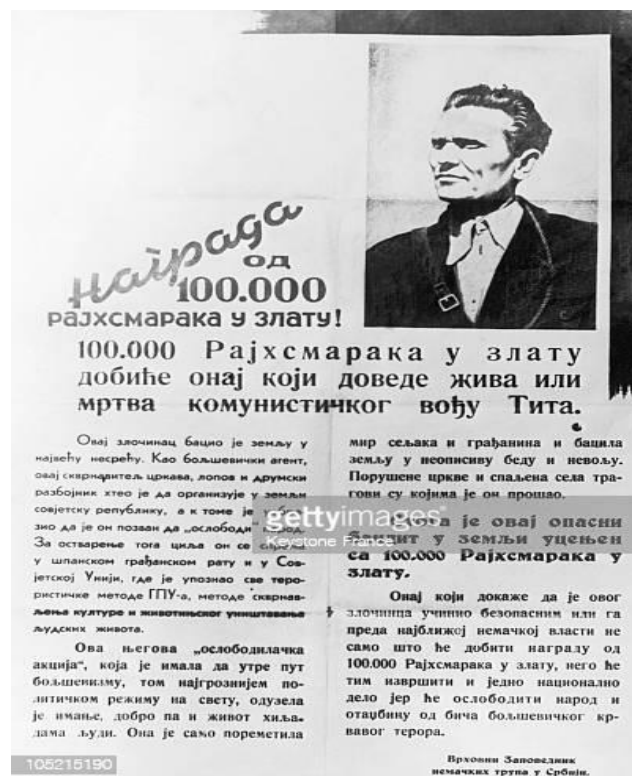
Slika 3. Njemački plakat kojim se poziva na hvatanje Tita

interes šire javnosti koja raspravlja o identitetu njihova vođe. Draža Mihailović već 1941. godine prilikom pokušaja dogovaranja suradnje između partizana i četnika javlja izbjegličkoj vladi u Londonu kako je vođa partizana komunist koji nosi lažno ime Tito. Na zapadu se tad javlja mišljenje kako je vođa partizana V. Z. Lebedev, koji je bio sovjetski vojni izaslanik u Beogradu prije rata, ali ubrzo se javljaju i prve mistične priče kako je vođa partizana „neki Tito, za koga se vezuju najveće misterije.“ Razmišljanja su išla toliko daleko da se pretpostavljalo kako Tito uopće ne postoji nego se radi o akronimu za Terorističku organizaciju Treće internacionale, što bi značilo da čim jedan vođa pogine njegovo mjesto zauzima idući što za cilj ima održavanje privida besmrtnosti. 59 Među samim partizanima bilo je raznih nagađanja o njegovu identitetu, a budući da je Vrhovni štab na čelu s Titom od početka težio organizaciji trupa, smatrali su kako vođa treba imati iskustvo Španjolskog građanskog rata, što ih je navodilo da se radi o Kostu Nađu dok je, s druge strane, kružila priča kako se ipak radi o Moši Pijade. Nijemci tako već 1941. godine nude nagradu od 100 000 rajhmaraka u zlatu za osobu koja uhvati Tita mrtva ili živa. Na priloženoj fotografiji nalazi se njemački plakat, napisan ćirilicom, s tekstom: „Nagrada od 100 000 rajhsmaraka u zlatu dobiće onaj koji dovede živa ili mrtva komunističkog vođu Tita.“