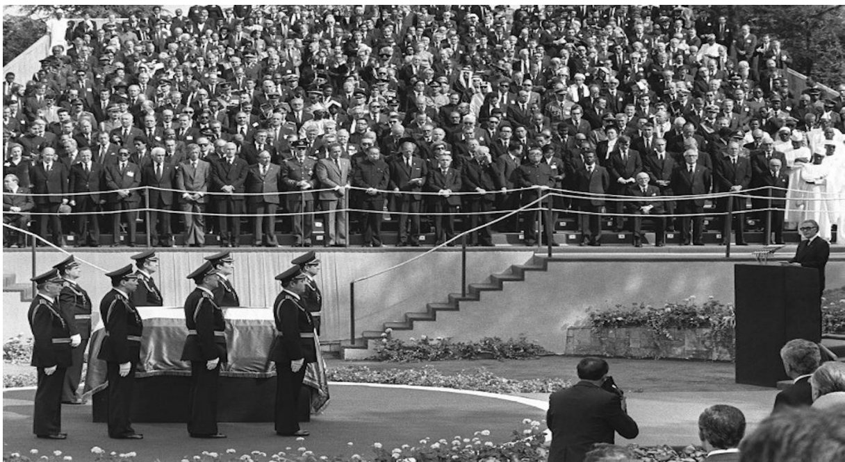
Slika 11. Pogreb Josipa Broza Tita

ličnosti koji je stvaran, došla su četiri kralja, 31 predsjednik države, šest prinčeva, 22 premijera i 47 ministara vanjskih poslova, a sami političari bili su članovi oba hladnoratovska bloka i Pokreta nesvrstanih. Tvrdi se da je Titov pogreb okupio najveći broj državnika, što se nikad prije nije dogodilo. Slavko i Ivo Goldstein pišu kako je sama veličina pogreba i posjećenost govorila kako je svijet bio svjestan da Titovom smrću odlazi posljednji od velikih vojskovođa Drugog svjetskog rata, kao i zaslužnih poslijeratnih državnika. 164 Priložena fotografija prikazuje tako navedene državnike i grandiozni pogreb koji je ujedno bio i kulminacija Titova kulta ličnosti s obzirom na to da će u sljedećim godinama uslijediti proces pokušaja održavanja kulta, ali i proces demistifikacije i detronizacije Titova lika i djela te samog kulta ličnosti.