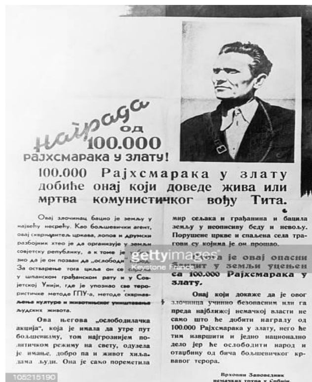
Slika 3. Njemački plakat kojim se poziva na hvatanje Tita

interes šire javnosti koja raspravlja o identitetu njihova vođe. Draža Mihailović već 1941. godine prilikom pokušaja dogovaranja suradnje između partizana i četnika javlja izbjegličkoj vladi u Londonu kako je vođa partizana komunist koji nosi lažno ime Tito. Na zapadu se tad javlja mišljenje kako je vođa partizana V. Z. Lebedev, koji je bio sovjetski vojni izaslanik u Beogradu prije rata, ali ubrzo se javljaju i prve mistične priče kako je vođa partizana „neki Tito, za koga se vezuju najveće misterije.“ Razmišljanja su išla toliko daleko da se pretpostavljalo kako Tito uopće ne postoji nego se radi o akronimu za Terorističku organizaciju Treće internacionale, što bi značilo da čim jedan vođa pogine njegovo mjesto zauzima idući što za cilj ima održavanje privida besmrtnosti. 59 Među samim partizanima bilo je raznih nagađanja o njegovu identitetu, a budući da je Vrhovni štab na čelu s Titom od početka težio organizaciji trupa, smatrali su kako vođa treba imati iskustvo Španjolskog građanskog rata, što ih je navodilo da se radi o Kostu Nađu dok je, s druge strane, kružila priča kako se ipak radi o Moši Pijade. Nijemci tako već 1941. godine nude nagradu od 100 000 rajhmaraka u zlatu za osobu koja uhvati Tita mrtva ili živa. Na priloženoj fotografiji nalazi se njemački plakat, napisan ćirilicom, s tekstom: „Nagrada od 100 000 rajhsmaraka u zlatu dobiće onaj koji dovede živa ili mrtva komunističkog vođu Tita.“