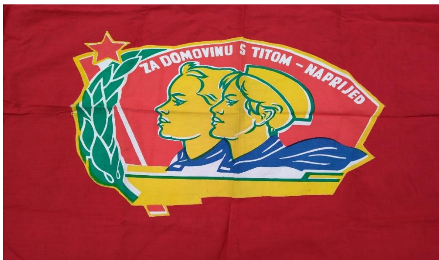
Slika 7. Pionirska zastava

Bitan dio pionirske organizacije jest Pionirski zavjet ili svečano obećanje koji je bio obavezan dio primanja u pionire. Ustaljivanjem programa primanja nakon uvodnih riječi i prijavaka, za to zaduženih pionira, prisegom je započinjalo aktivno uključivanje svih pristupnika u ritual. Prilikom izgovaranja teksta zavjeta pristupnici nisu imali kape i marame koje su pak dobivali poslije izgovorene prisege. Sam tekst zavjeta mijenjao se i nadopunjavao, ali osnovne poruke uvijek su ostajale iste. To su „vjernost domovini, čuvanje njezine neovisnosti i skladnih međunacionalnih odnosa, davanje svojeg doprinosa njezinom napretku prije svega dobrim učenjem, poštivanje općeljudskih vrijednosti te općeprihvaćenih moralnih i karakternih osobina.“ 136 Prvi Pionirski zavjet koji je sačuvan dolazi iz 1946. godine, međutim, najveća promjena dolazi 1963. godine kad je u Hrvatskoj pripremljen i isproban novi tekst koji je bio bliži dječjoj dobi i nije sadržavao pojmove kojih djeca nisu bila svjesna. Promjena je nastala i u imenu jer se otada Pionirski zavjet preimenovao u „svečano obećanje“ jer je bio primjereniji dječjoj dobi za razliku od zavjeta koji nosi preveliku težinu. Tekst svečanog obećanja pionira glasi: