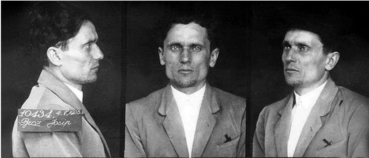
Slika 2. Fotografije iz policijske kartotetke u Zagrebu (1928.)

radničkih novina“, a prilikom pretresa sobe u kojoj je spavao „mnogo partijske građe... i jedan revolver s municijom, četiri ofenzivne ručne bombe i municiju za vojničke puške.“ 27 Po pronađenim bombama u stanu cijeli će proces kasnije biti poznat kao „Bombaški proces.“