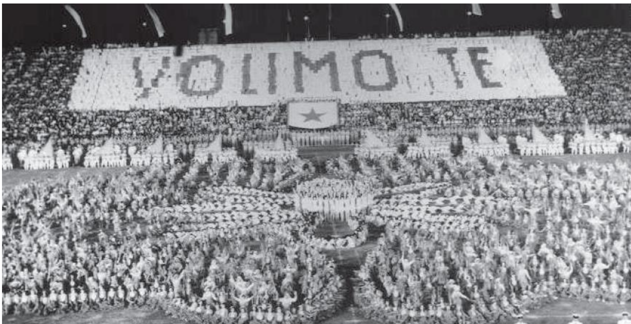
Slika 10. Proslava Dana mladosti 1972. godine

U Hrvatskoj je 1953. godine uspostavljena Pionirska štafeta koja se održavala kao najmasovnija manifestacija hrvatskih pionira sve do 1982. godine kad je zamjenjuje Spomenica rada i drugarstva. U ostalim republikama pionirske su štafete bile direktno povezane s Danom mladosti i Štafetom mladosti, dok su u Hrvatskoj, s ciljem oporavka pionirskih organizacija 50-ih godina, pioniri sudjelovali i u Pionirskoj štafeti. 155 Rezultati Pionirske štafete vidljivi su na svečanostima i manifestacijama koje su se odvijale između ožujka i svibnja, a štafetne palice s pionirskim nositeljima povezivale su svaku pionirsku organizaciju te su nošene hrvatskim općinama s konačnim ciljem koji se nalazio u gradu Zagrebu. Pionirska štafeta tad je kulminirala u masovnom završnom zboru koji se u početku održavao na Trgu Republike, danas Trg bana Jelačića, a kasnije u Pionirskom gradu – današnjem Gradu mladih. Zadnja dionica puta vodila je štafetu u Beograd gdje je izaslanstvo sačinjeno od nekoliko desetaka pionira iz svih dijelova Hrvatske uručilo štafetne palice Josipu Brozu Titu. Pionirska štafeta pak ne predstavlja štafetu u doslovnom smislu riječi „nego je nazivnik za raznovrsne aktivnosti pionira, koje se povezuju prenošenjem štafetnih simbola. To je zbir spretno povezanih sportskih, kulturno-umjetničkih, svečanih i radnih elemenata.“ 156