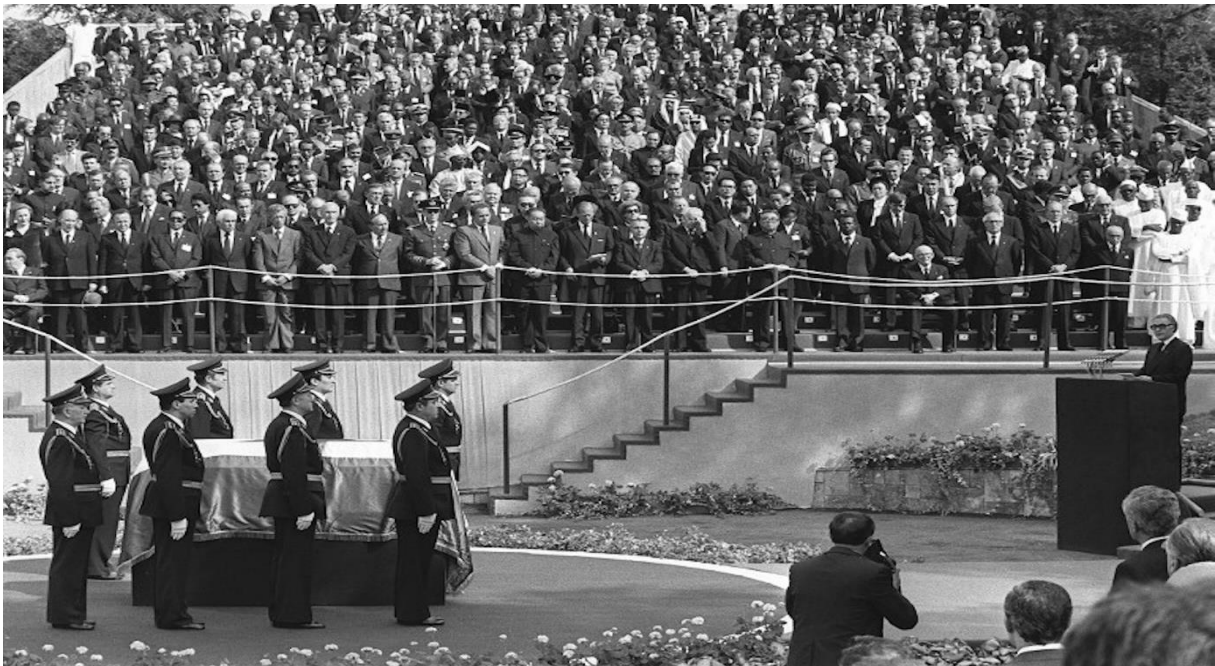
Slika 11. Pogreb Josipa Broza Tita

ličnosti koji je stvaran, došla su četiri kralja, 31 predsjednik države, šest prinčeva, 22 premijera i 47 ministara vanjskih poslova, a sami političari bili su članovi oba hladnoratovska bloka i Pokreta nesvrstanih. Tvrdi se da je Titov pogreb okupio najveći broj državnika, što se nikad prije nije dogodilo. Slavko i Ivo Goldstein pišu kako je sama veličina pogreba i posjećenost govorila kako je svijet bio svjestan da Titovom smrću odlazi posljednji od velikih vojskovođa Drugog svjetskog rata, kao i zaslužnih poslijeratnih državnika. 164 Priložena fotografija prikazuje tako navedene državnike i grandiozni pogreb koji je ujedno bio i kulminacija Titova kulta ličnosti s obzirom na to da će u sljedećim godinama uslijediti proces pokušaja održavanja kulta, ali i proces demistifikacije i detronizacije Titova lika i djela te samog kulta ličnosti.