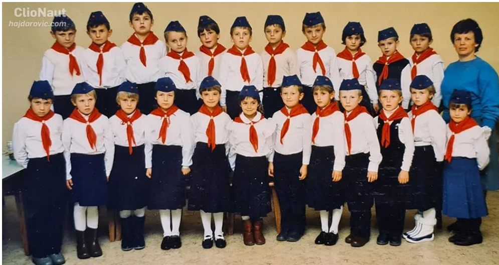
Slika 6. Titovi pioniri

hlačama i bijeloj košulji, dok su pionirke odijevale tamnoplavu suknju, bijelu bluzu i bijele čarape, a kao karakterističan dio izdvaja se crvena marama oko vrata i kapa koja nosi naziv titovka. Na priloženoj fotografiji možemo vidjeti djecu koja su obučena u navedene pionirske uniforme.