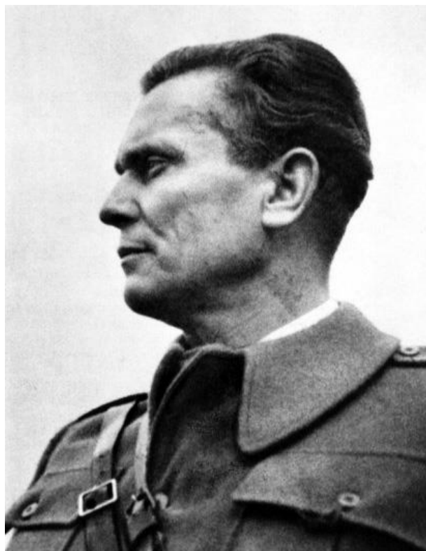
Slika 4. Josip Broz Tito – Bihać (1942.)

Aleksandar Ranković, Milovan Đilas i Edvard Kardelj pišu regionalnim i pokrajinskim rukovodstvima da moraju slaviti Tita kao vojskovođu i državnika. Već tad se u političkom diskursu javljaju nazivi za Tita poput „najmiliji drug“ i „najveći sin naših naroda“. 64 Zasjedanje u Jajcu poslužilo je izgradnji Titova lika i djela te njegovu predstavljanju naroda kao glavnog odgovornog čovjeka za NOB i osobe u kojoj se objedinjuje težnja svih naroda u Jugoslaviji za pobjedom nad okupatorskim snagama i uspostavom nove Jugoslavije. Možemo to vidjeti i u obrazloženju dodjeljivanja titule maršalu Josipu Brozu koji ju je zaslužio „genijalnim rukovođenjem NOP-om“. 65 Milovan Đilas, Titov suborac, potvrđuje to s desetogodišnjim vremenskim odmakom i kaže: „Otpočetka, od 1937. godine ponašao se autokratski – poslije Jajca on se vlastitom voljom i voljom vođa revolucije ustoličuje kao autokrat.“ 66 Autori Slavko i Ivo Goldstein u svojoj knjizi Tito navode kako je u dvije godine od početka ustanka Tito već slavljen u brojnim pjesmama, slikama i Augustinčićevim kipom, što je jedinstveno u svjetskim razmjerima s obzirom na to da čovjek Titova profila, kako autori pišu, dotad nije uspio u tako strelovitom usponu prema kultu ličnosti. 67 Josipu Brozu u tome je sigurno pomogla i partijska organizacija koju je učinio jedinstvenom i organiziranom,