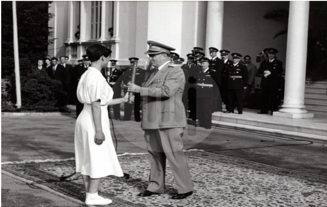
Slika 8. Doček štafete u Belom dvoru (Beograd, 1956.)