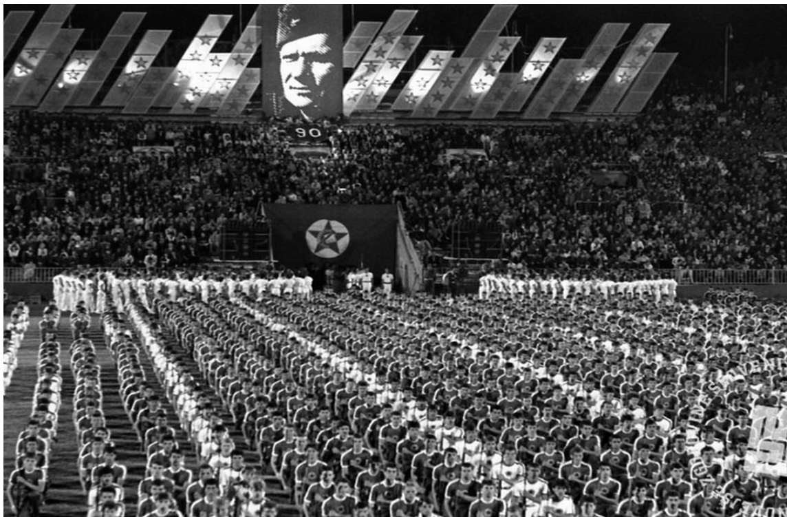
Slika 9. Dan mladosti na Stadionu JNA