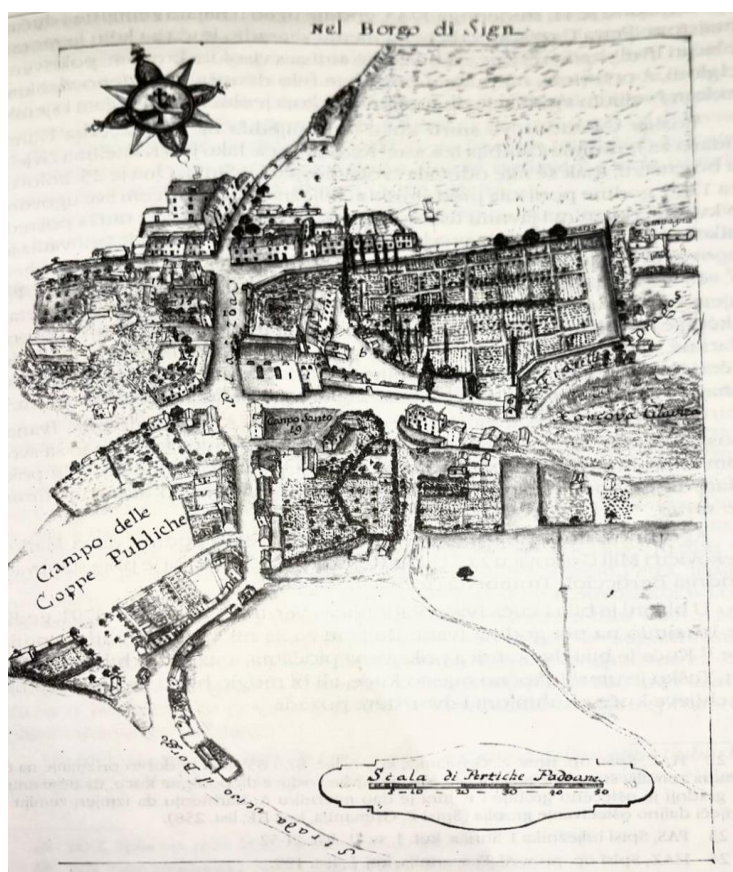
Slika 3 Pietro Coriri, Slika Sinja 1780. godine

O izgledu sinj u drugoj polovici 18. stoljeća svjedoči karta mjernika Pietra Corira u samostanskom katastru. Na karti je vidljiv raster ulica koji se održao i do danas. Trg ispred crkve, današnja Pijaca, račva se na šest ulica omeđenih stambenim kućama.