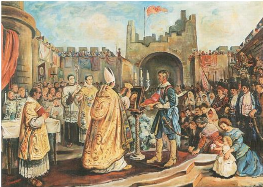
Slika 4 Krunidba Gospine slike

Na kruni je utisnut natpis: "In pcrpetuum coranata triumphat- anno MDCCXV" (Zauvijek okrunjena slavi- godine 1715.). Ovaj događaj postao je simbol Božje pomoći i snage u obrani domovine, duboko utemeljen u povijesti Sinja. 109