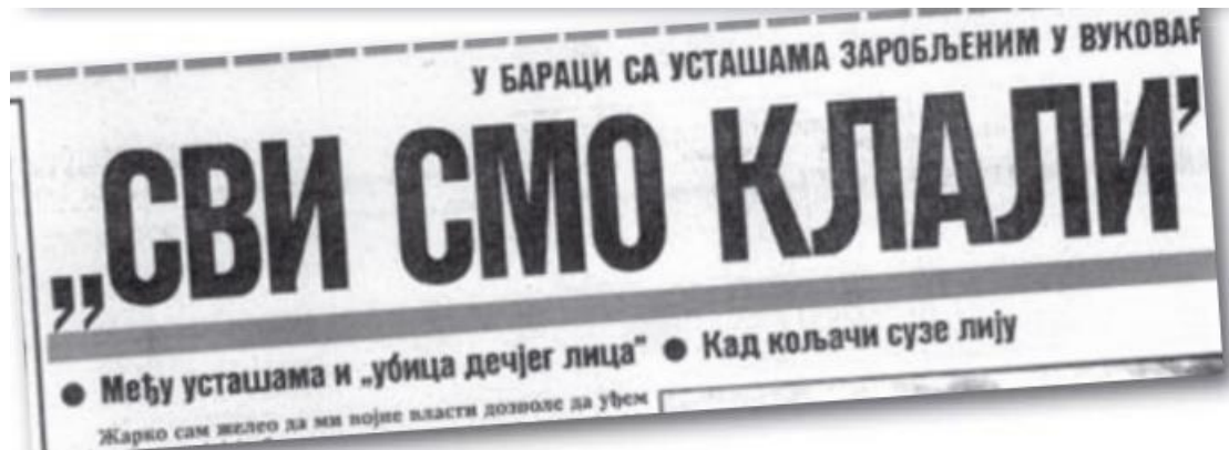
Slika 10. (u baraci sa ustašama zarobljenim u Vukovaru) "Svi smo klali", Politika Ekspres 24. studenoga 1991.

uhapšeni su, a među njima je i Davor Markobašić, zlikovac koji je pravio ogrlicu od dečijih prstića. Ogorčeni građani traže da im sudi narod i zato nisu dozvolili da zlikovci budu pod vojnom kontrolom. (...) 134